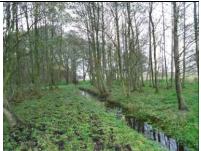
Træer langs grøfter og spredte grupper af træer bør ryddes