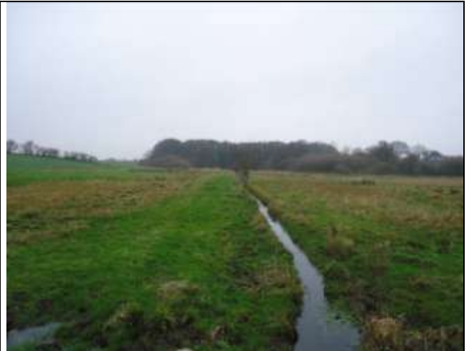
Strandengene på Halk Nor er gennemskåret af grøfter, der leder drænvand fra dyrkede marker til havet