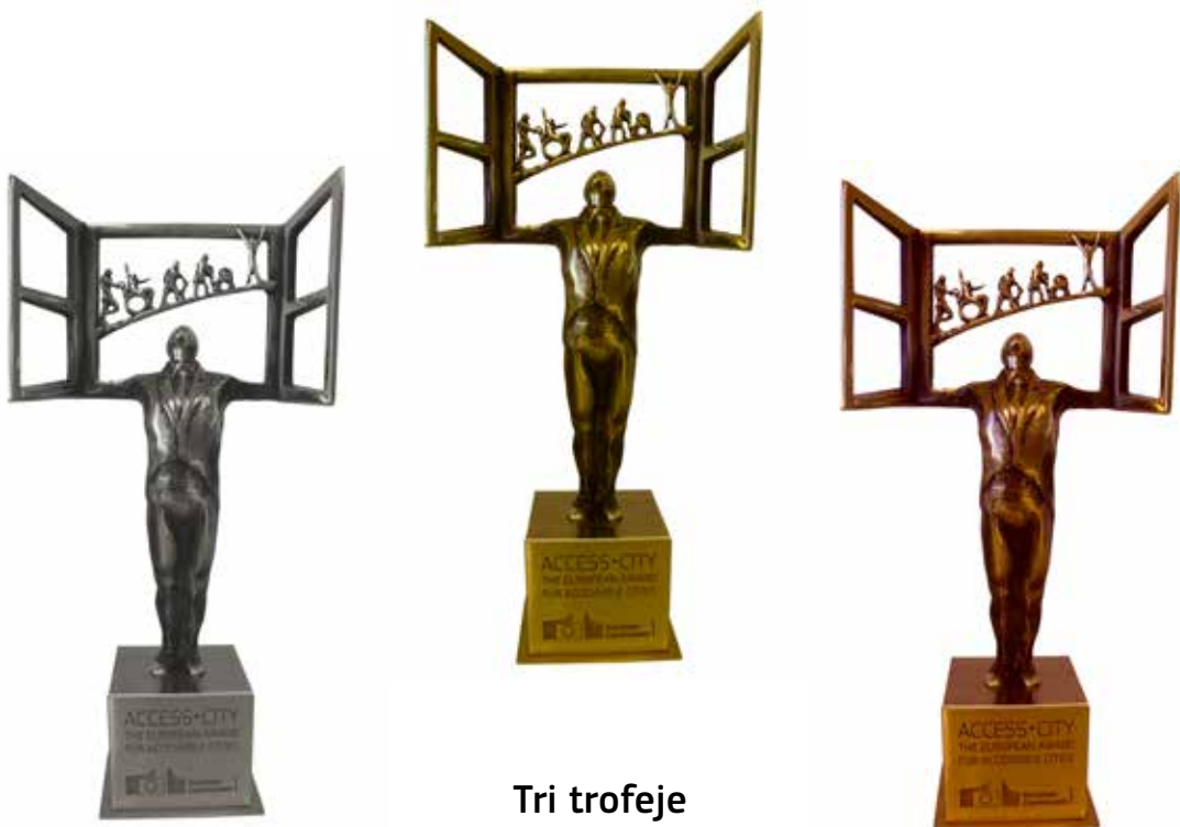
Tri trofeje Access•City Award 2015