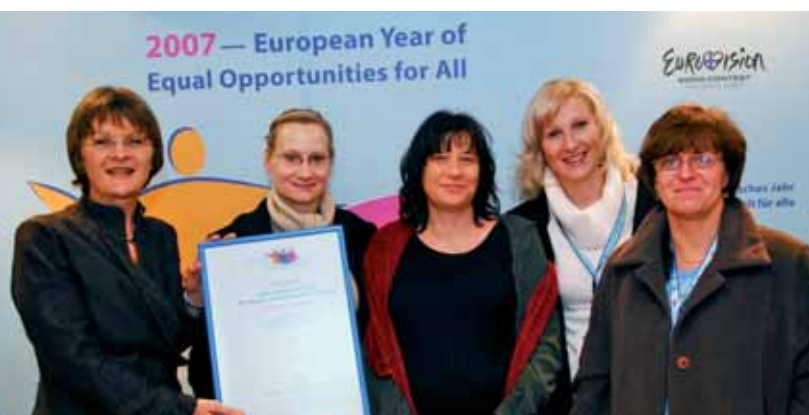
Lenkija gavo garbingą apdovanojimą už geriausią garso ir vaizdo darbą.

Apimant platų temų ir teritorijų diapazoną, šiais metais norėta pasiekti visas lygiomis galimybėmis suinteresuotas grupes. Manoma, kad būtina stiprinti ryšius tarp veikėjų, kurie jau dirba kartu, ir pasiekti naujas organizacijas, įmones ir asmenis.