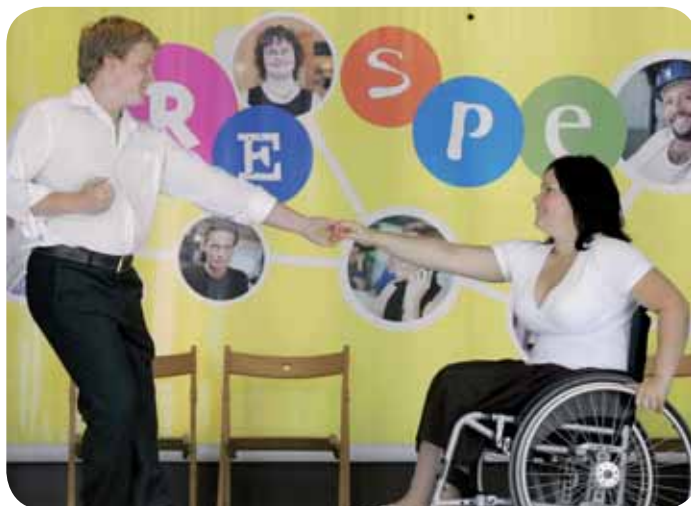
2008 m. Turas vilkiku, sustojimas Jūrmaloje (Latvija).

Sąmoningumo ugdymo svarbą sunku pervertinti. Tyrimai rodo, kad europiečiai supranta, jog diskriminacija yra problema, bet gana nedaug jų žino savo įstatymines teises. Be to, sąmoningumo ugdymas skatina veikti. Kampanijos gali suteikti valdžios įstaigoms, organizacijoms ir asmenims priemonių ir žinių, padėsiančių apginti diskriminuojamus žmones.