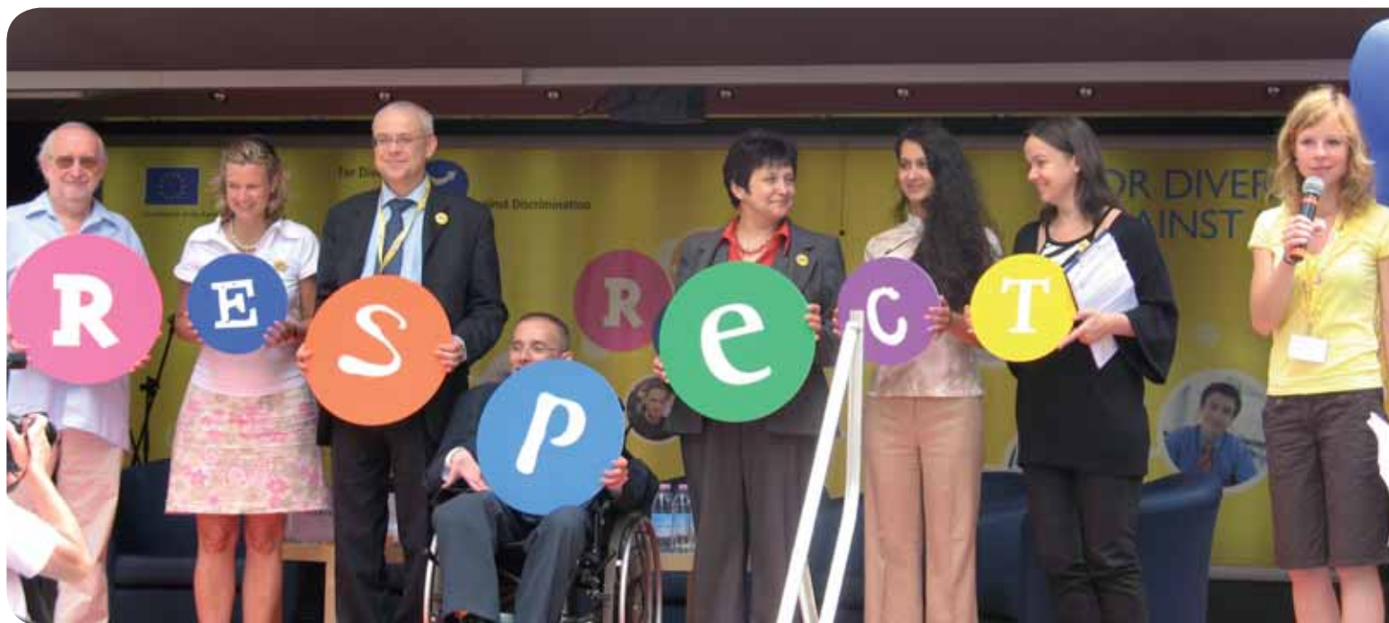
ES Turo vilkiku pradžia Prahoje 2008 m. birželio 20 d.

2007-ieji – Europos lygių galimybių visiems metai buvo ambicingas projektas, paskatinęs šimtus nacionalinių veiksmų ir siekęs informuoti žmones apie jų teises į vienodą požiūrį. Apibūdinami pagrindiniai įvykiai ir nurodomas būsimas potencialas. Kampanija „Už įvairovę. Prieš diskriminaciją“ ir toliau naudojo vizualines ir novatoriškas priemones skatindama įvairovę, o iš pagrindinių renginių galima paminėti Sunkvežimio turą ir žurnalistų apdovanojimus. Skleisti žinią, kad įvairovė naudinga verslui, yra būtina, ypač ekonominių sunkumų metu, nes atkreipiamas dėmesys į pagrindinius įvairovės politikos pokyčius.