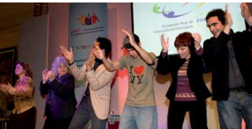
ELGM renginio uždarymas. Lisabona, 2007 m. lapkričio mėn.

2007-ieji – Europos lygių galimybių visiems metai (ELGM) buvo precedento neturinti ir ambicinga iniciatyva, skirta bendravimui ir bendradarbiavimui lygių galimybių klausimais. 1997-ieji – Kovos su rasizmu metai ir 2003-ieji – Neįgalųjų metai jau buvo pademonstravę Europos pasiryžimą iškelti lygybę į darbotvarkės viršų. 2007-ieji savo ambicingumu žengė dar toliau, apimdami visas Europos teisės aktuose numatytas diskriminacijos priežastis visoje geografinėje Europos teritorijoje: dalyvavo visos 27 ES valstybės narės ir trys Europos ekonominės erdvės šalys – Islandija, Lichtenšteinas ir Norvegija.