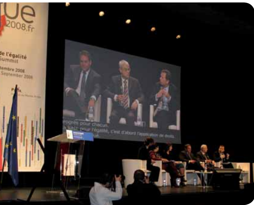
Komisaras Vladimir Špidla ir Prancūzijos ministras Xavier Bertrand viršūnių susitikime lygių galimybių klausimais Paryžiuje.

2008 m. rugsėjo 29–30 d. vykęs Paryžiaus viršūnių susitikimas dar kartą subūrė aukšto lygio kovos su diskriminacija politikos kūrėjus ir suinteresuotus asmenis. Per šį susitikimą buvo aptariama nauja direktyva (21 puslapis), pasiūlyta siekiant išplėsti teisinę apsaugą už darbo rinkos ribų ir įtraukti diskriminaciją dėl amžiaus, negalios, religijos ar įsitikinimų ir seksualinės orientacijos prekių ir paslaugų