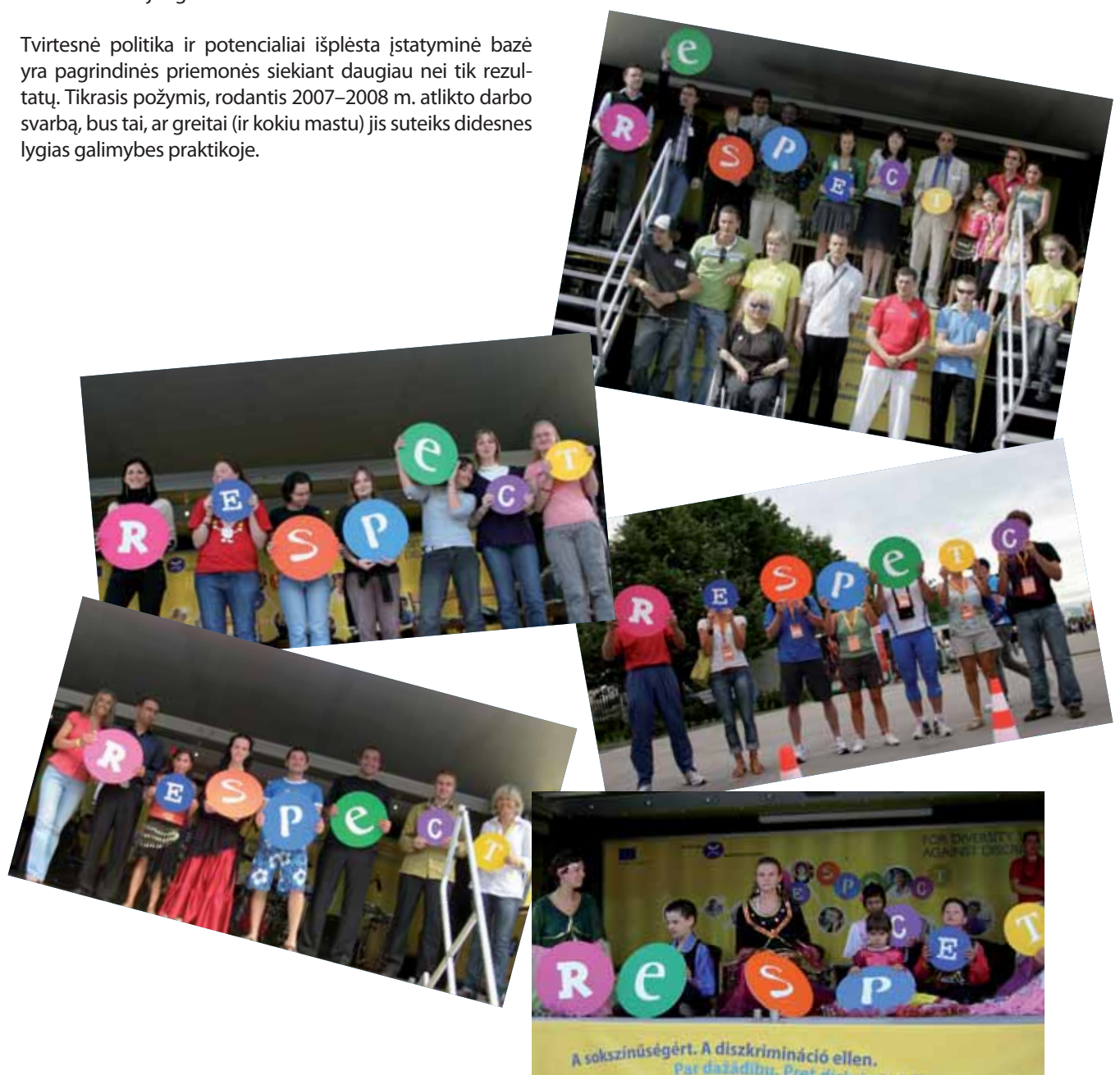
2008 m. Turas vilkiku.

Lygesnės visuomenės tenka siekti vis sudėtingesniame ekonominiame ir socialiniame kontekste. Finansų krizės padariniai bus jaučiami dar ilgą laiką. Atsižvelgiant į tai svarbu pripažinti, kad problemos, kartais identifikuojamos kaip gresiančios „mažumoms“, turi didžiulės svarbos kiekvienam ES gyventojui. Europa privalo panaudoti visų savo žmonių įgūdžius ir įvairovę, jei nori rasti geriausių išeičių iš dabartinių ekonominių ir socialinių sunkumų.