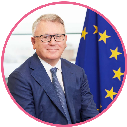
Nicolas Schmit, a foglalkoztatásért és a szociális jogokért felelős uniós biztos

Európában jelenleg átmeneti időszakban vagyunk. A zöld átállás és a digitális transzformáció a fenntartható jövő kulcsai, amelyek egyszerre tartogatnak magukban lehetőségeket és kihívásokat. Ugyanakkor a célunk az, hogy megerősödve kerüljünk ki a Covid19-világjárványból, és az átalakulások ezen időszakát felhasználva új lehetőségeket és munkahelyeket teremtsünk Európa helyreállítására érdekében.