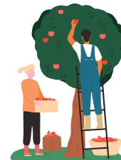
Delavci v kmetijstvu

Delavci z minimalno plačo se težko preživljajo (%)