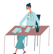
Lucrătorii din domeniul sănătății