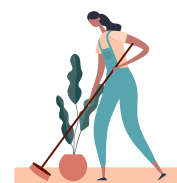
Personalul de curățenie