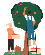
Werknemers in de landbouw