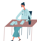
Veselības aprūpes darbinieki

Minimālās algas saņēmējiem ir grūti savilkt kopā galus (%)