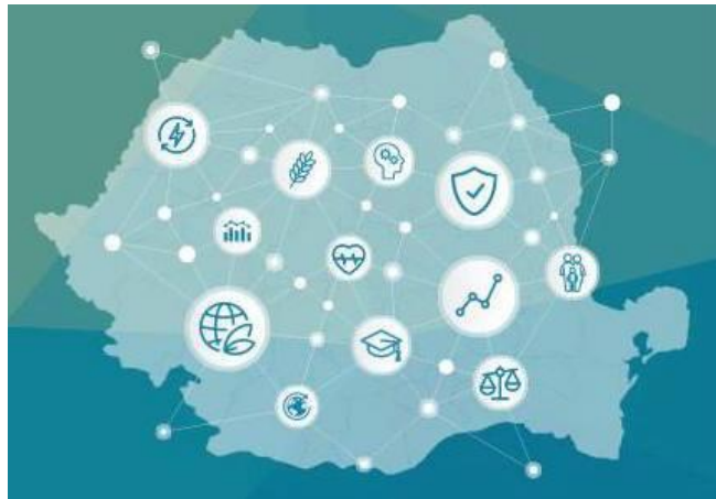
Figura 1. Vizualizarea folosită în proiect pentru a desemna conceptul de dezvoltare durabilă