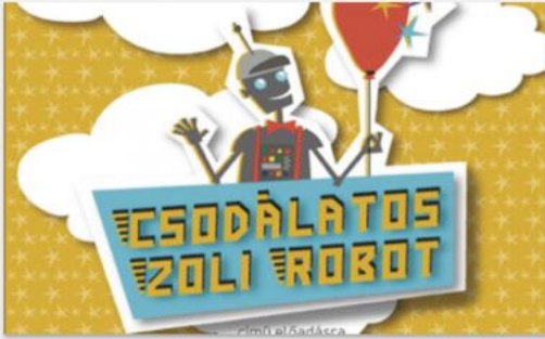
Csodálatos Zoli robot

Zoli egy robot, de nem a tőkésletes fajtából. Nem működik rendszeren a beszédchipje, ezért furcsa és kinos helyzetekbe kerül, például madárhangon szólal meg egy felvételi interjúján.