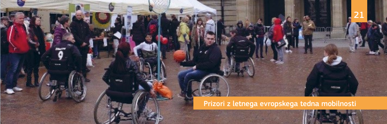
Prizori z letnega evropskega tedna mobilnosti