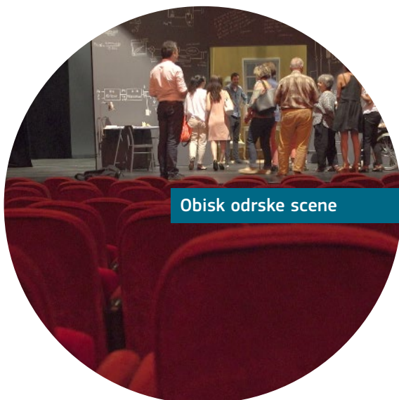
Obisk odrske scene