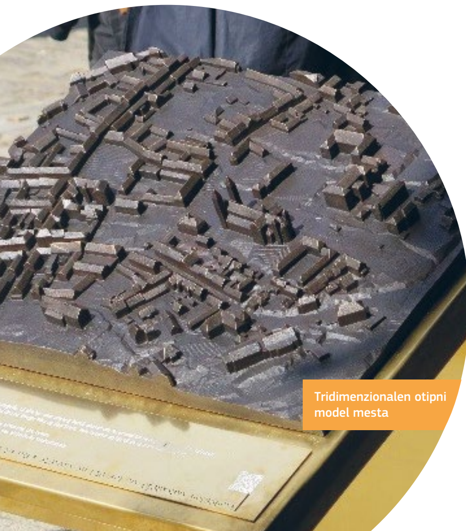
Tridimenzionalen otipni model mesta

Vizija občine Viborga je, da bi morali vsi imeti priložnost živeti zdravo in dejavno življenje z dostopom do široke palete kulturnih, rekreacijskih in drugih doživetij. Leta 2009 je mesto sprejelo invalidsko politiko. Utemeljena je bila na povratnih informacijah z delavnic in s srečanj z lokalnimi meščani, invalidskimi organizacijami in starejšimi ter glavnimi zainteresiranimi stranmi mestnega jedra. Politika vključuje kontrolni seznam za dostopnost, ki zajema javne kraje in stavbe s priporočenimi ukrepi.