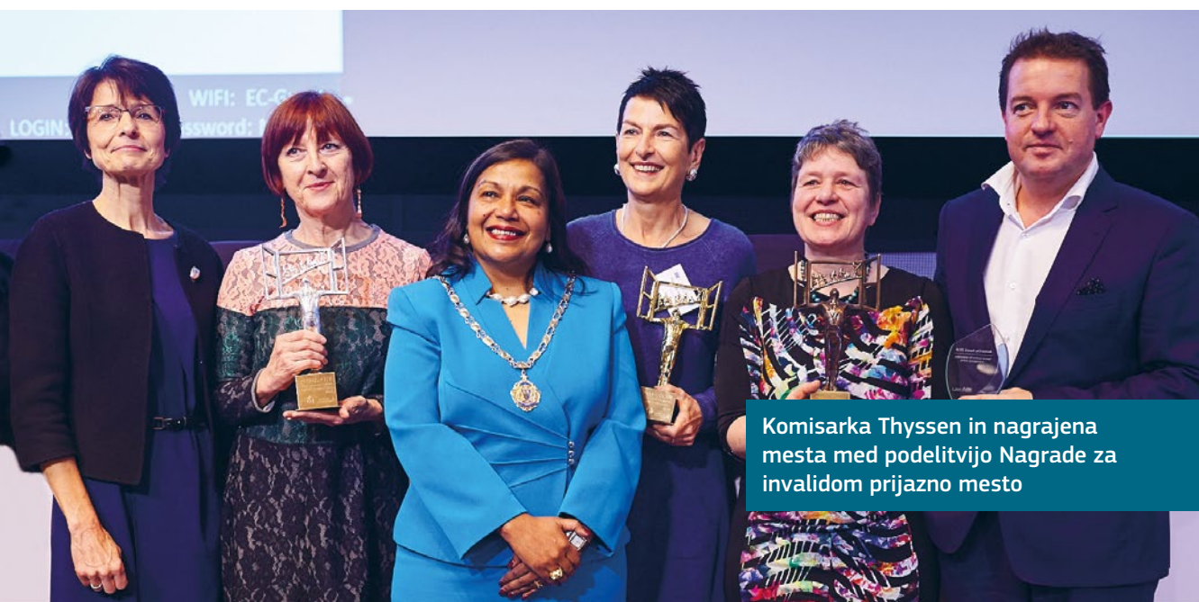
Komisarka Thyssen in nagrajena mesta med podelitvijo Nagrade za invalidom prijazno mesto

Te nagrade poudarjajo, da izboljšanje dostopnosti ne pomeni vselej obsežnih naložb ali velikih projektov. Lahko gre tudi za razumevanje potreb in čim učinkovitejšo uporabo omejenih sredstev. Celotne spremembe lahko znatno prispevajo k zagotavljanju, da so lahko ljudje udeležijo v mestnem življenju.