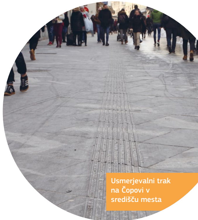
Usmerjevalni trak na Čopovi v središču mesta

Na voljo je zemljevid mesta dostopnih lokacij.