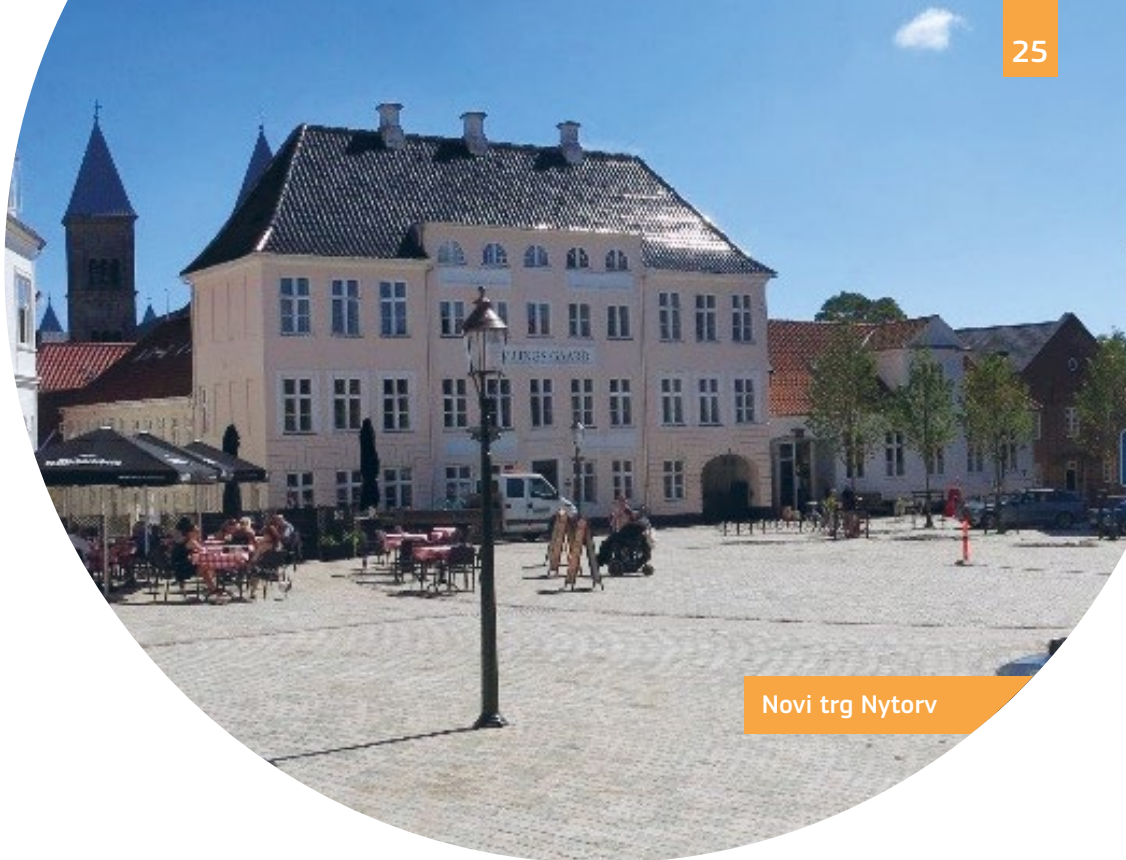
Novi trg Nytorv

V zgodovinskem mestu so številni javni trgi, vrtovi in ulice dostopni z novimi, nižjimi pločniki, klančinami za dostop z invalidskim vozičkom in usmerjevalnimi trakovi. Trg Nytorv je nova, popolnoma dostopna javna površina, ki je bila ustvarjena iz starega parkirišča.