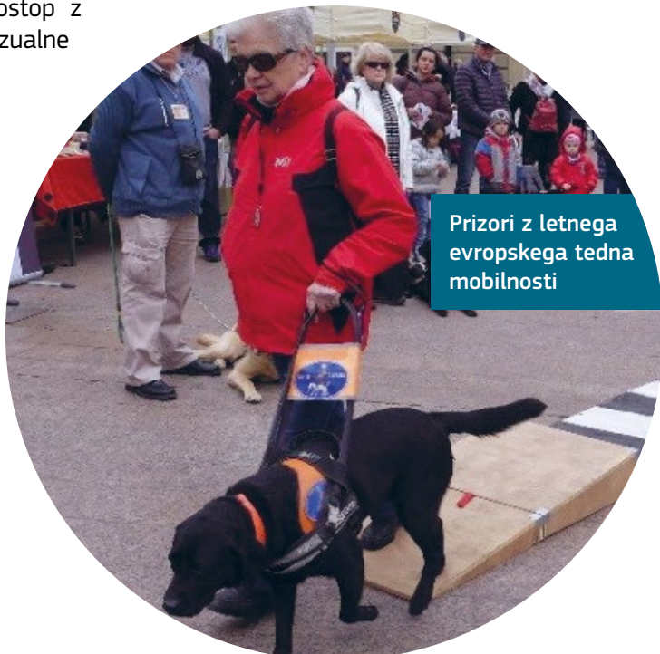
Prizori z letnega evropskega tedna mobilnosti

Program vključuje letni teden mobilnosti in glasbeni festival, svečanost o vključenosti, kjer nastopajo invalidi, in dostopne vodene ogledje mesta in muzejev.