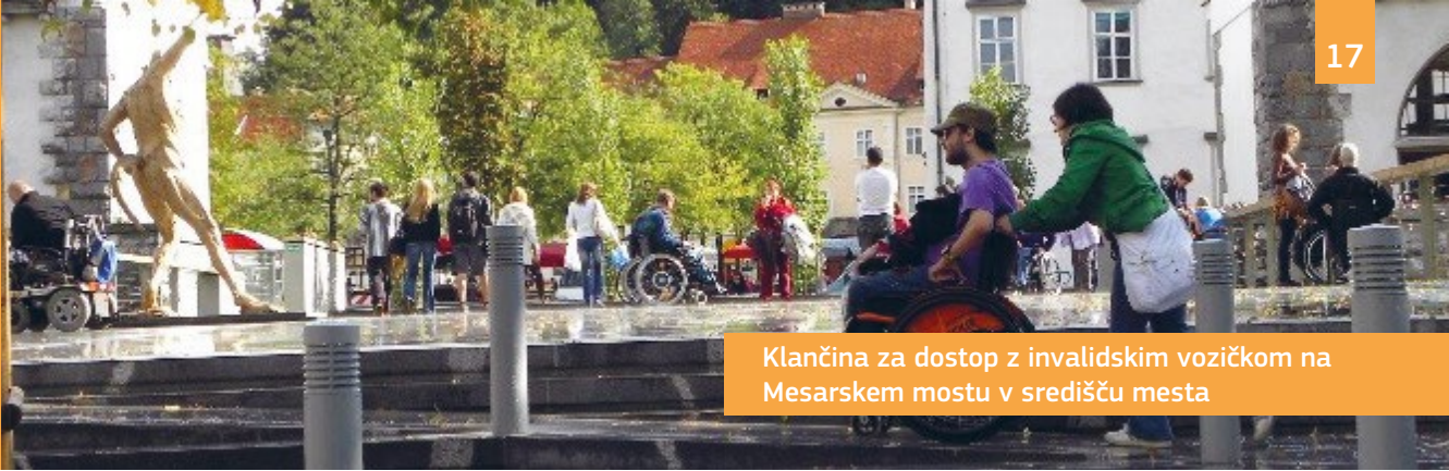
Klančina za dostop z invalidskim vozičkom na Mesarskem mostu v središču mesta