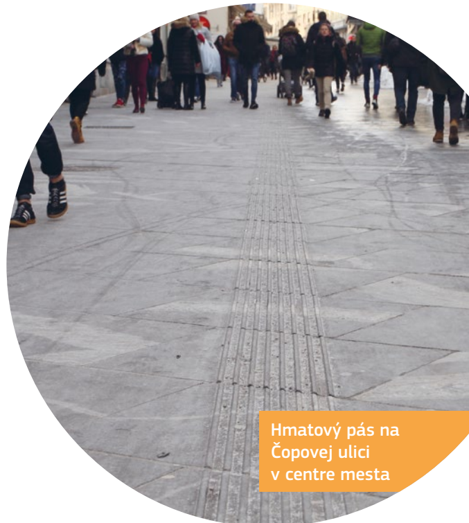
Hmatový pás na Čopovej ulici v centre mesta

K dispozícii mapa mesta s vyznačením bezbariérových lokalít.