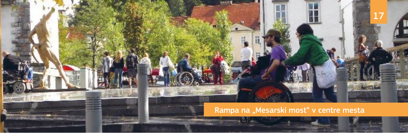
Rampa na „Mesarski most“ v centre mesta