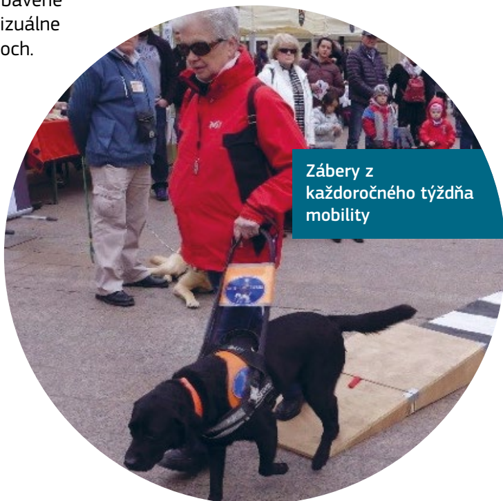
Zábery z každoročného týždňa mobility

Súčasťou programu je každoročný týždeň mobility a hudobný festival, inkluzívny gala večer, na ktorom vystupujú umelci so zdravotným postihnutím, a bezbariérové prehliadky mesta a múzea so sprievodcom.