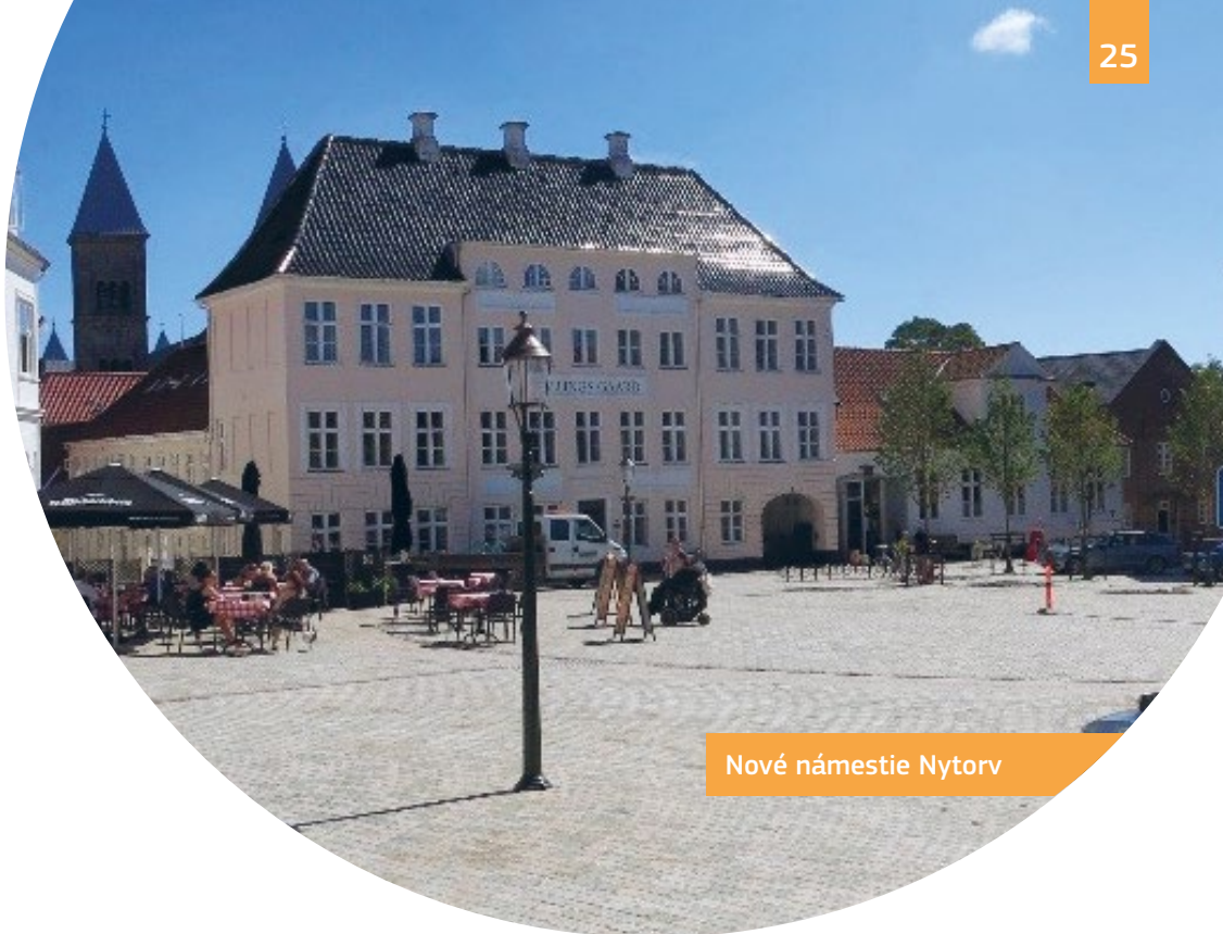
Nové námestie Nytorv

V historickom meste bolo prostredníctvom nových jednoúrovňových chodníkov, rámp a vodiacich pásov bezbariérovo upravených niekoľko verejných námestí, záhrad a ulíc. Námestie Nytorv je nový, úplne bezbariérový verejný priestor, ktorý bol vytvorený zo starého parkoviska.