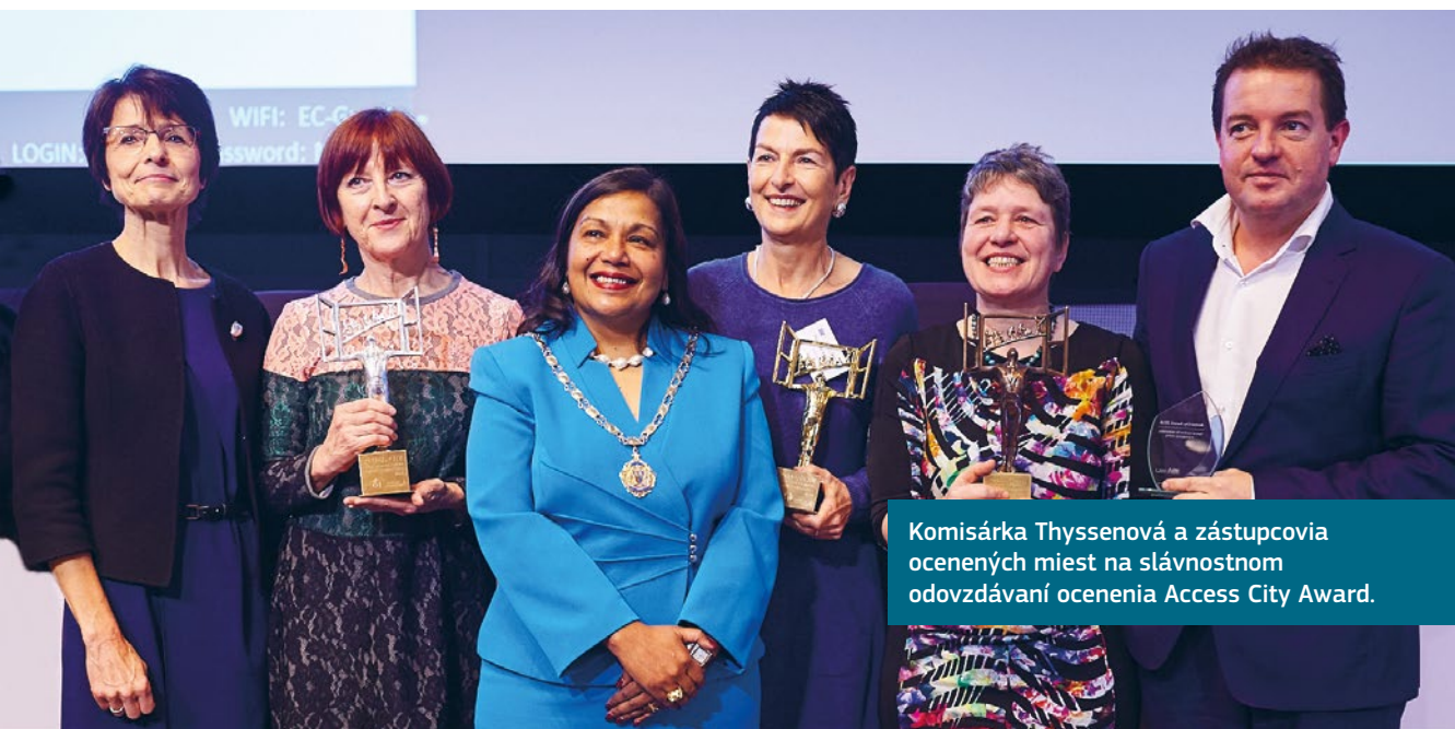
Komisárka Thyssenová a zástupcovia ocenených miest na slávnostnom odovzdávaní ocenenia Access City Award.

Ocenenia poukazujú na to, že zlepšenie prístupnosti nie je vždy o rozsiahlych investíciách alebo veľkých úpravách. Môže byť založené na pochopení potrieb a využití obmedzených zdrojov na dosiahnutie čo najlepšieho účinku. Dokonca aj malé zmeny môžu mať veľký dosah a zabezpečiť, že sa ľudia budú môcť podieľať na živote mesta.