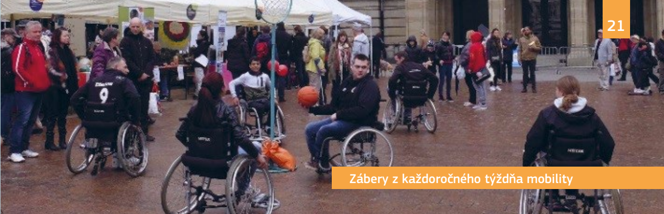
Zábery z každoročného týždňa mobility