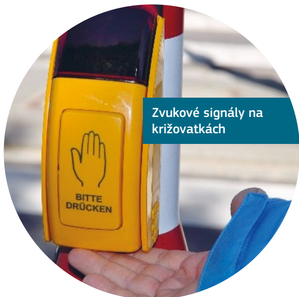
Zvukové signály na križovatkách