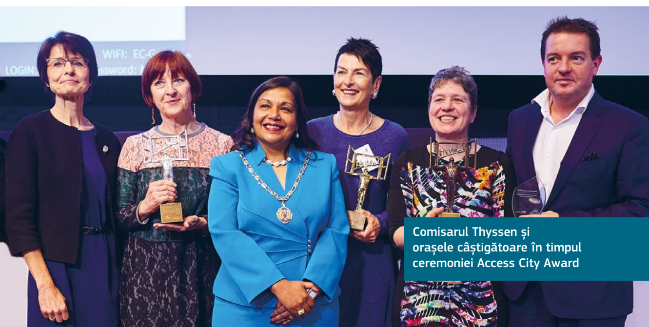
Comisarul Thyssen și orașele câștigătoare în timpul ceremoniei Access City Award

Aceste premii evidențiază faptul că îmbunătățirea accesibilității nu înseamnă întotdeauna investiții la scară largă sau lucrări importante. Poate însemna și înțelegerea nevoilor și utilizarea resurselor limitate pentru cele mai bune rezultate. Chiar și modificările minore pot avea un impact major în asigurarea participării oamenilor la viața urbană.