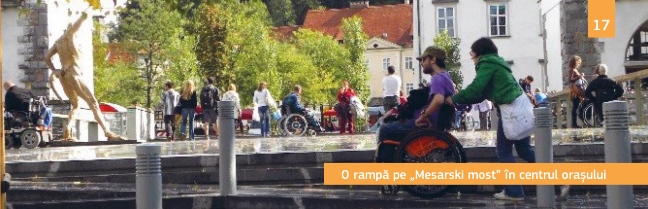
O rampă pe „Mesarski most” în centrul orașului