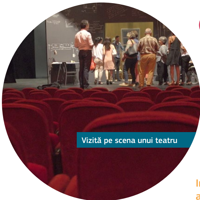
Vizită pe scena unui teatru