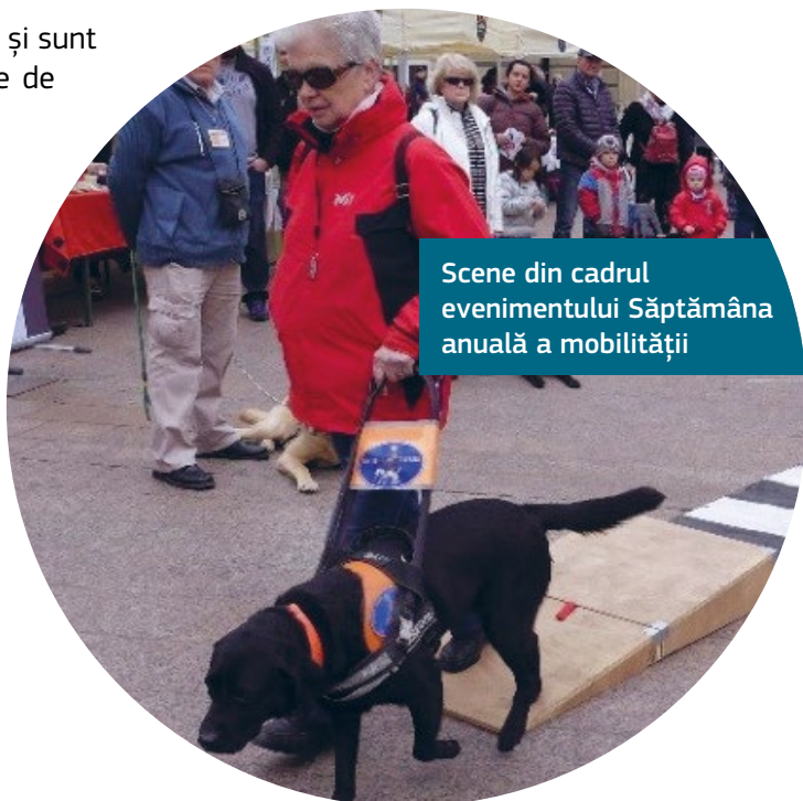
Scene din cadrul evenimentului Săptămâna anuală a mobilității

Programul include o Săptămână anuală a mobilității și un Festival de muzică, o Gală a incluziunii la care au participat interpreți cu dizabilități și tururi ale orașului și muzeelor, cu ghid.