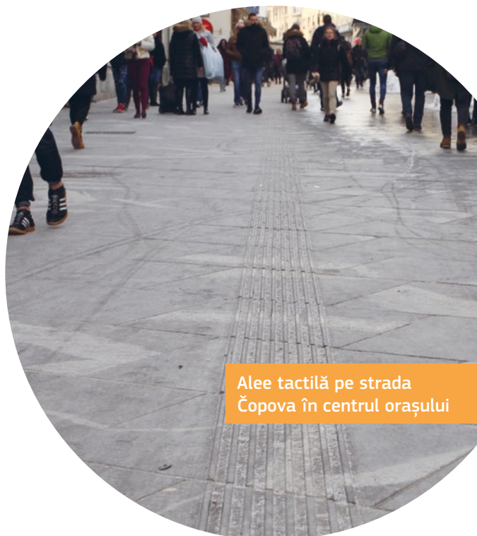
Alee tactilă pe strada Čopova în centrul orașului

Este disponibilă și o hartă a locurilor accesibile din oraș.