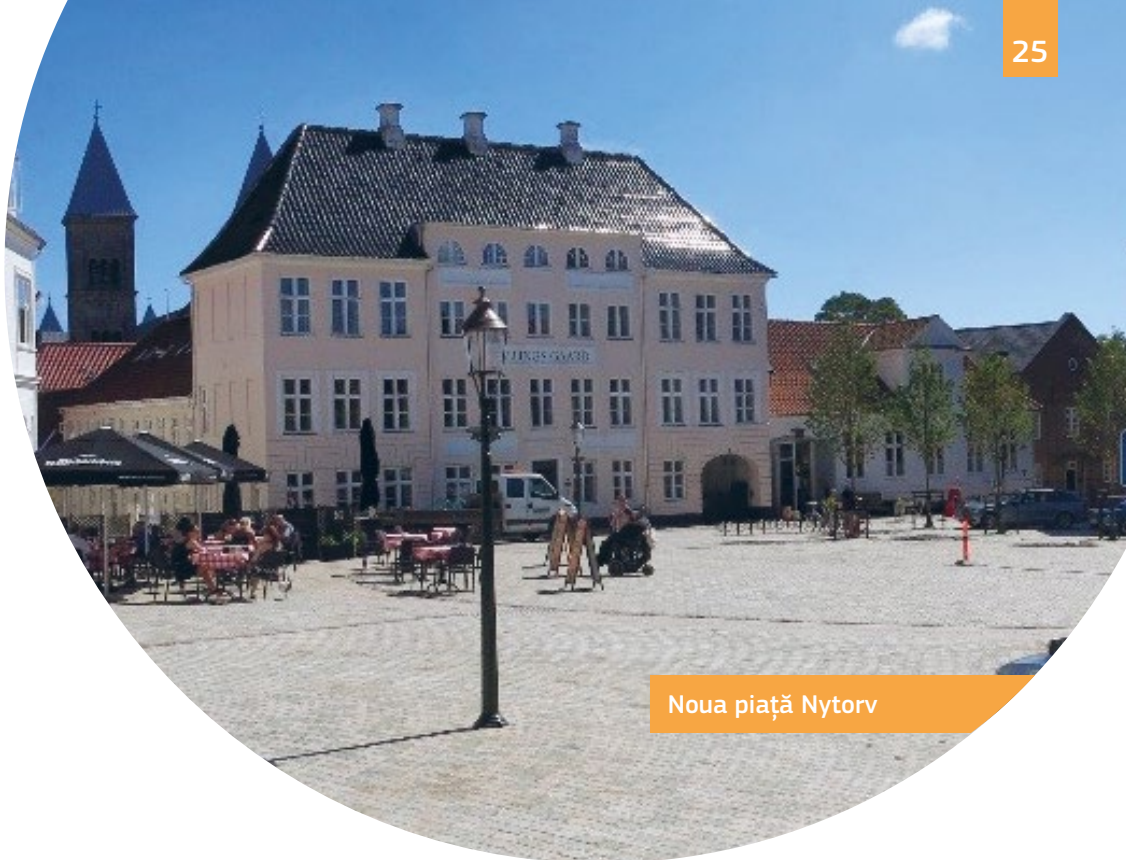
Noua piață Nytorv

mai degrabă decât facilități „speciale” care atrag atenția asupra persoanelor cu handicap. În orașul istoric, mai multe piețe publice, grădini și străzi au fost făcute accesibile prin noi pavaje la nivel, rampe și benzi tactile de ghidare. Piața Nytorv este un nou spațiu accesibil care a fost creat dintr-o fostă parcare.