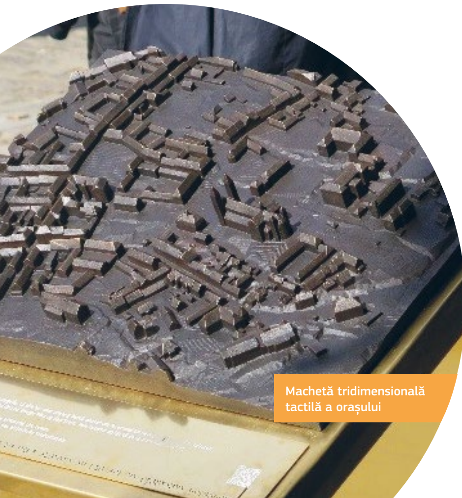
Machetă tridimensională tactilă a orașului

Viziunea municipalității din Viborg este că fiecare trebuie să aibă posibilitatea de a trăi o viață sănătoasă și activă, cu acces la o gamă largă de experiențe culturale, de agrement și altele. O Politică privind persoanele cu handicap a fost adoptată de administrația locală în 2009. Aceasta s-a bazat pe feedbackul obținut în urma atelierelor și întâlnirilor cu cetățenii locali, organizațiile persoanelor cu handicap și în vârstă și mediul de afaceri din centrul orașului. Politica include o listă de verificare în ceea ce privește accesibilitatea care include spațiile și clădirile publice, împreună cu recomandări de măsuri.