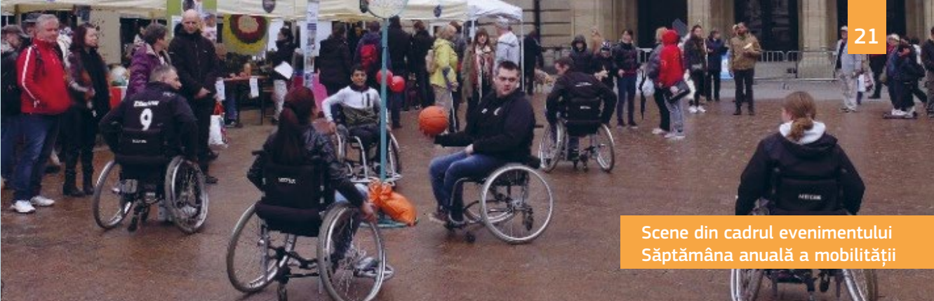
Scene din cadrul evenimentului Săptămâna anuală a mobilității