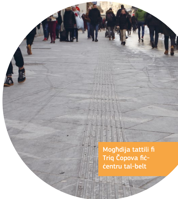
Mogħdija tattili fi Triq Čopova fiċ-ċentru tal-belt

Mappa tal-belt tal-lokazzjonijiet aċċessibbli hija disponibbli.