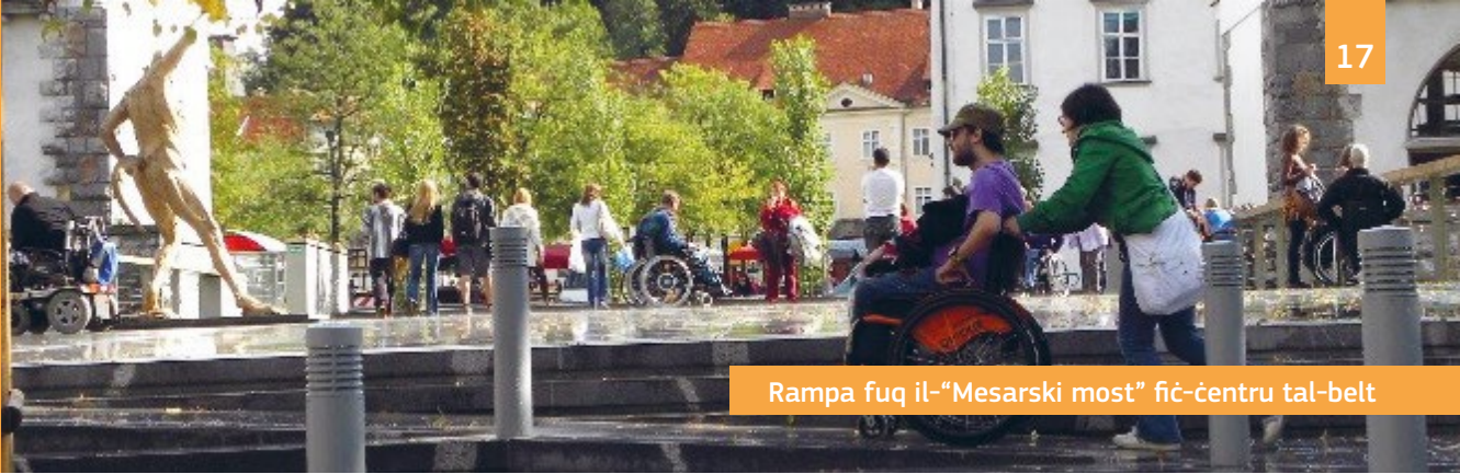
Rampa fuq il-“Mesarski most” fiċ-ċentru tal-belt