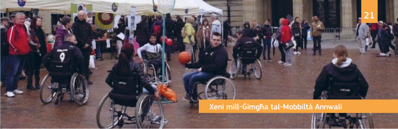
Xeni mill-Ġimgħa tal-Mobbiltà Annwali