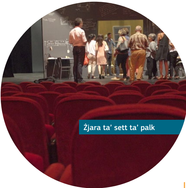
Żjara ta' sett ta' palk