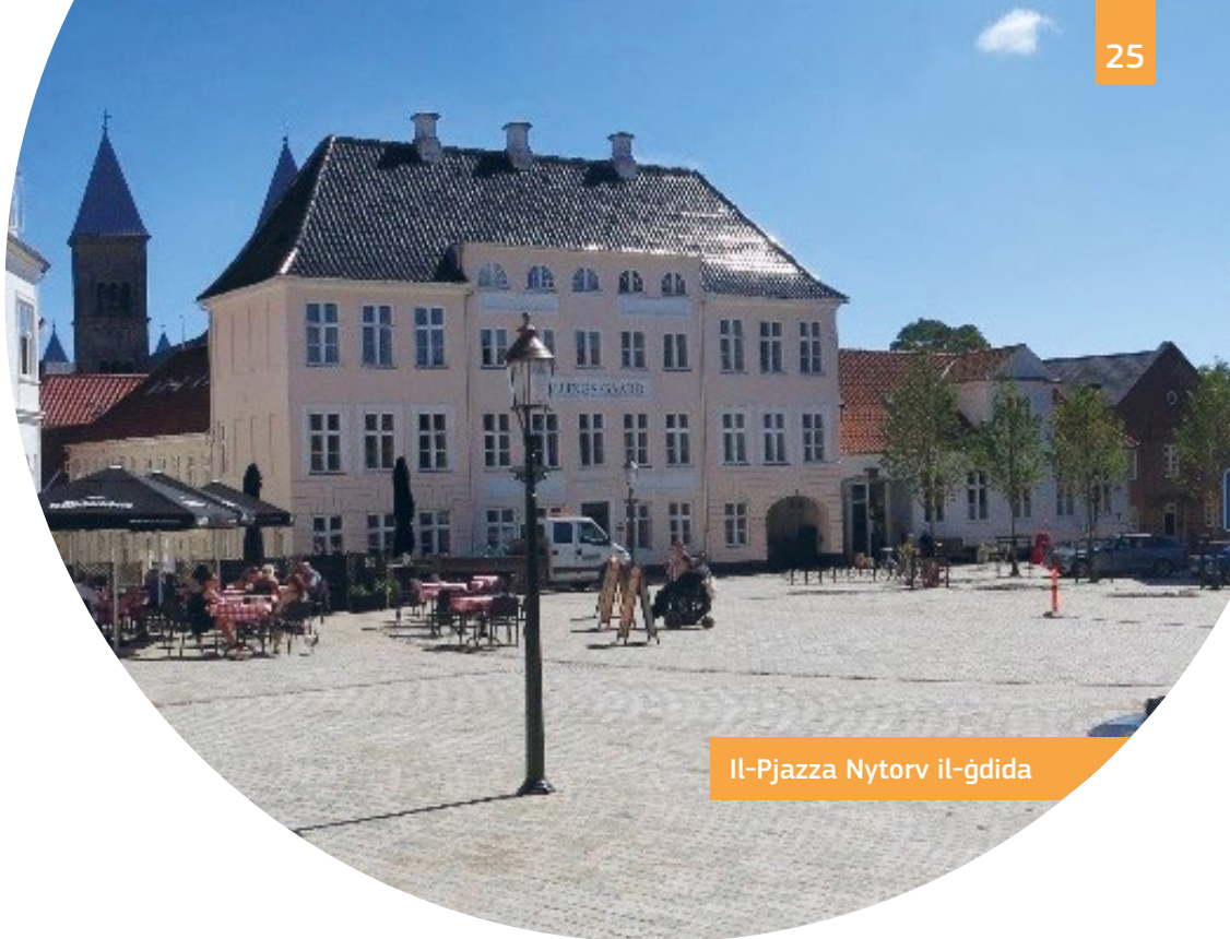
Il-Pjazza Nytorv il-ġdida

Fil-belt storika, diversi pjazez pubbliċi, ġonna u toroq saru aċċessibbli b'bankini livellati, rampi u strixxi gwida tattili ġodda. Il-pjazza Nytorv hija żona pubblika kompletament aċċessibbli li nħolqot minn parking tal-karozzi antiki.