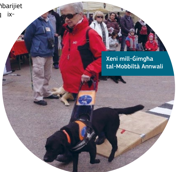
Xeni mill-Ġimgħa tal-Mobbiltà Annwali

Il-programm jinkludi Ġimgħa tal-Mobbiltà u Festival tal-Mużika, Gala tal-Inkluzjoni li tinkludi artisti tal-ispettaklu b'diżabbiltà u turs iggwidati aċċessibbli tal-belt u l-mużew.