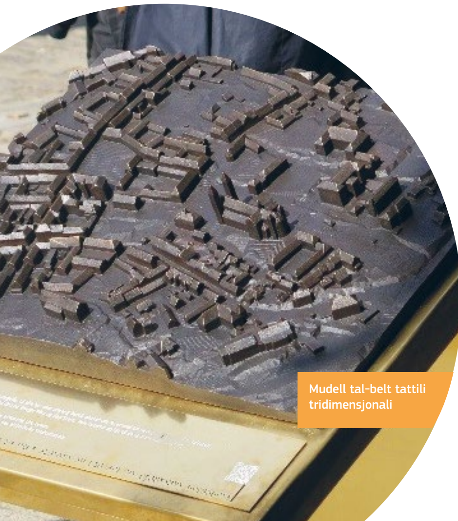
Mudell tal-belt tattili tridimensjonali

Il-viżjoni tal-municipalità ta' Viborg hi li jenħtieġ li kulhadd ikollu l-opportunità jgħix ħajja sana u attiva bl-aċċess għal firxa wiesgħa ta' esperjenzi kulturali, ta' żmien liberu u oħrajn. Fl-2009 il-Belt adottat Politika tad-Diżabbiltà. Din kienet ibbażata fuq il-feedback mis-sessjonijiet ta' ħidma u l-laqqgħat maċ-ċittadini lokali, l-organizzazzjonijiet tan-nies b'diżabbiltà u l-anzjani u partijiet ikkonċernati taċ-ċentru tal-belt ewlenin. Il-politika tinkludi lista ta' kontroll għall-aċċessibilità li tkopri l-postijiet pubbliċi u l-bini b'rakkomandazzjonijiet għall-azzjoni.