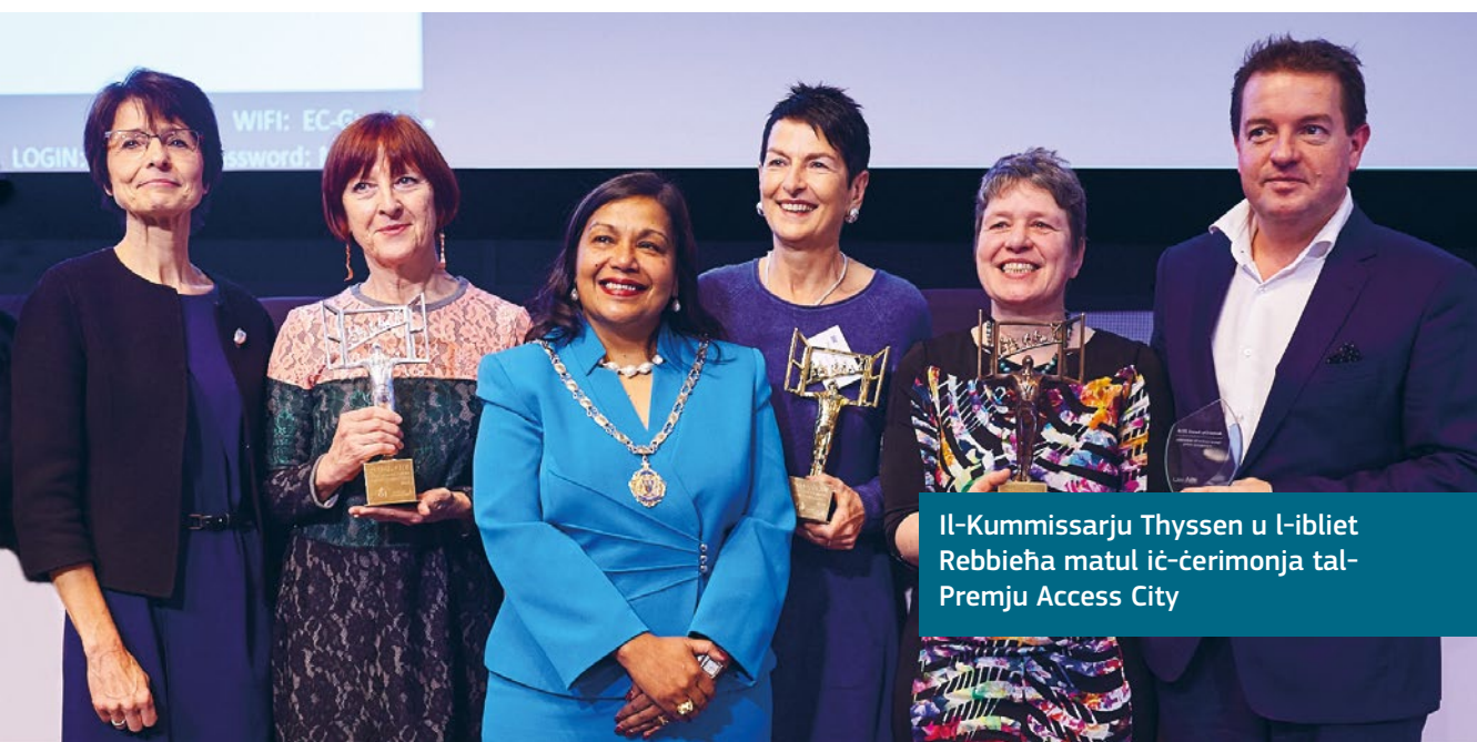
Il-Kummissarju Thyssen u l-ibliet Rebbieħa matul iċ-ċerimonja tal-Premju Access City

Dawn il-premjijiet jenfasizzaw li t-titjib tal-aċċessibbiltà mhux dejjem jittratta investment fuq skala kbir jew xogħlijiet ewlenin. Jista' jkun ukoll li jittratta l-fehim tal-ħtigijiet u l-użu ta' riżorsi limitati bl-aħjar mod. Anke bidliet żgħir jistgħu jkunu ta' suċċess sabiex jiġi żgurat li n-nies jistgħu jipparteċipaw fil-ħajja urbana.