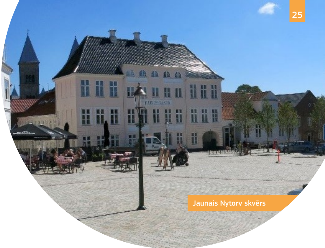
Jaunais Nytorv skvērs

Vēsturiskajā pilsētas daļā vairāki publiskie skvēri, dārzi un ielas ir padarītas pieejamas, izmantojot jauna līmeņa ielu segumus, uzbrauktuves un taktilās norāžu līnijas. Nytorv skvērs ir jauna, pilnībā pieejama publiska teritorija, kas izveidota vecas automašīnu stāvvietas vietā.