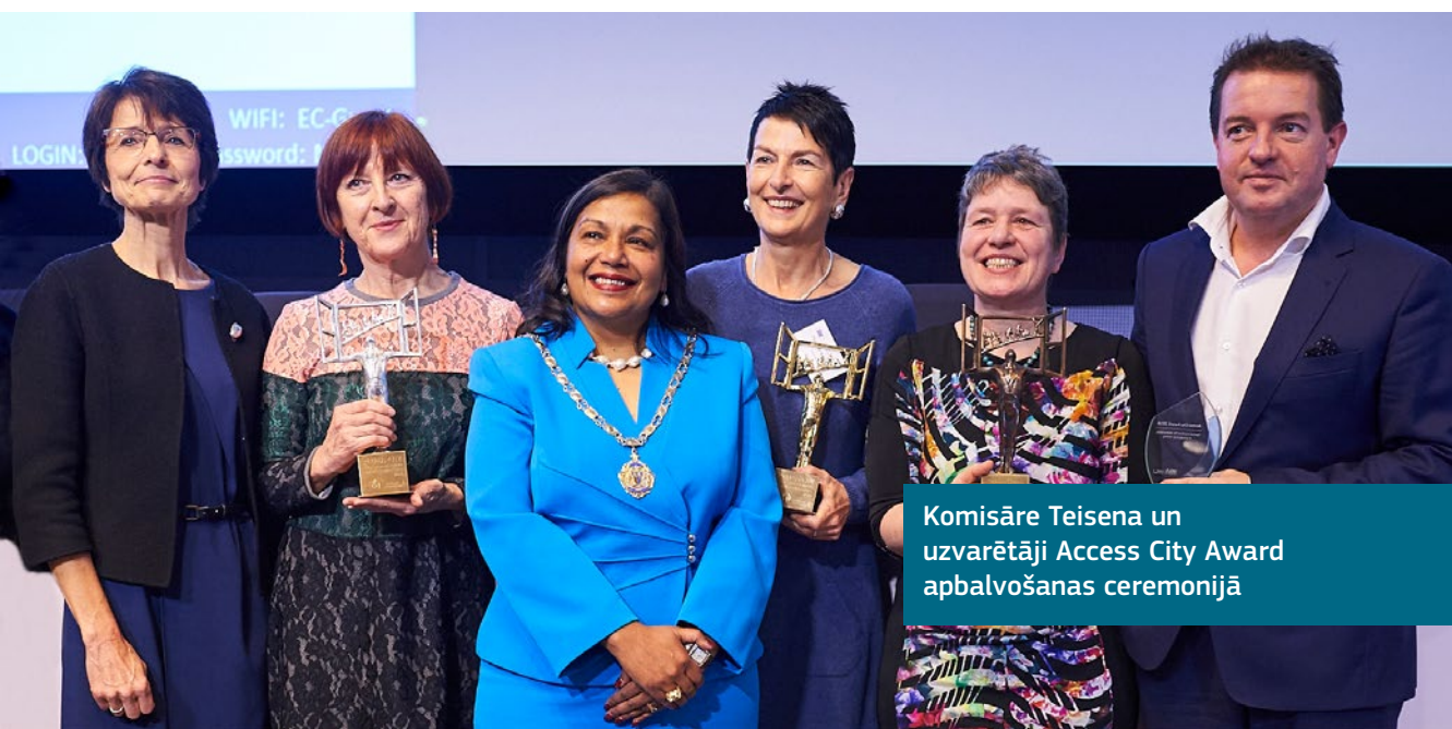
Komisāre Teisena un uzvarētāji Access City Award apbalvošanas ceremonijā

Šis konkurss atklāj, ka pieejamības uzlabošana ne vienmēr nozīmē lielus ieguldījumus vai plaša mēroga darbus. Tas var sekmēt arī izpratni par vajadzībām un to, kā ar ierobežotiem līdzekļiem panākt vislabāko efektu. Pat nelielas pārmaiņas var būt liels solis ceļā uz to, lai nodrošinātu cilvēku iespējas piedalīties pilsētas dzīvē.