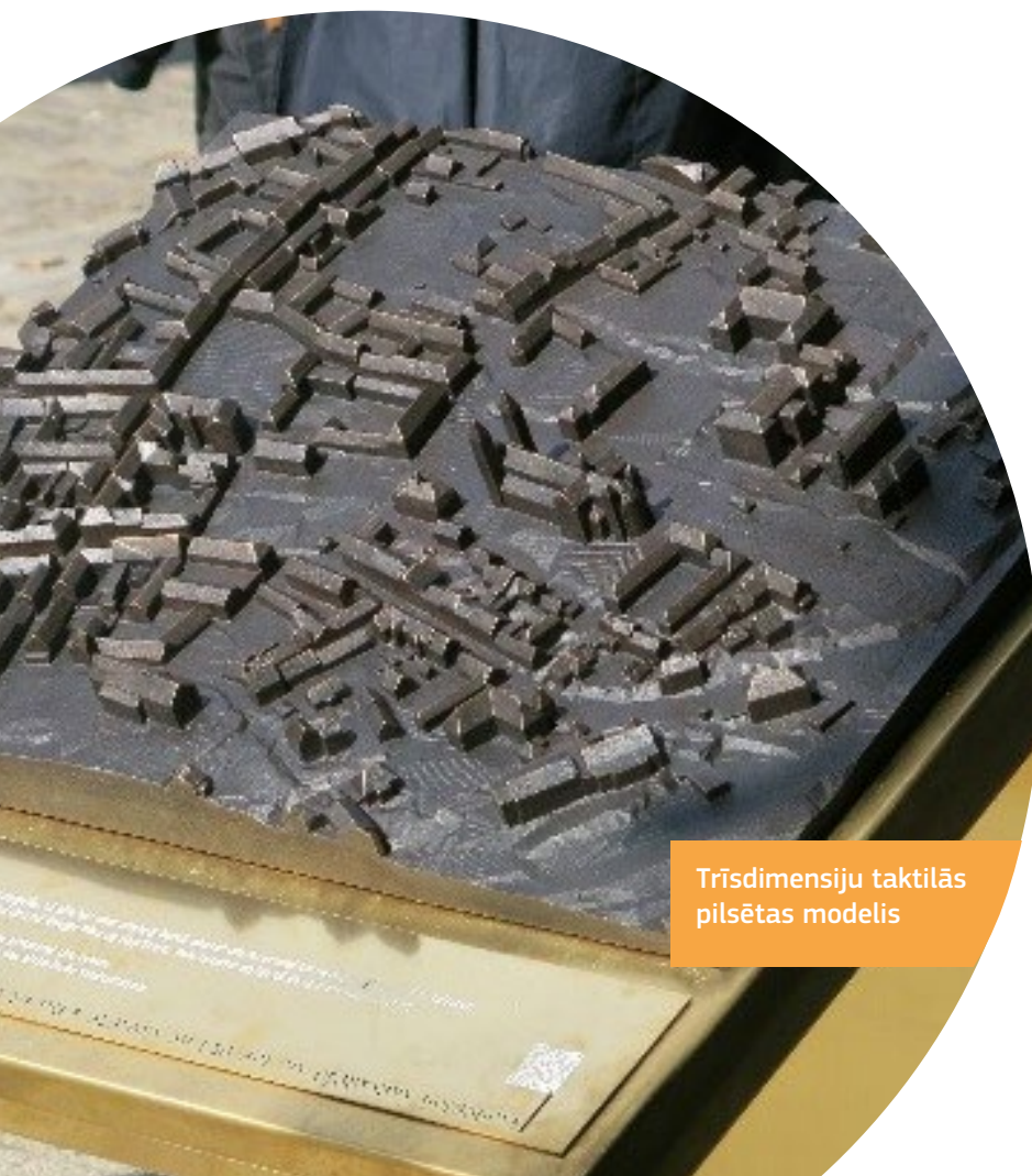
Trīsdimensiju taktīlās pilsētas modelis

Viborgas pašvaldības vīzija ir tāda, ka ikvienam būtu jābūt iespējai dzīvot veselīgu un aktīvu dzīvi un izbaudīt visplašākās kultūras, brīvā laika pavadīšanas un citas iespējas. 2009. gadā pilsēta apstiprināja politiku attiecībā uz cilvēkiem ar invaliditāti. Tā tika balstīta uz atsauksmēm no semināriem un apspriedēm ar vietējiem iedzīvotājiem, cilvēku ar invaliditāti organizācijām un gados vecākiem cilvēkiem, kā arī pilsētas centra galvenajām ieinteresētajām personām. Šīs politikas ietvaros izveidots kontrolsaraksts attiecībā uz pieejamību, kas aptver publiskas vietas un ēkas un kurā ir ieteikumi par iespējamo rīcību.