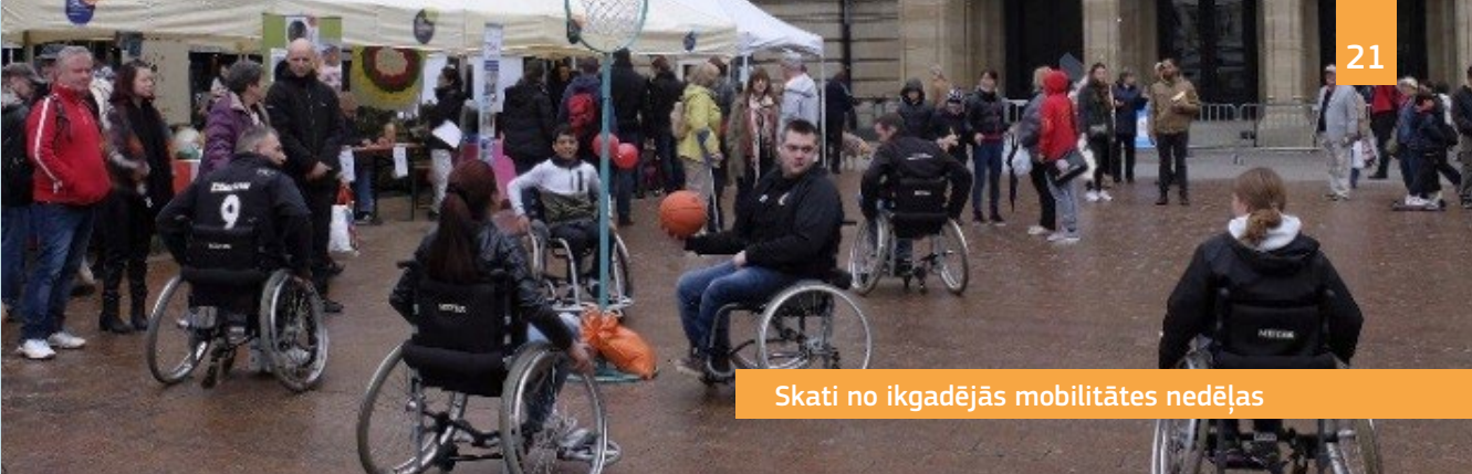
Skati no ikgadējās mobilitātes nedēļas