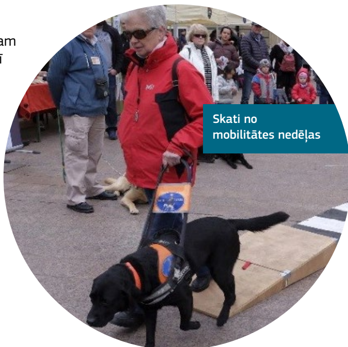
Skati no mobilitātes nedēļas

Programmā ietverta ikgadēja mobilitātes nedēļa un mūzikas festivāls, iekļautības galapasākums, kuram raksturīgs tas, ka piedalās cilvēki ar invaliditāti un ir pieejamas ekskursijas pa pilsētu un muzejā gida pavadībā.