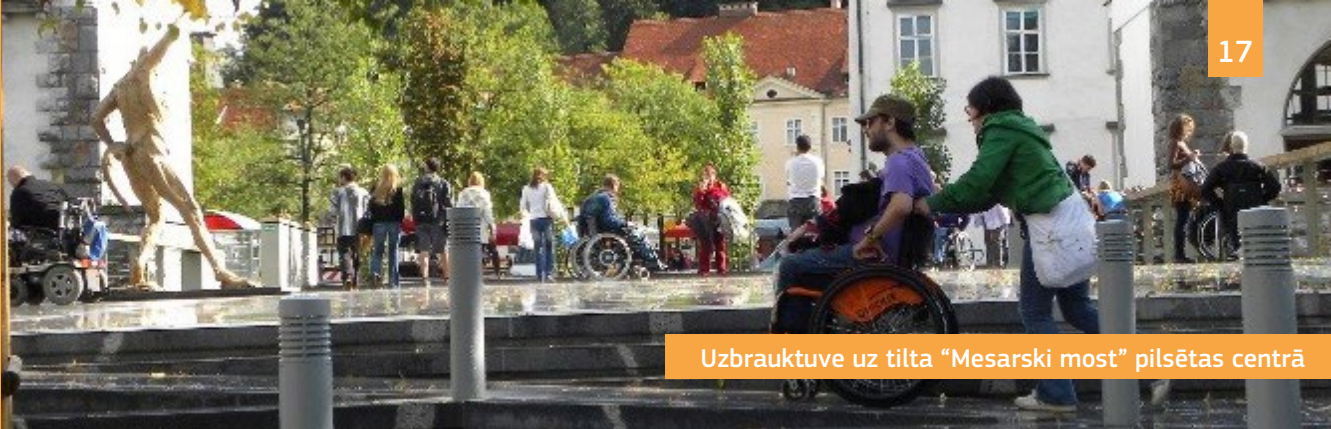
Uzbrauktuve uz tilta "Mesarski most" pilsētas centrā