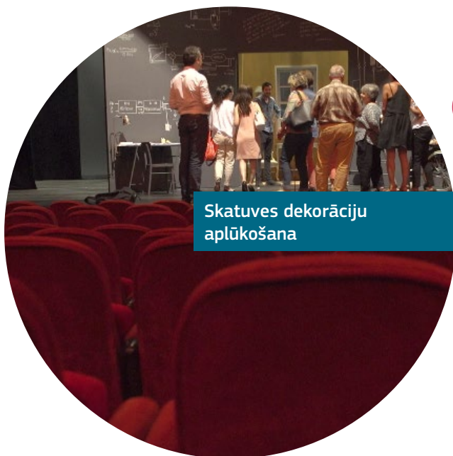
Skatuves dekorāciju aplūkošana