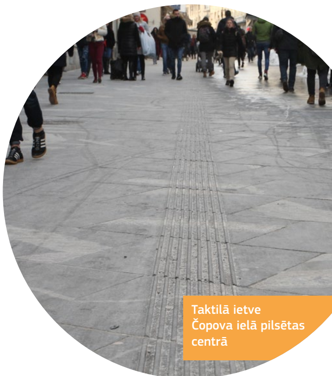
Taktilā ietve Čopova ielā pilsētas centrā

Ir izveidota pilsētas karte ar pieejamām vietām.