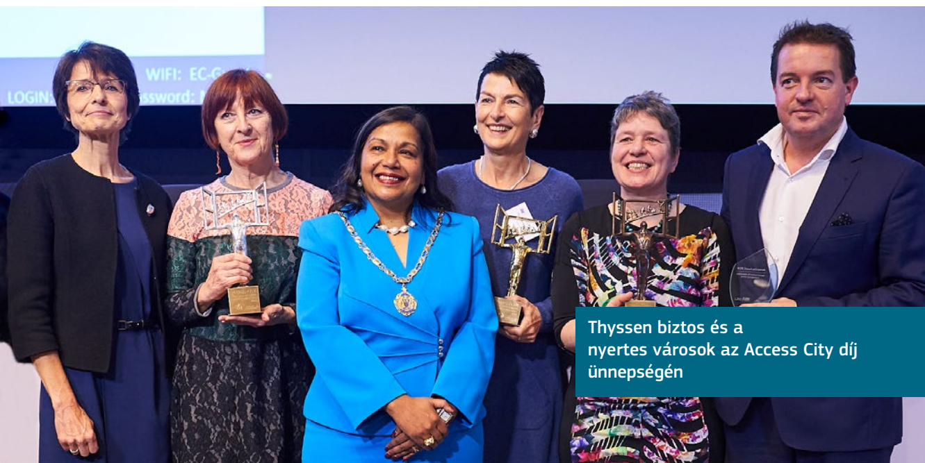
Thyssen biztos és a nyertes városok az Access City díj ünnepségén

E díjak rávilágítanak arra, hogy az akadálymentesítés javítása nem mindig jár nagyszabású beruházásokkal és nagy munkálatokkal. Az igények megértésével és korlátozott források lehető legjobb felhasználásával is jó eredményt lehet elérni. Kis változtatásokkal is nagyban hozzá lehet járulni ahhoz, hogy az emberek részt vehessenek a városi életben.