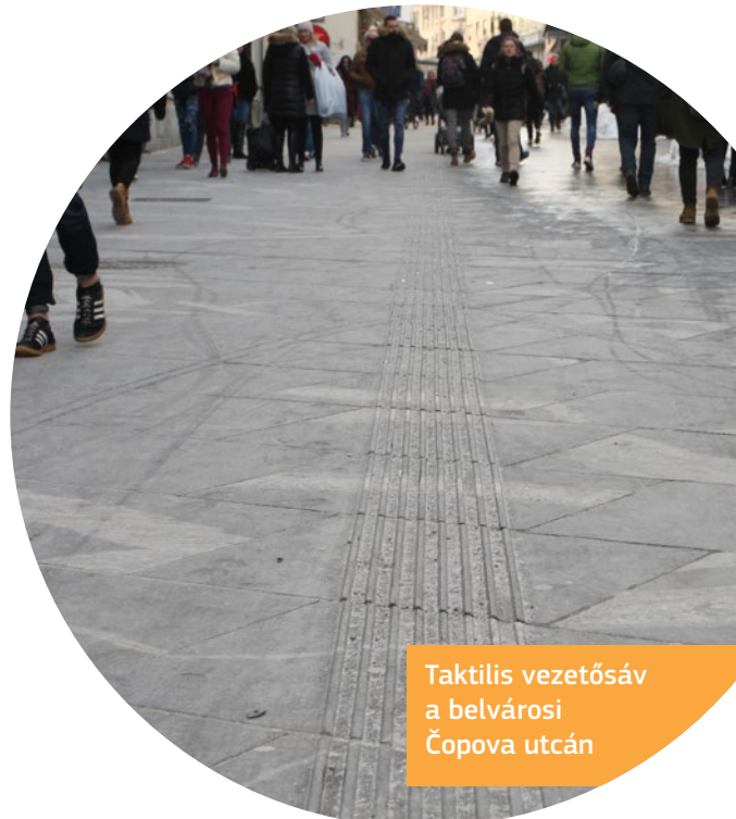
Taktilis vezetősáv a belvárosi Čopova utcán

Az akadálymentes helyszíneket jelölő várostérkép is kapható.