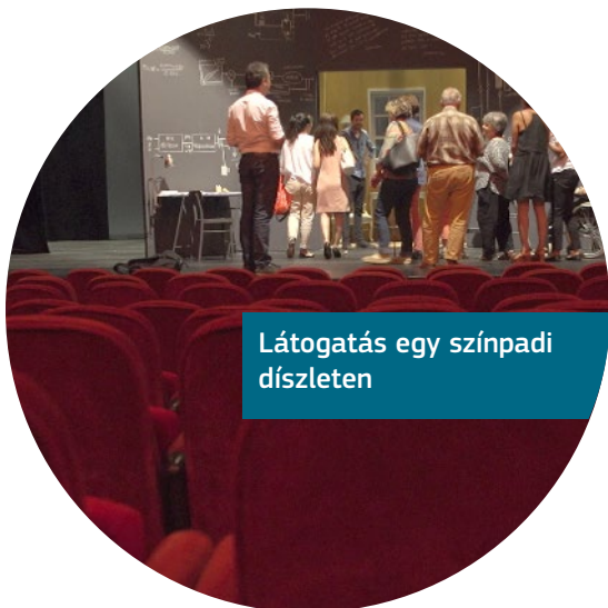
Látogatás egy színpadi díszleten