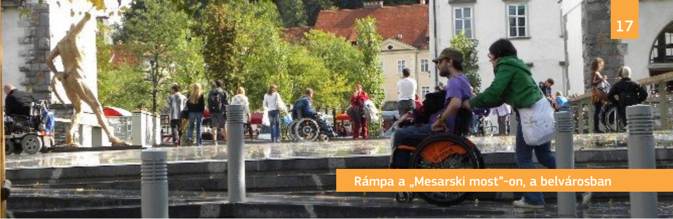
Rámpa a „Mesarski most”-on, a belvárosban