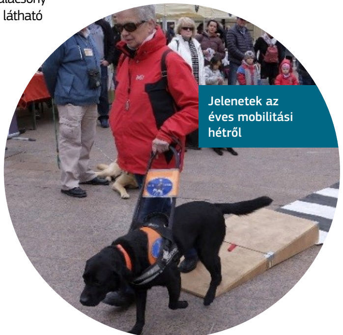
Jelenetek az éves mobilitási hétről

A program tartalmazza az évente megrendezésre kerülő mobilitási hetet és zenei fesztivált, egy fogyatékkal élő előadókat szerepeltető, befogadóközpontú gálát, valamint hozzáférhető vezetett túrákat a városban és a múzeumban.