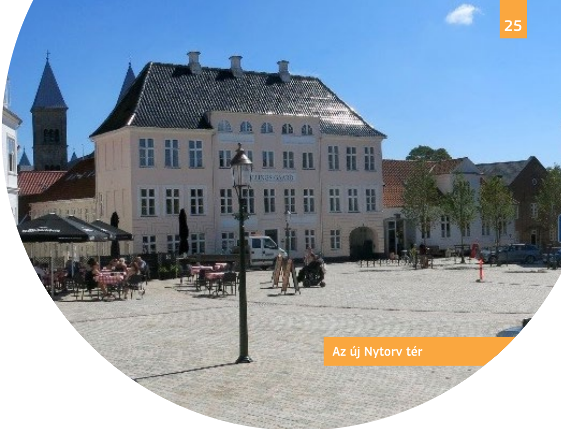
Az új Nytorv tér

A történelmi városrészben több nyilvános teret, kertet és utcát akadálymentesítettek új, szintezett padlózattal, rámpákkal és taktilis vezetősávokkal. A Nytorv tér egy új, teljesen hozzáférhető közterület, melyet egy korábbi parkolóból alakítottak ki.