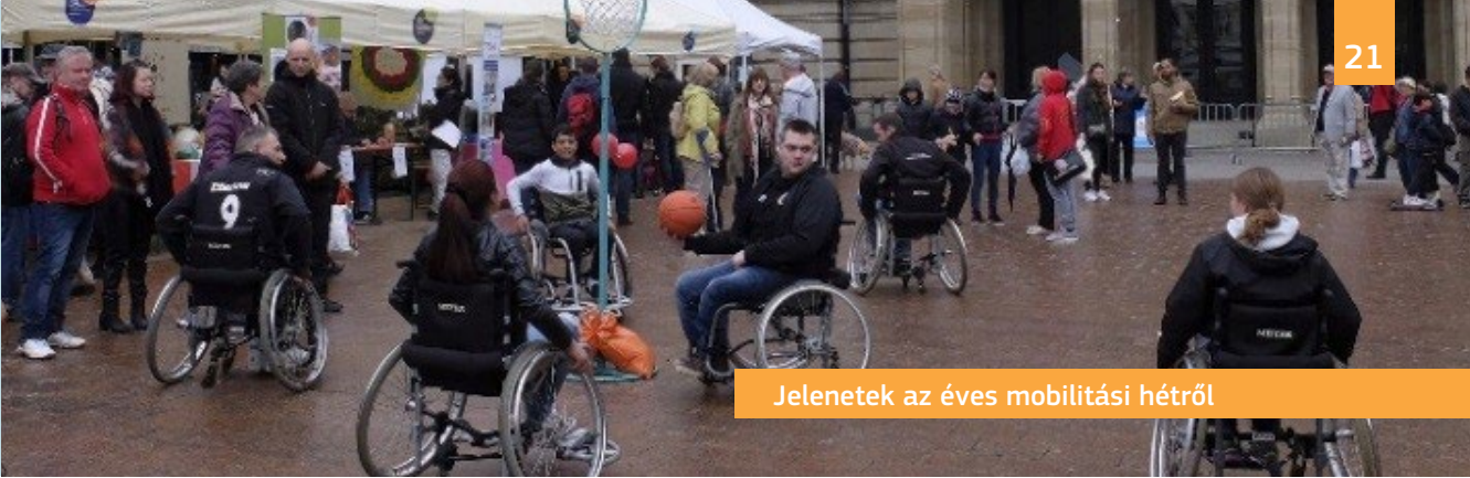
Jelenetek az éves mobilitási hétről