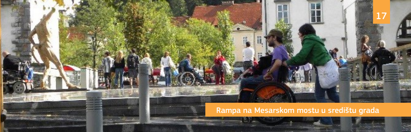
Rampa na Mesarskom mostu u središtu grada