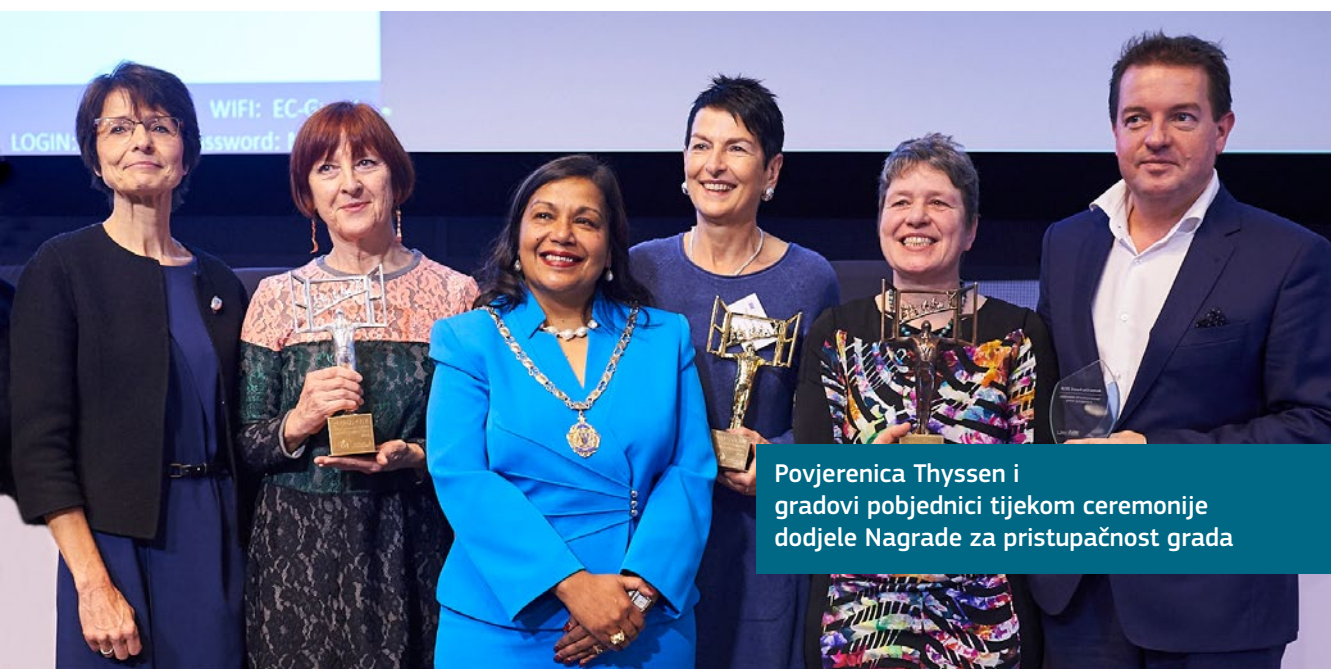
Povjerenica Thyssen i gradovi pobjednici tijekom ceremonije dodjele Nagrade za pristupačnost grada

Ove nagrade ističu da za poboljšanje pristupačnosti nije uvijek potrebno veliko ulaganje ili veliki radovi. Ona se također može postići razumijevanjem potreba i upotrebom ograničenih sredstava za postizanje najboljeg učinka. Čak i male promjene čine mnogo kako bi se osiguralo da ljudi mogu sudjelovati u gradskom životu.