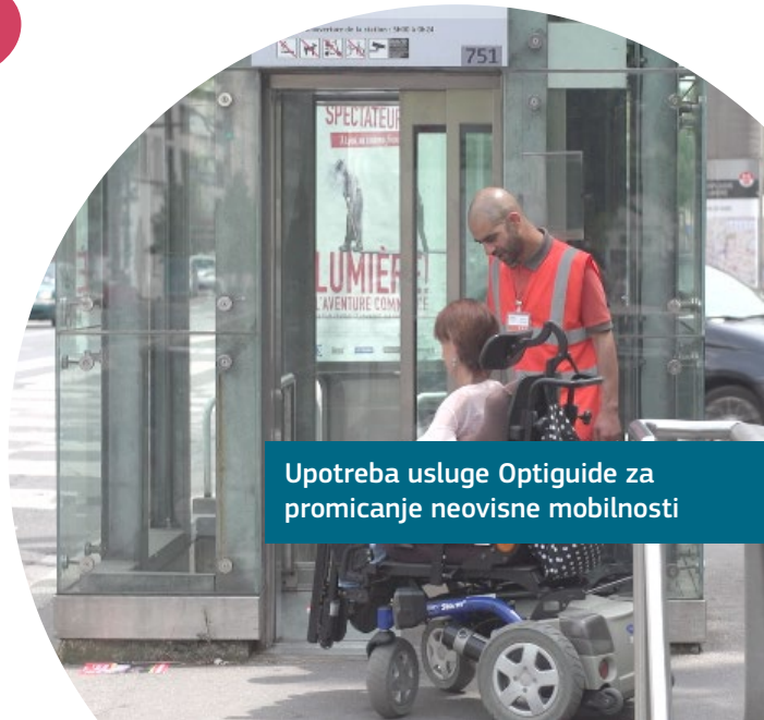
Upotreba usluge Optiguide za promicanje neovisne mobilnosti