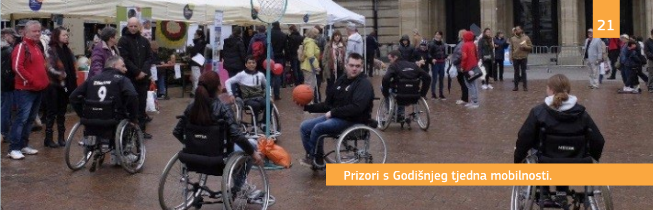
Prizori s Godišnjeg tjedna mobilnosti.