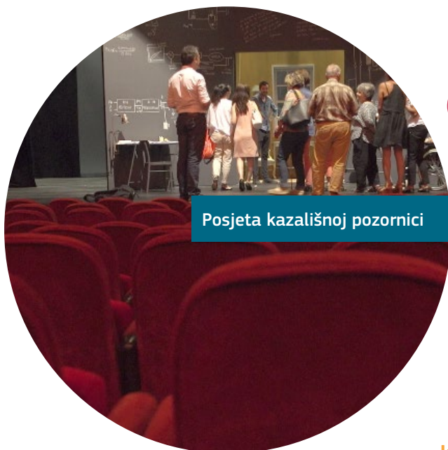
Posjeta kazališnoj pozornici