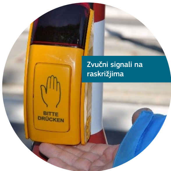
Zvučni signali na raskrižjima