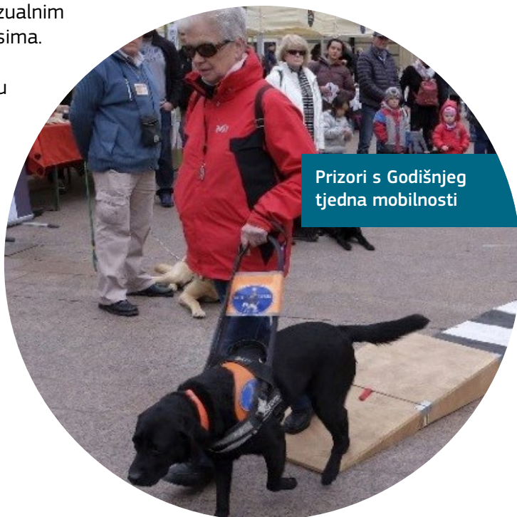
Prizori s Godišnjeg tjedna mobilnosti

Program obuhvaća godišnji Tjedan mobilnosti i Glazbeni festival, svečanu predstavu na kojoj nastupaju izvođači s invaliditetom i pristupačne obilaske grada i muzeja s vodičem.