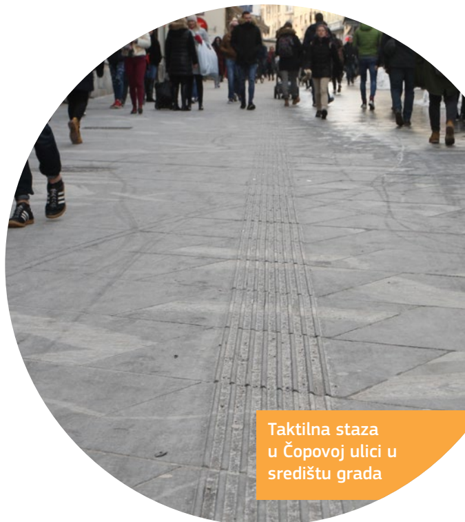
Taktilna staza u Čopovoj ulici u središtu grada

Dostupna je karta grada s pristupačnim lokacijama.