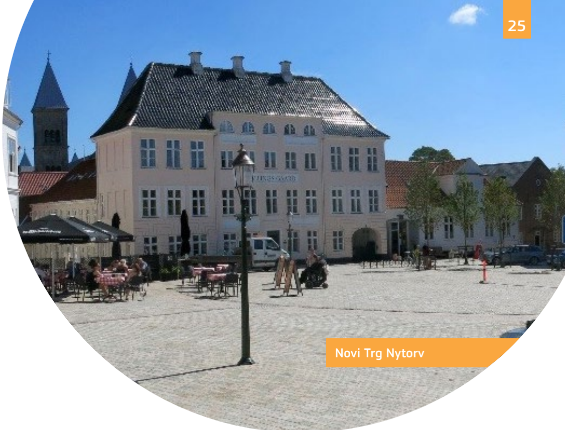
Novi Trg Nytorv

U povijesnom gradu nekoliko je javnih trgova, parkova i ulica učinjeno pristupačnima zahvaljujući novim spuštenim pločnicima, rampama i taktilnim crtama vođenja. Trg Nytorv novo je potpuno pristupačno javno područje nastalo na mjestu starog parkirališta za automobile.