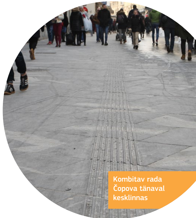
Kombitav rada Čopova tänaval kesklinnas

Saadaval on linnakaart, kuhu on märgitud ligipääsetavad kohad.