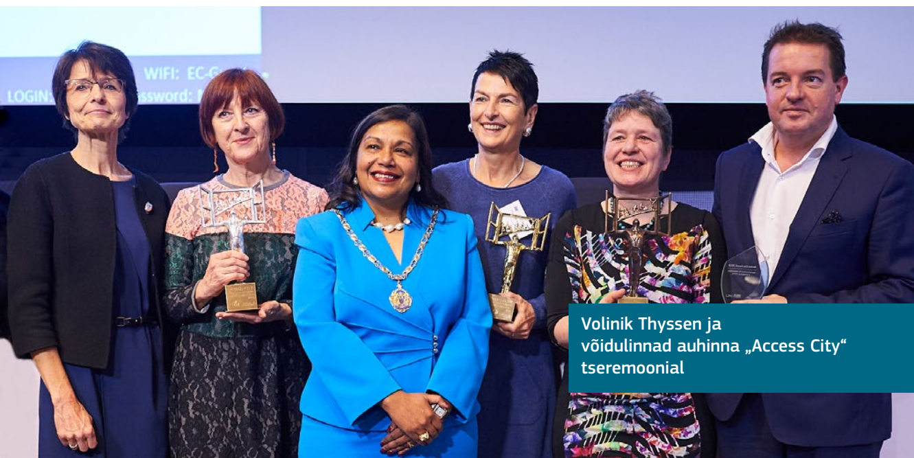
Volinik Thyssen ja võidulinnad auhinna „Access City“ tseremoonial

Auhinnad rõhutavad, et ligipääsetavuse parandamine ei tähenda alati suures mahus investeringuid ega töid. Tegemist võib olla ka vajaduste mõistmisega ja piiratud ressursside kasutamisega parimal võimalikul moel. Kaugeleulatuv mõju võib olla ka pisimuudatustel, mis tagavad, et inimesed saavad linnaelust osa võtta.