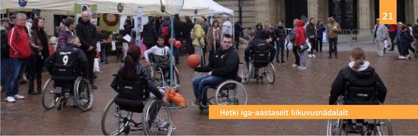
Hetki iga-aastaselt liikuvusnädalalt