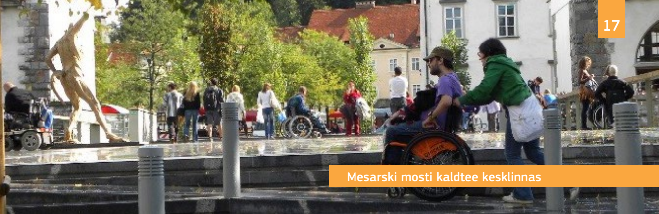
Mesarski mosti kaldtee kesklinnas