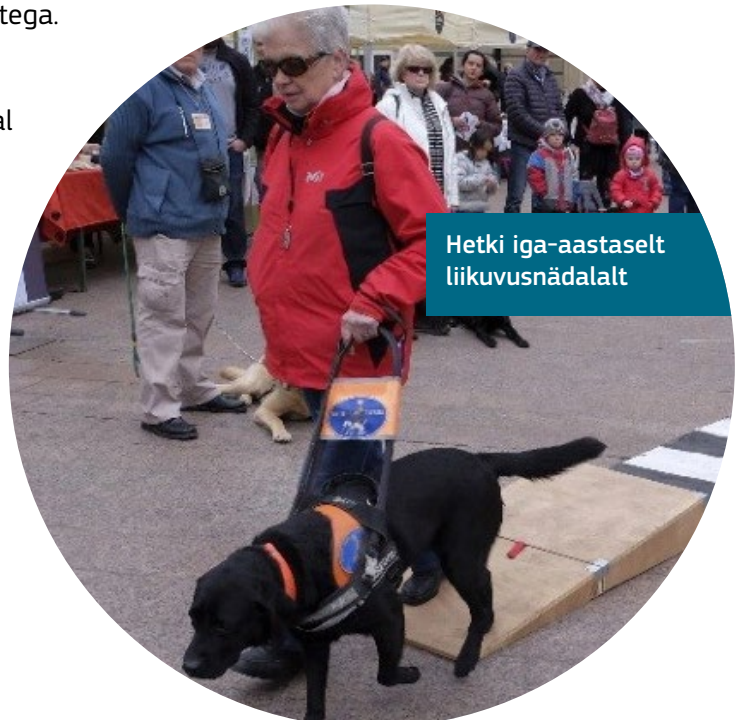
Hetki iga-aastaselt liikuvusnädalalt

Programmi kuuluvad iga-aastane liikuvusnädal ja muusikafestival; kaasamisgala, kus esinevad puuetega artistid; ning ligipääsetavad giidiga ringkäigud linnas ja muuseumis.