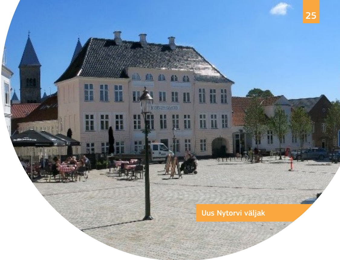
Uus Nytorvi väljak

Ajaloolises linnas on muudetud uute tasandatud sillutiste, kaldteede ja kombitavate juhtribade abil ligipääsetavaks mitu avalikku väljakut, aeda ja tänavat. Nytorvi väljak on täiesti ligipääsetav avalik ala, mis ehitati ümber vanast autoparklast.