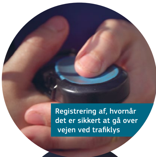
Registrering af, hvornår det er sikkert at gå over vejen ved trafiklys