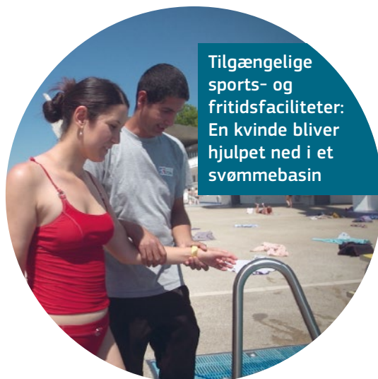
Tilgængelige sports- og fritidsfaciliteter: En kvinde bliver hjulpet ned i et svømmebassin

Byens hjemmeside har en side rettet mod mennesker med handicap, hvor alle nyttige oplysninger om tilgængelighed og andre emner samles. Byens avis fås både med blindeskrift og i lydformat.