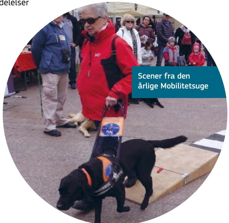
Scener fra den årlige Mobilitetsuge

Programmet omfatter en årlig mobilitetsuge og musikfestival, et inklusionsgallashow med optrædere fra kunstnere med handicap og tilgængelige guidede ture i byen og på museum.