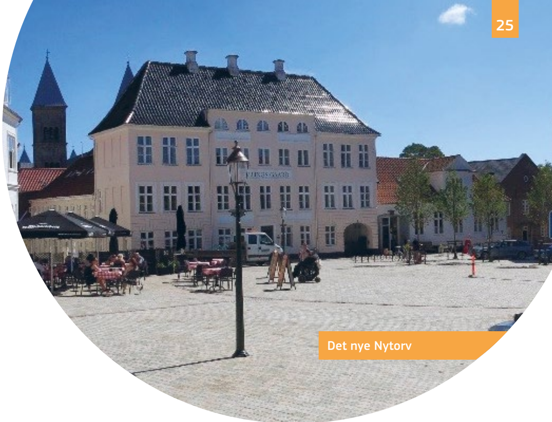
Det nye Nytorv

I denne historiske by er flere offentlige pladser, haver og gader blevet gjort tilgængelige med nye nivellerede fortove, ramper og taktile ledestriber. Nytorvet er et nyt, fuldt tilgængeligt offentligt område, der er blevet skabt ud af en gammel parkeringsplads.