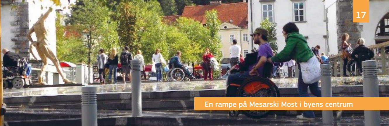
En rampe på Mesarski Most i byens centrum