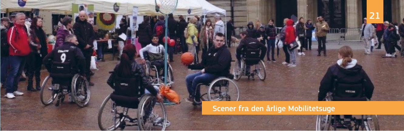
Scener fra den årlige Mobilitetsuge