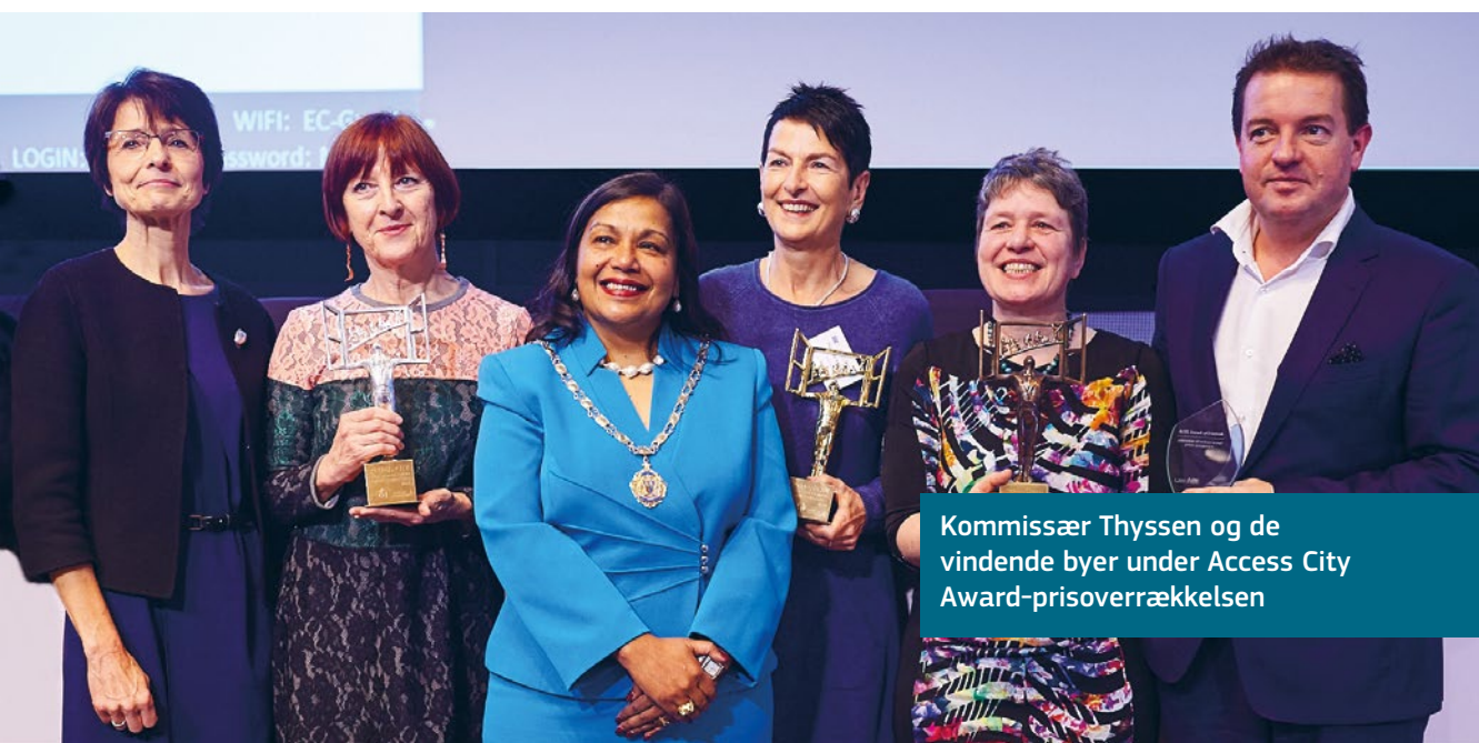
Kommissær Thyssen og de vindende byer under Access City Award-prisoverrækkelsen

Disse priser understreger, at forbedring af tilgængeligheden ikke altid handler om store investeringer eller større byggearbejder. Det kan også handle om at forstå folks behov og at anvende begrænsede ressourcer så godt som muligt. Selv små ændringer kan række langt, når det gælder om at sikre, at folk kan deltage i bylivet.