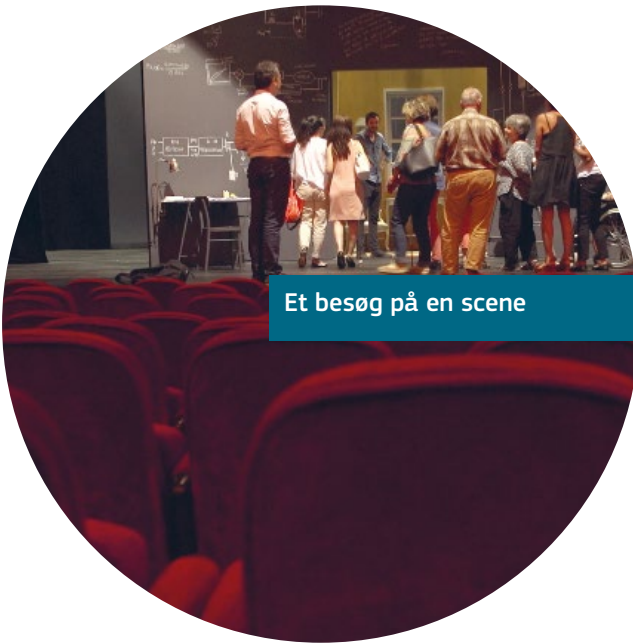
Et besøg på en scene