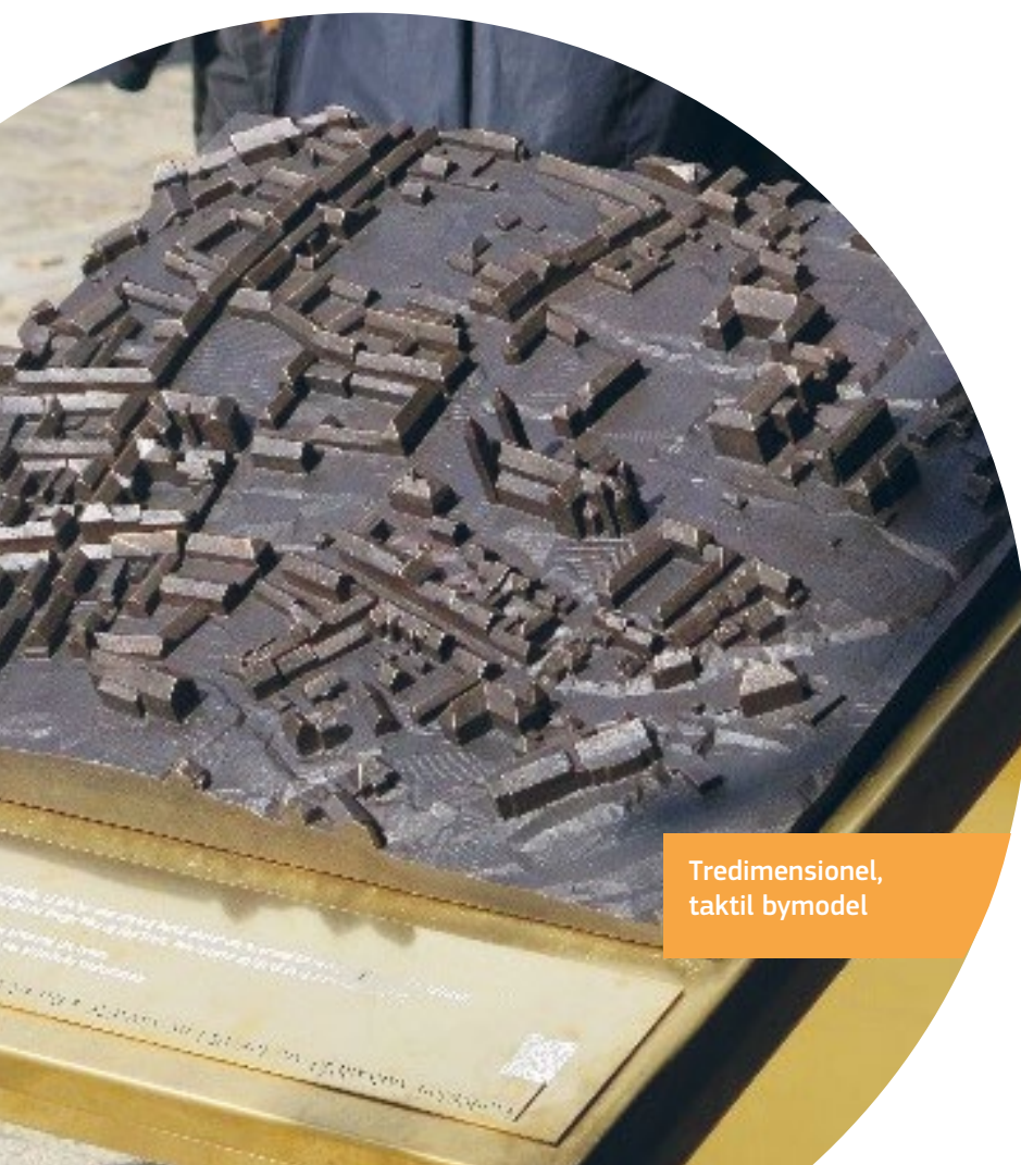
Tredimensionel, taktil bymodel

Viborg Kommunes vision er, at alle skal have mulighed for at leve et sundt og aktivt liv med adgang til en bred vifte af blandt andet kultur- og fritidsoplevelser. Kommunen vedtog i 2009 en handicappolitik. Den var baseret på feedback fra workshops og møder med lokale borgere, organisationer af mennesker med handicap og ældre mennesker og de vigtigste interessenter i bymidten. Politikken indeholder en tjekliste for tilgængelighed, der omfatter offentlige steder og bygninger, med handlingsanbefalinger.