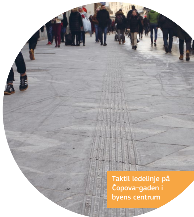
Taktile ledelinje på Čopova-gaden i byens centrum

Der kan fås et bykort over tilgængelige steder.