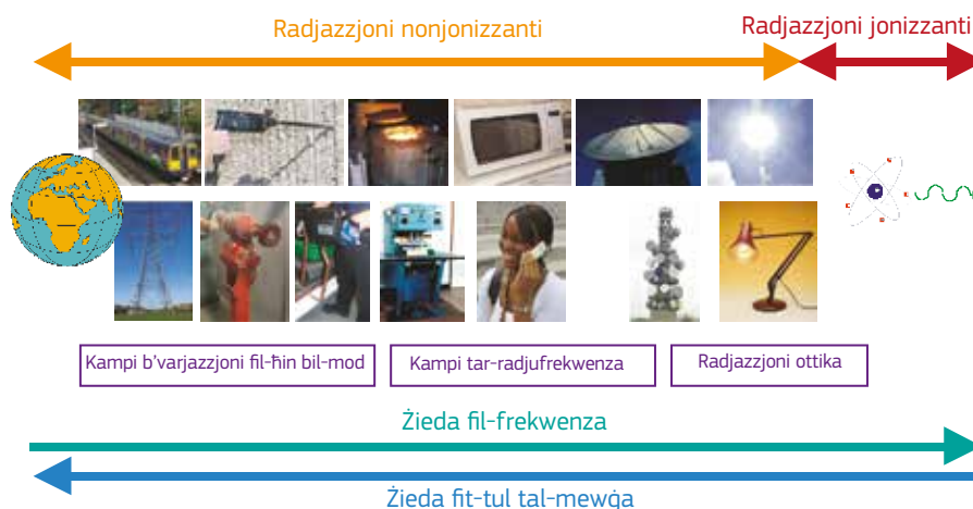
Figura 3.1 Rappreżentazzjoni skematika tal-ispettru elettromanjetiku li juri xi sorsi tipiċi

L-għan ta' din il-gwida huwa li tipprovdi lill-impjegaturi b'informazzjoni dwar is-sorsi ta' EMF li jinsabu fl-ambjent tax-xogħol biex jiġu megħjuna jiddeċiedu jekk hijiex meħtieġa valutazzjoni oħra tar-riskju mill-EMF. Il-firxa u l-kobor tal-kampi elettromanjetiċi prodotti jiddependu fuq il-vultaġġ, il-kurrenti u l-frekwenzi li jopera jew jiġġenera fihom it-tagħmir, flimkien mad-disinn tat-tagħmir. Xi tagħmir jaf ikun iddisinjat biex jiġġenera b'mod intenzjonali kampi elettromanjetiċi esterni. F'dan il-każ, tagħmir żgħir b'qawwa baxxa jista' jirriżulta f'kampj elettromanjetiċi esterni sinifikanti. Generalment, it-tagħmir li juża kurrenti għoljin, vultaġġi għoljin jew li huwa ddisinjat biex jemetti radjazzjoni elettromanjetika jkollu b'żonn valutazzjoni ulterjuri.