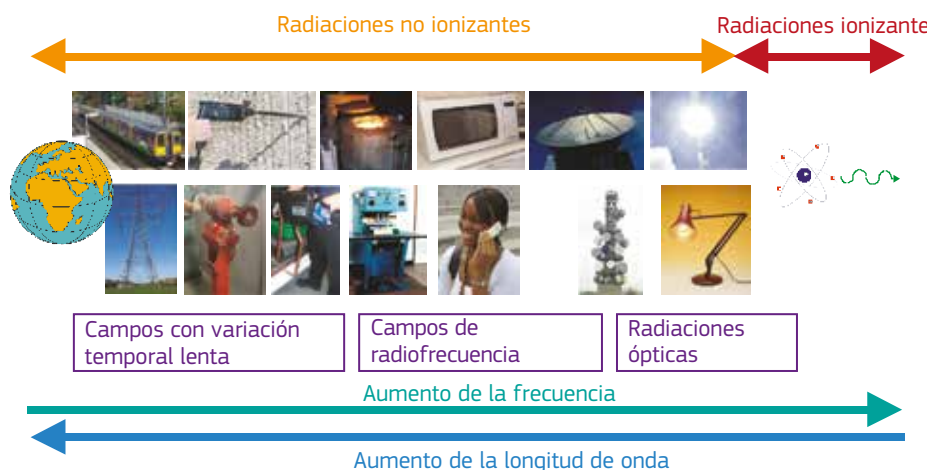
Figura 3.1. Representación esquemática del espectro electromagnético con indicación de algunas fuentes típicas

La finalidad de esta guía es proporcionar a los empresarios información sobre las fuentes de campos electromagnéticos existentes en el entorno laboral, para ayudarlos a decidir si es necesario realizar una evaluación adicional de los riesgos derivados de los campos electromagnéticos. El alcance y la magnitud de los campos electromagnéticos producidos dependerán de las tensiones, intensidades y frecuencias que utilice o genere el equipo, junto con su diseño. Algunos equipos pueden estar diseñados para generar intencionadamente campos electromagnéticos externos. En este caso, un pequeño equipo de baja potencia puede dar lugar a campos electromagnéticos externos significativos. Generalmente requieren una evaluación adicional los equipos que utilizan intensidades elevadas o altas tensiones y los que están diseñados para emitir radiaciones electromagnéticas.