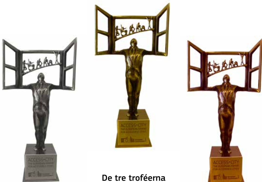
De tre troféerna Access-City Award 2015