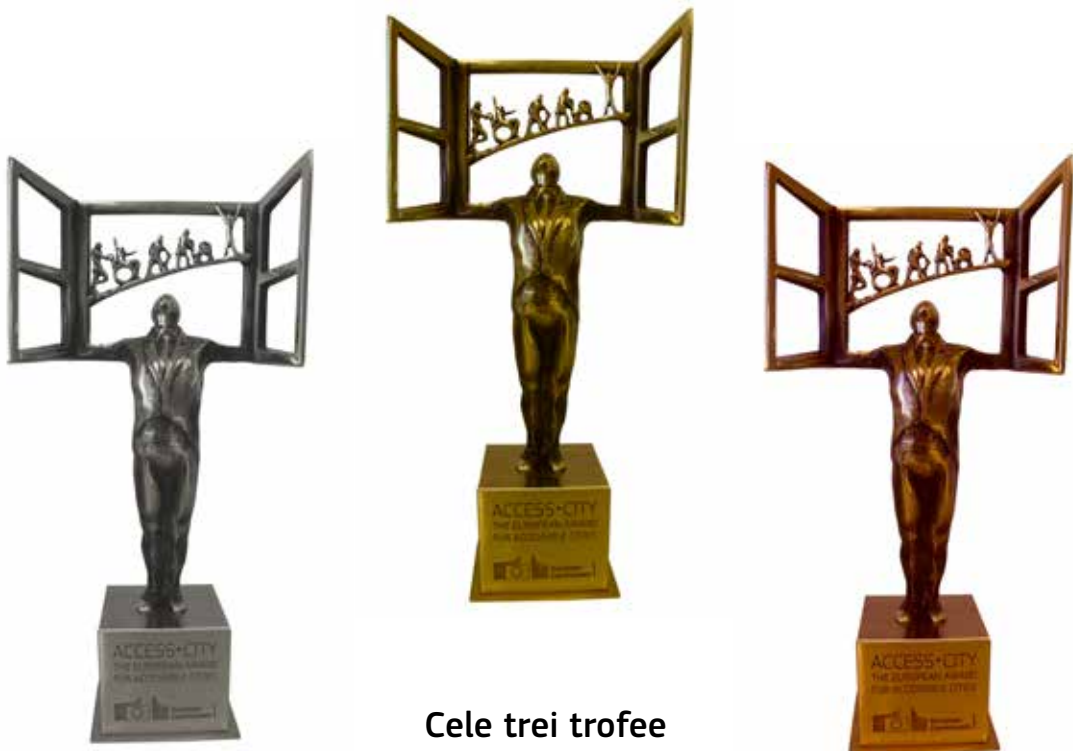
Cele trei trofee Access-City Award 2015