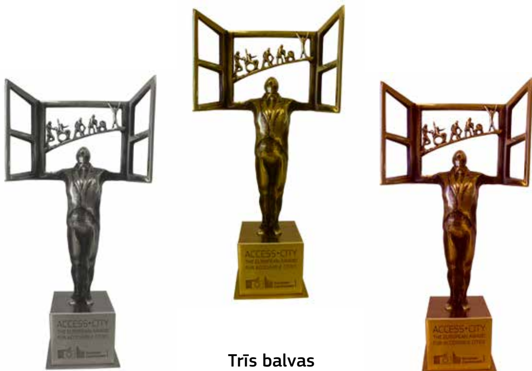
Trīs balvas Access-City Award 2015