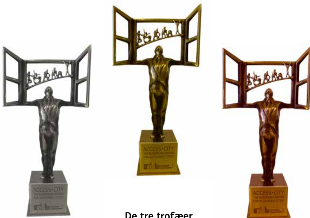
De tre trofæer Access • City Award-konkurrencen 2015