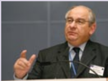
Michel Delebarre Formand for Regionsudvalget

»Behovet for øget ejerskab på alle niveauer anerkendes som en af nøglefaktorerne for Lissabon-strategiens succes ... Lissabon-reformer skal involvere EU-regioner og lokale myndigheder i større udstrækning og på et tidligt tidspunkt i forvaltningscyklussen ... Regionsudvalget har forpligtet sig til at bidrage til overvågningen af lokal og regional deltagelse i Lissabon-processen og gennemførelsen af reformerne for vækst og beskæftigelse ... Der er rigelig plads til større deltagelse på lokalt og regionalt niveau i vækst- og beskæftigelsesstrategien. Ansvar for Lissabon-dagsordenen tilfalder alle interessehavere på EU-niveau og på nationale, regionale og lokale niveauer, og mobiliseringen er kun mulig, hvis de forskellige parter føler, at de foreslåede politikker vedrører dem, og de i sandhed er involveret i beslutningstagnings- og gennemførelsesprocessen.«