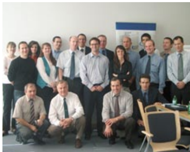
REGINS' styrekomité og medarbejdere ved et møde i Gmunden, Østrig

Fire regioner fra Italien, Tyskland, Ungarn og Østrig samarbejder inden for REGINS-projektet (»REGional standardiserede Interfaces til bedre integration af regionale SMV'er i den europæiske økonomi«), der modtager støtte mellem 2004 og 2007 fra Interreg IIIC-initiativet og Den Europæiske Fond for Regionaludvikling (EFRU). Det overordnede formål med REGINS er at stimulere overførslen af knowhow om forvaltning af klynger, regional innovation og SMV-støttepolitikker mellem partnerne, for at lægge grunden for et langsigtet og strategisk samarbejde. Projektets delmål er (a) at fremme offentlig-private partnerskaber, (b) at opmuntre til udveksling og overførsel af knowhow om bestemte temaer, (c) at etablere regionale netværkskontorer for at støtte netsamarbejde mellem partnere i regionen, (d)