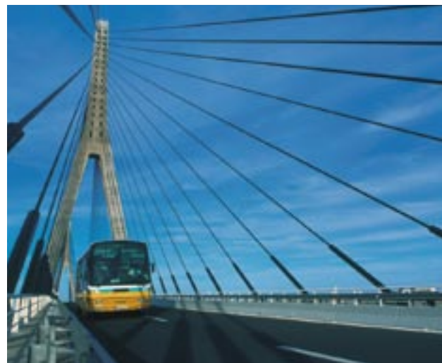
Bro mellem Spanien og Portugal over Guadian-floden, Algarve, Portugal

Initiativet Regioner for Økonomisk Forandring vil omfatte følgende innovationer: