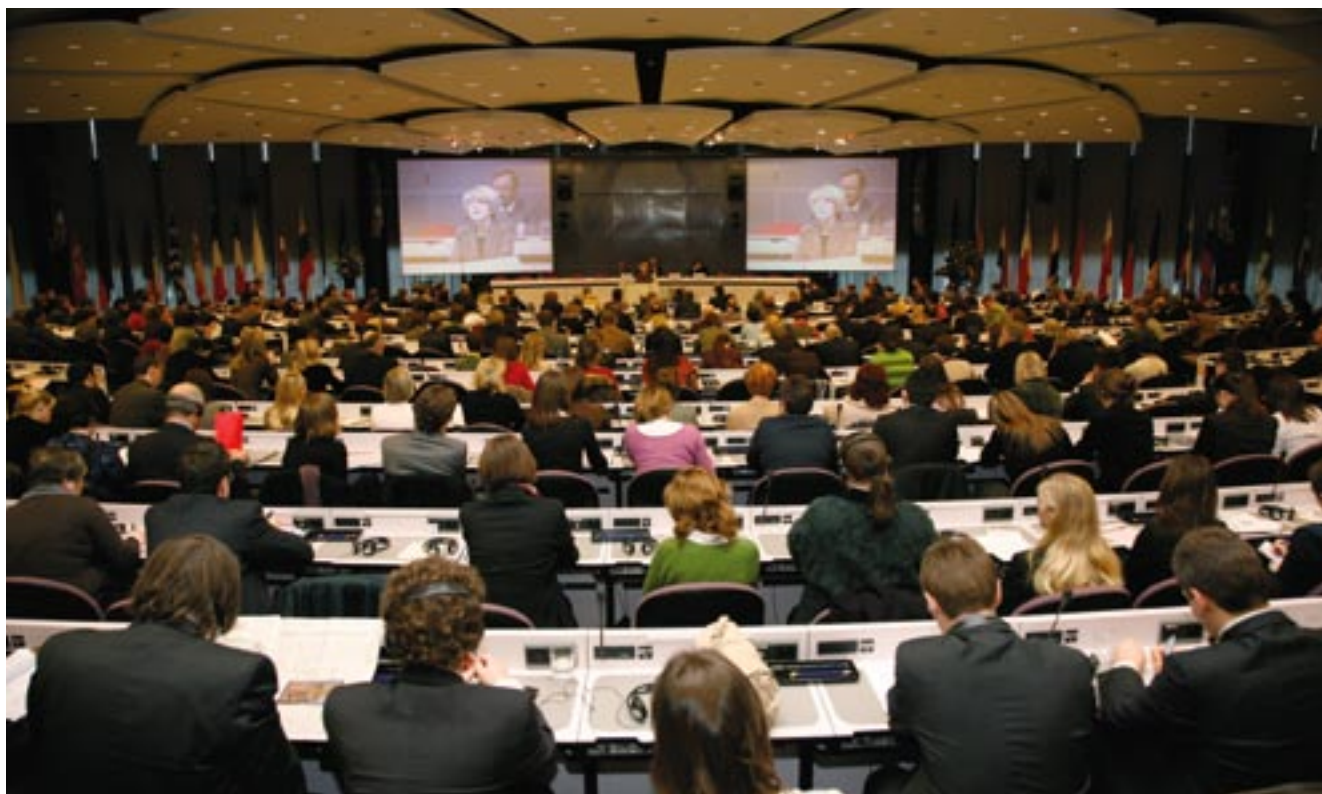
Ved den anden konference om Regioner for Økonomisk Forandring i januar 2007

Der vil blive afholdt et forum i samarbejde med den franske region Provence-Alpes-Côtes d'Azur og Regionsudvalget. Sidstnævnte vil fremlægge »Lissabon-overvågningsplatformen« (»Lissabon