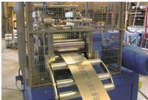
Den ny produktionslinje.

Produktionslinjen blev udviklet i partnerskab med Oy Samesor, en førende finsk virksomhed på dette område. De nye idéer, som Loodesystem stillede til rådighed, blev ført ud i livet af partnerskabet efter ni måneders samarbejde.