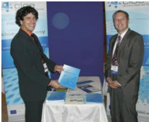
CLOE-stand ved TCI-kongres i Lyon, Frankrig

Hovedformålet med CLOE-projektet — Europæisk Forbundne Klynger (Clusters Linked over Europe), der er finansieret under Interreg IIIC-initiativet og Den Europæiske Fond for Regionaludvikling (EFRU), er at oprette et europæisk klyngenetværk. Til dette formål samarbejder offentlige og private partnere fra regioner i seks medlemsstater og Rusland mellem juli 2004 og juni 2007. Projektets hovedformål er følgende: (a) lære af, hvad klynger i andre industrier og regioner har udviklet; (b) fremme udveksling af viden og ekspertise mellem klynge-SMV'er, som er beskæftiget inden for samme industri; og (c) øge klyngers synlighed i partnerregioner, i andre europæiske regioner og i lande som Kina og USA.