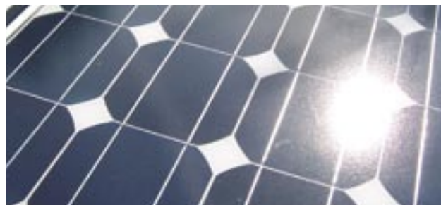
Fotovoltaiske celler: erfaringsudveksling om vedvarende energi udgør en del af »EMERGENCE 2010«-projektet.

EMERGENCE 2010-partnerne omfatter Balearernes handelskammer for handel, industri og energi (Spanien), provinsen Cagliari (Sardinia, Italien), den regionale provins Caltanissetta (Sicilia, Itali-