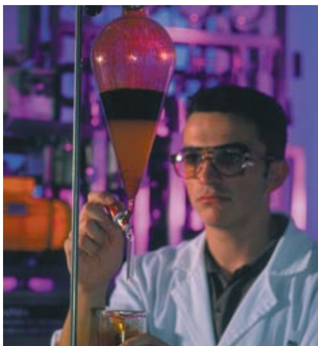
Instituto Tecnológico de Aragón, Zaragoza, Spanien, medfinansieret af Den Europæiske Fond for Regionaludvikling.

Kortet på næste side viser resultaterne fra den seneste europæiske regionale scoretavle for innovation. Sammenlignet med andre regionale skævheder så som BNP pr. person bekræfter det, at de mindre udviklede regioner vil kræve, at der gøres en ekstra indsats