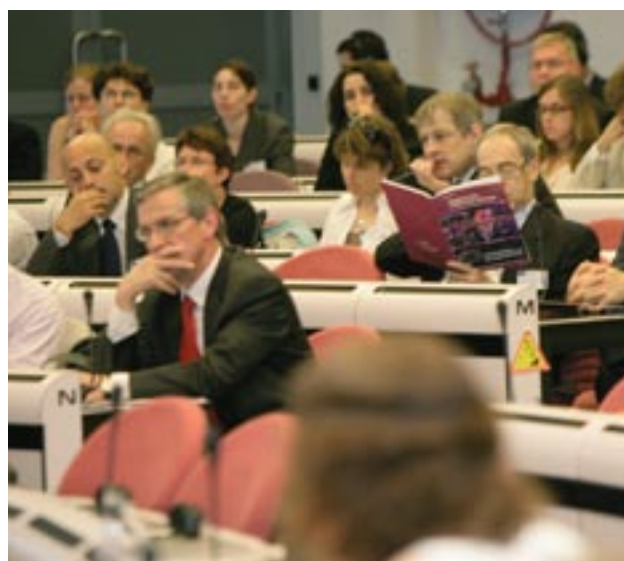
Ved konferencen Innovation gennem Regionalpolitik i juni 2006

Omkring 600 personer deltog i konferencen. De repræsenterede nationale og regionale myndigheder, som medvirker til at planlægge og gennemføre strukturfondsprogrammer, repræsentanter for erhvervsorganisationer, universiteter, specialister i teknologioverførsel og specialistnetværk. Samtidigt med konfe-