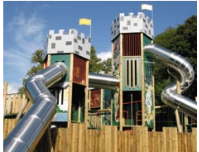
Legeplads i Lough Key Forest & Leisure Park, Irland.

Midt i 1990'erne påbegyndte Coillte, det statsejede skov- og egnsforvaltningsselskab, der ejer parken, et omfattende saneringsprojekt i partnerskab med distriktsrådet i Roscommon (Roscommon County Council). Projektet involverede nedrivningen af nogle af parkens eksisterende strukturer og renovering og sa-