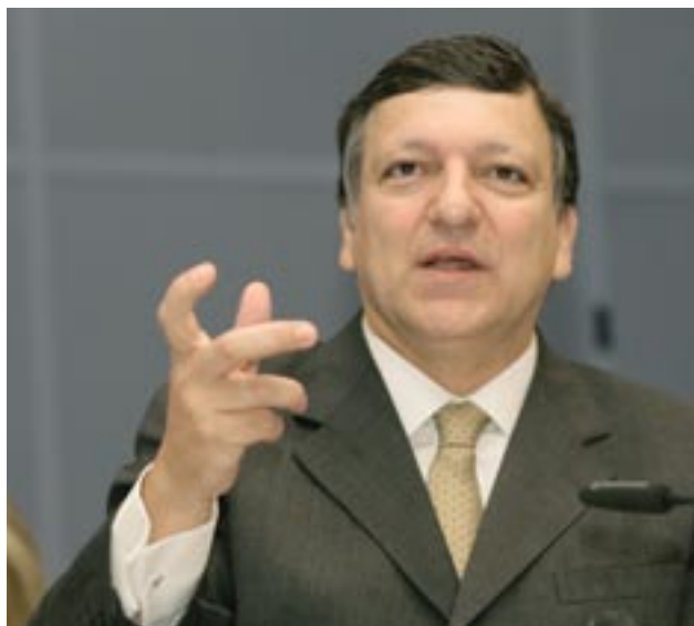
José Manuel Barroso, formand for Europa-Kommissionen, åbner den første konference om regioner for økonomisk forandring, der handler om innovation, i juni 2006.

Initiativet Regioner for Økonomisk Forandring involverer to instrumenter under Den Europæiske Fond for Regionaludvikling — den interregionale linje af programmet Europæisk Territorialt Samarbejde (4) og netværksprogrammet om byudvikling, Urbact. Herunder foreslås det, at der i disse programmer fokuseres på økonomiske udviklingstemaer, som Kommissionen har fastsat, og som er i overensstemmelse med Fællesskabets strategiske retningslinjer om samhørighed 2007-2013 (5) . De to instrumenter vil alt i alt have et budget på 375 mio. EUR for perioden 2007-2013.