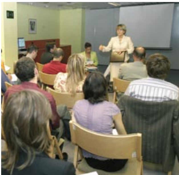
Diskussion med kommissær Danuta Hübner ved den første konference om regioner for økonomisk forandring i juni 2006.

Under initiativet Regioner for Økonomisk Forandring vil der blive oprettet netværk gennem ansøgning til de fremtidige interregionale netværksprogrammer for samarbejde og byudvikling (Urbact) , der forventes vedtaget i anden halvdel af 2007. I henhold til programprocedurerne vil en ledende region ansøge om finansiering til et netværk fra det dertil hørende program. Overvågningsudvalget vil være ansvarlig for at vælge projekterne på grundlag af de udvælgelseskriterier, som den har fastlagt.