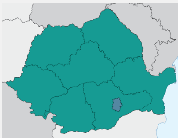
Categorii de regiuni pentru FEDR, FSE și FEADR 2014-2020 ■ Regiuni mai puțin dezvoltate (PIB/cap de locuitor < 75 % din media UE-27) ■ Regiuni mai dezvoltate (PIB/cap de locuitor >= 90 % din media UE-27)

Cu un buget de 454 de miliarde EUR pentru perioada 2014-2020, fondurile structurale și de investiții europene (fondurile ESI) sunt principalul instrument al politicii de investiții a Uniunii Europene. Fondurile ESI combină cinci fonduri: Fondul european de dezvoltare regională (FEDR), Fondul social european (FSE), Fondul de coeziune (FC), Fondul european agricol pentru dezvoltare rurală (FEADR) și Fondul european pentru pescuit și afaceri maritime (FEPAM). România, împreună cu alte 19 state membre, va beneficia, de asemenea, de inițiativa privind ocuparea forței de muncă în rândul tinerilor (YEI).