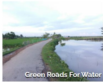
Green Roads For Water