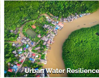
Urban Water Resilience