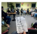
Include and Activate!