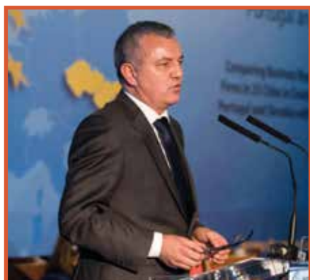
Darko Horvat, minister gospodarki, Chorwacja Vittoria Alliaata Di Villafranca, Komisja Europejska

W Portugalii Porto przoduje w kwestii uzyskiwania pozwoleń na budowę. Przedsiębiorstwa w Coimbrze mają ułatwiony dostęp do energii elektrycznej i mogą łatwiej egzekwować umowy, ale Faro, Funchal i Ponta Delgada mogą pochwalić się mniejszą biurokracją przy rejestrowaniu nieruchomości. Inaczej niż w innych trzech państwach członkowskich, pojedyncze miasta portugalskie są liderami w różnych sektorach.