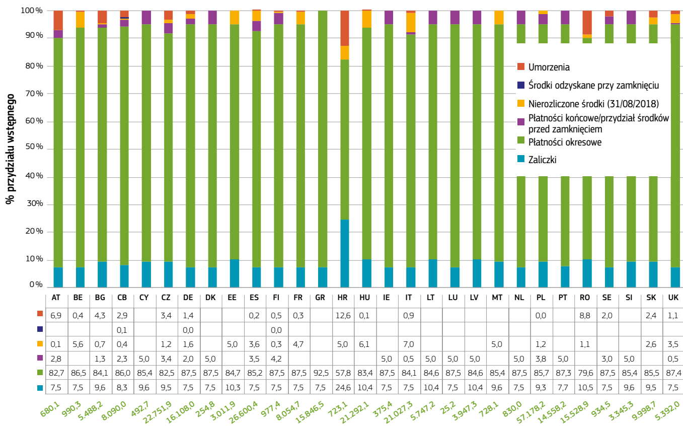
Płatności wstępne (w mln EUR)