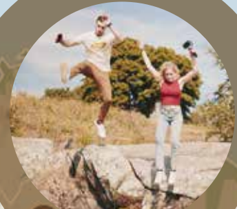
Achilleas i Luna