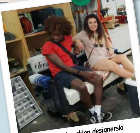
Gabarage: genialny sklep designerski w Wiedniu, Austria