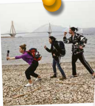
Most Rio-Antirrio, Zatoka Koryncka, Grecja