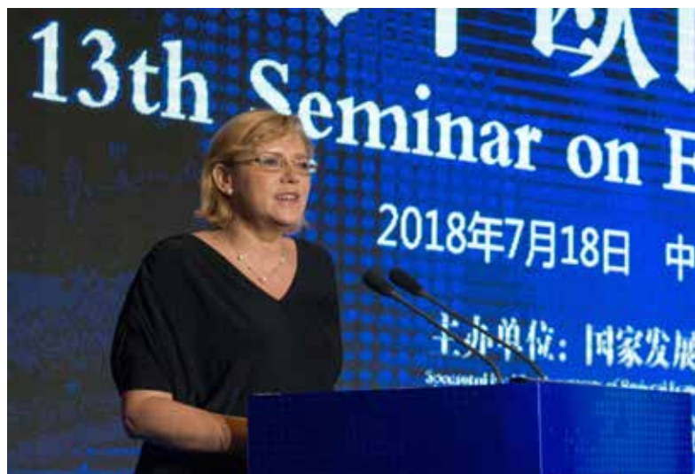
Europejska komisarz ds. polityki regionalnej, Corina Crețu, przemawia podczas niedawnej wizyty w Chinach

Kluczowym narzędziem dla rozwoju wspomnianego już wymiaru zewnętrznego jest obecnie program międzynarodowej współpracy miast (2017-2019) , który zawiera zasadniczy element wspierający władze miejskie z UE i spoza UE we współpracy w zakresie zrównoważonego rozwoju obszarów miejskich. Program opiera się na pięciu latach działań