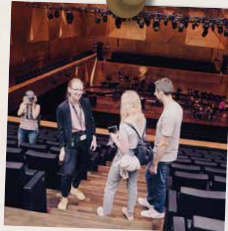
Nowa sala koncertowa w Szczecinie, Polska