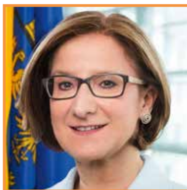
Johanna Mikl-Leitner Członek Europejskiego Komitetu Regionów starosta krajowy Dolnej Austrii

Dolna Austria to największy region kraju pod względem obszaru. Zamieszkuje ją 1,67 mln osób, co sprawia, że jest jednocześnie drugim w kolejności największym regionem pod względem liczby ludności. Niezmiernie ważne dla Dolnej Austrii są wyzwania związane z dynamiką gospodarczą, infrastrukturą, bliskością Wiednia, a także z sąsiedztwem Czech i Słowacji.