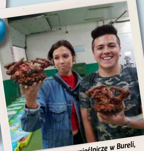
Rybne przetwory rzemieślnicze w Bureli, Hiszpania