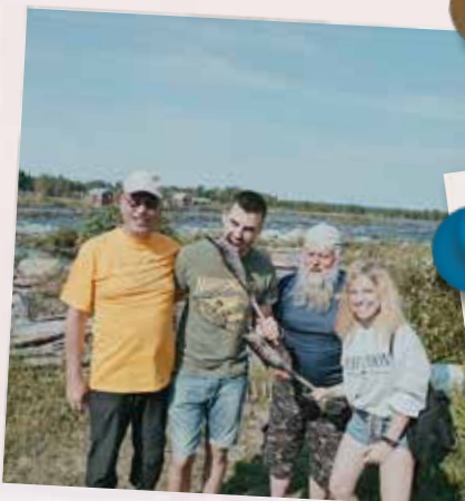
Spotkanie z prawdziwymi fińskimi rybakami, Tornio, Finlandia