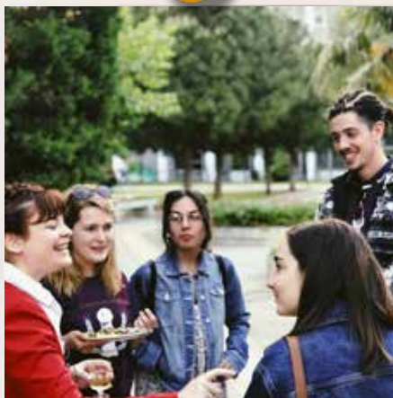
PlantCult, Saloniki, Grecja