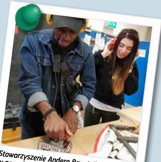
Stowarzyszenie Andre Baustelle, w poszukiwaniu nowej ścieżki kariery w Ulm, Niemcy