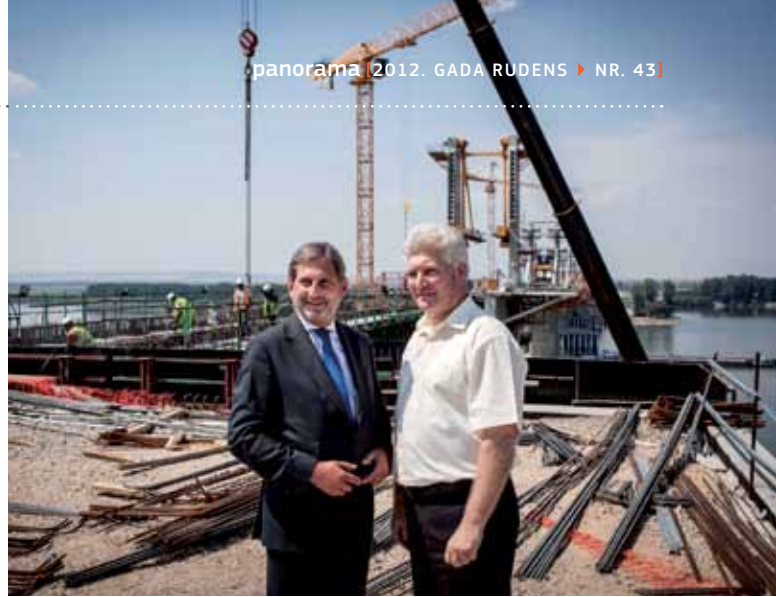
Pabeigt Vidina-Kalafata tilta celtniecību, kas savieno Bulgāriju un Rumāniju, ir plānots 2012. gada beigās. Šis tilts ir daļa no Eiropas transporta tīkla, kas atvieglos transporta savienojumus starp Bulgārijas ziemeļrietumiem, Rumānijas dienvidrietumiem un Ungārijas austrumiem.

2012. gada novembrī Komisija un Bavārijas varas iestādes rīkos pirmo ikgadējo forumu par stratēģiju. Šajā forumā varēs novērtēt līdzšinējo paveikto darbu, atklāt stratēģijas pievienoto vērtību, informēt sabiedrību un sekmīgāk plānot nākamās darbības. Visas ieinteresētās personas tiek aicinātas izteikt priekšlikumus un idejas.