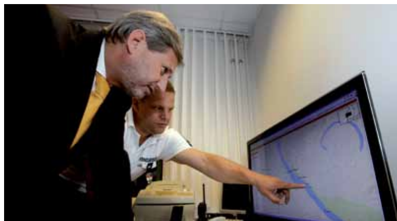
Komisārs J. Hahn devās arī uz Šengenas zonas upes robežšķērsošanas punktu starp Ungāriju un Horvātiju Mohāčas ostā. Šeit vienuviet pieejama visjaunākā informācijas kopīgošanas tehnoloģija, kas vienkāršo mobilitāti un tirdzniecības iespējas, kā arī uzlabo drošību.