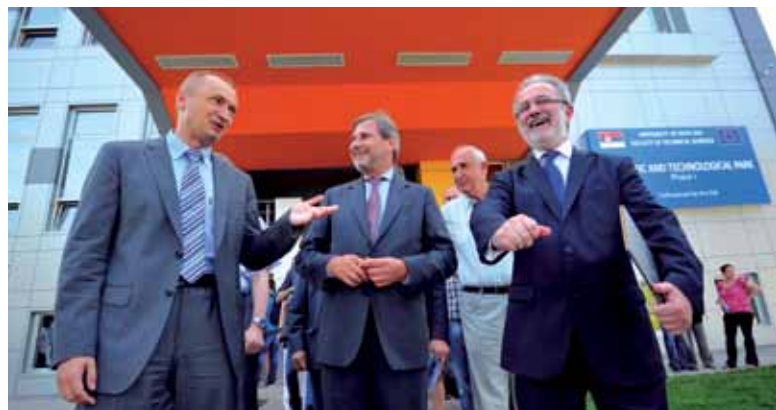
Komisārs J. Hahn apmeklēja uzņēmējdarbības inkubatoru un zinātnes parka projektus Osijekā (Horvātija) un Novi Sadā (Serbija), kuros tiek radītas jaunas izpētes, inovācijas un uzņēmējdarbības iespējas.