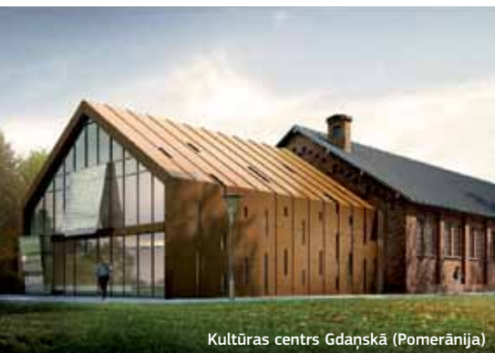
Kultūras centrs Gdaņskā (Pomerānija)

Lielpolijas pilsētvides attīstības fonda prioritāte ir atjaunot biznesa vidi un atbalstīt to. Kopš darbības līguma parakstīšanas 2010. gada septembrī fonds ir saņēmis 26 aizdevumu pieteikumus par kopējo summu EUR 59 milj. un ir parakstījis 6 investīciju līgumus par kopējo summu EUR 23,2 milj. (nesen ir apstiprināts vēl viens projekts par aptuveni EUR 1,5 milj., un drīzumā tiks parakstīts investīciju līgums). Atbalstītie projekti skar vecu vai vēsturisku ēku renovāciju, lai tās izmantotu kā inter alia biznesa inkubatorus un kultūras centrus.