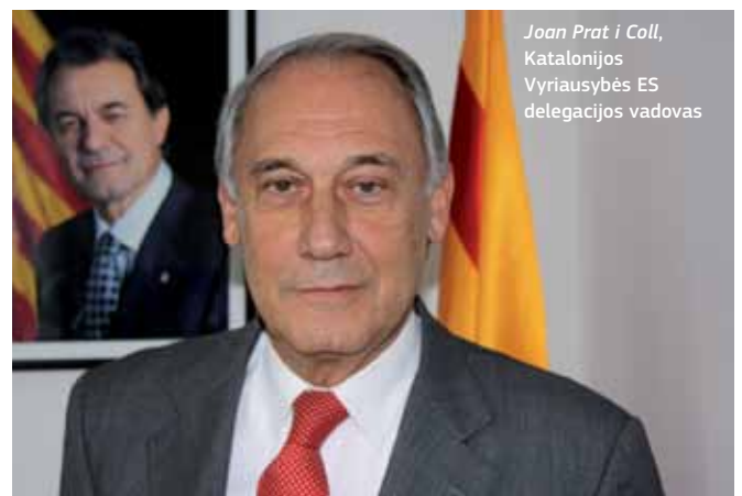
Joan Prat i Coll , Katalonijos Vyriausybės ES delegācijas vadovas

Katalonija kiekvienais metais dalyvavo atvīrū durū dienose, kurios vėliau išsiplėtē ir tapo Europos reģionū ir miestū savaite. “Per šį 10 metų laikotarpį matēme, kaip atvīrū durū dienos tapo svarbiausiu ES metiniu renginiu, stebėjome, kaip nacionalinės, reģioninės ir vietinės valdžios institucijos demonstravo ir aptarinėjo ES sanglaudos politikos valdyma, rezultatus ir perspektyvas. Jos pritraukia daugiau nei 6 000 dalyviū iš visos ES. Atvīrū durū dienose aktyviai dalyvauja daugiau nei 200 Europos reģionū ir miestū.”