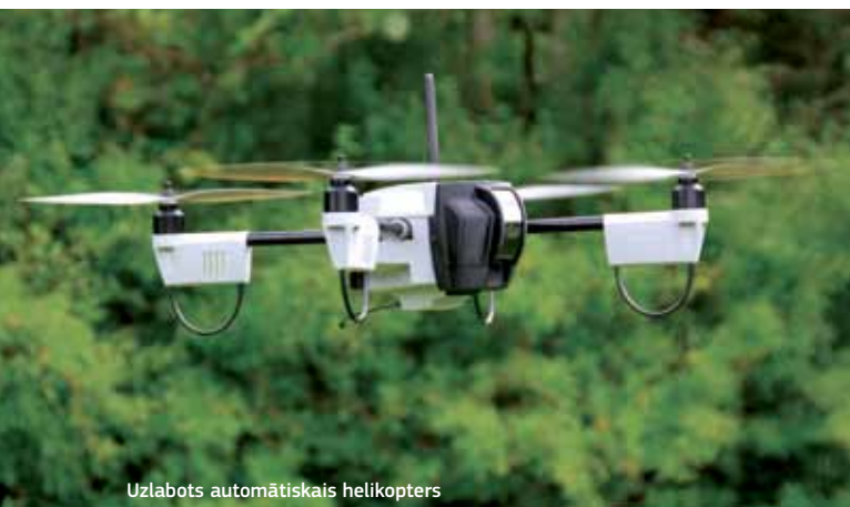
Uzlabots automātiskais helikopters

Dānijas projekti atbalsta attīstību, veidojot partnerību. Tiešās dotācijas atsevišķos uzņēmumos tiek investētas reti. Tipisks reģionālā fonda projekts ir Olborgas universitātes Starptautiskais inovāciju centrs. Uzņēmumu tīklā tiek apvienota kompetence no dažādiem uzņēmējdarbības sektoriem.