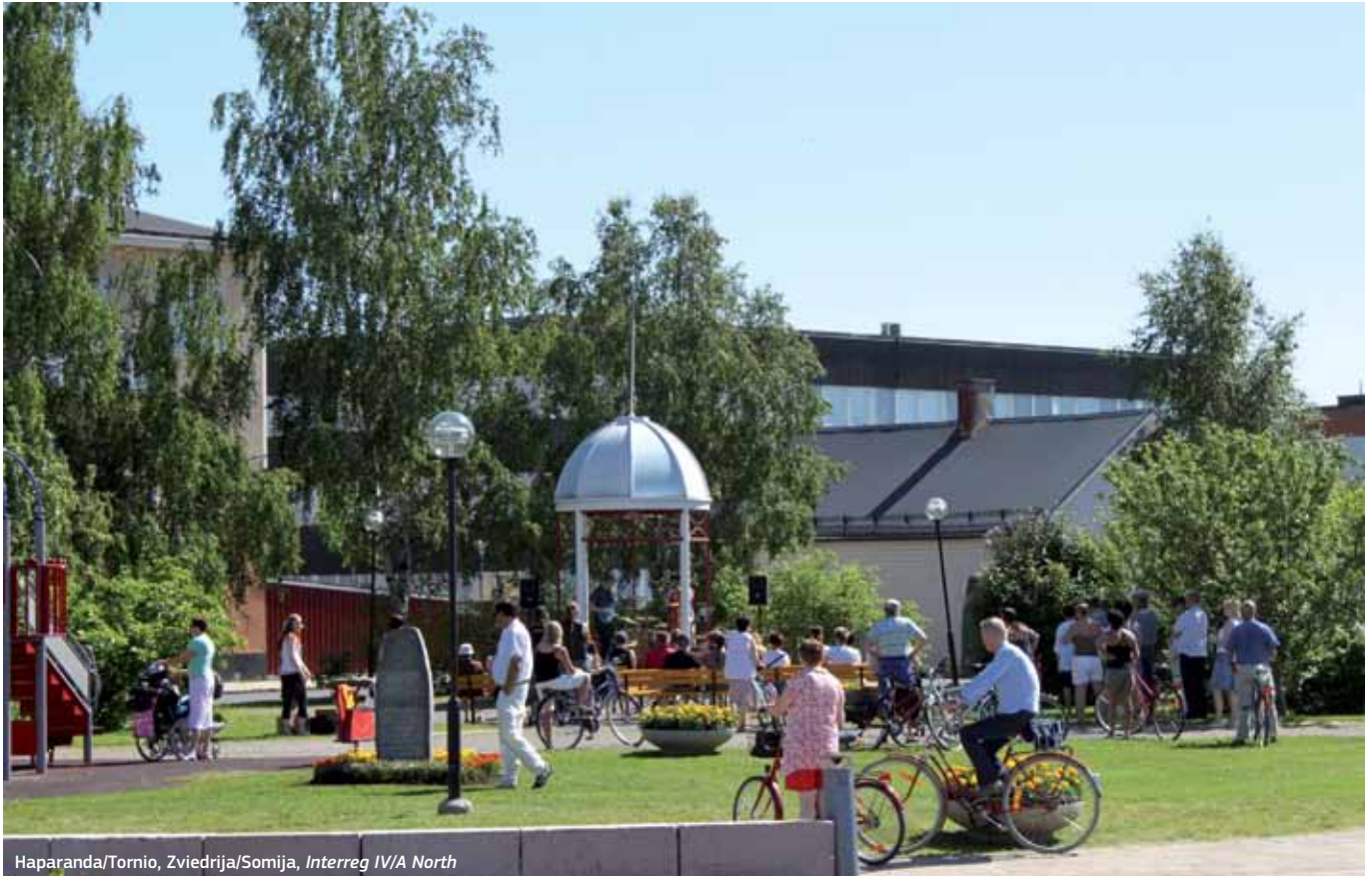
Haparanda/Tornio, Zviedrija/Somija, Interreg IV/A North

80 % programos finansavimo turi būti sutelkta į keturis teminius tikslus, kaip iš pradžių siūlė Komisija, tačiau likę 20% gali būti naudojami bet kuriems kitiems sąraše esantiems tikslams. Konkretios diskusijos su valstybėmis narėmis apie ETB reglamento nuostatas prasidėjo Kipro prezidentavimo ES laikotarpiu.