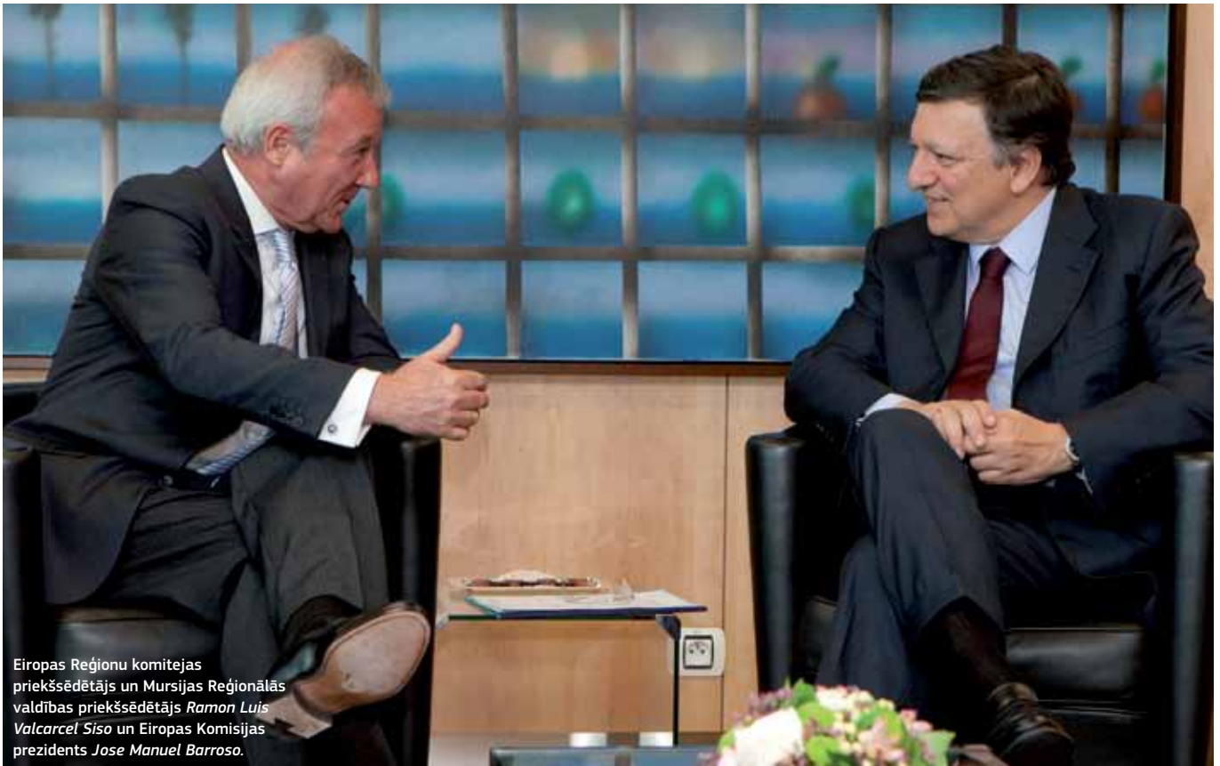
Eiropas Reģionu komitejas priekšsēdētājs un Mursijas Reģionālās valdības priekšsēdētājs Ramon Luis Valcarcel Siso un Eiropas Komisijas prezidents Jose Manuel Barroso .