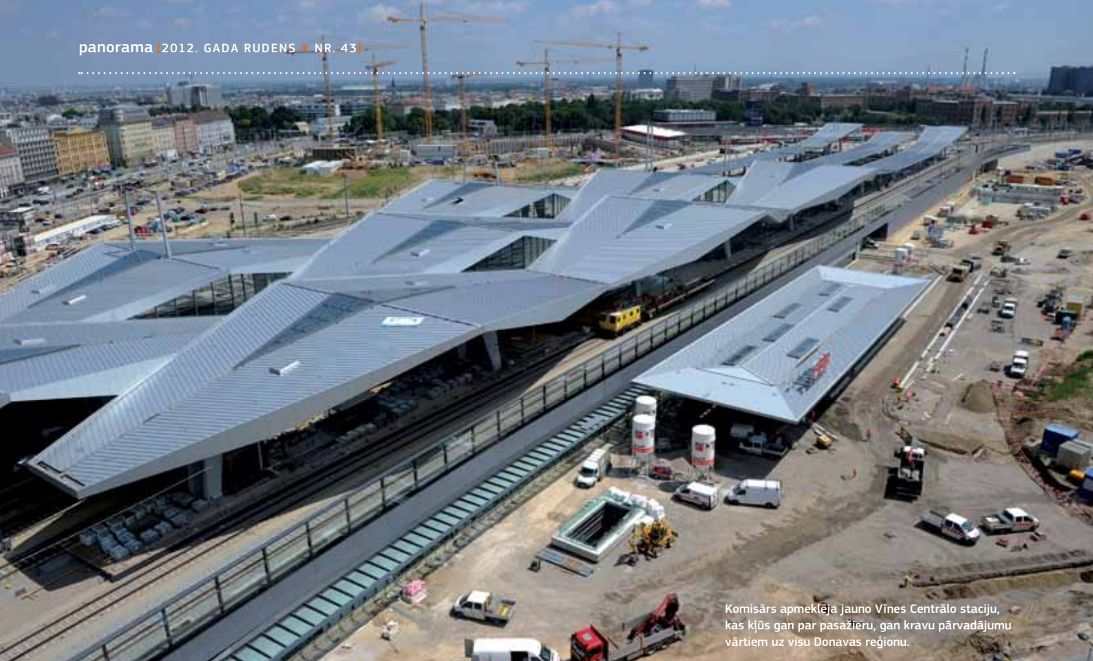
Komisārs apmeklēja jauno Vīnes Centrālo staciju, kas kļūs gan par pasažieru, gan kravu pārvadājumu vārtiem uz visu Donavas reģionu.