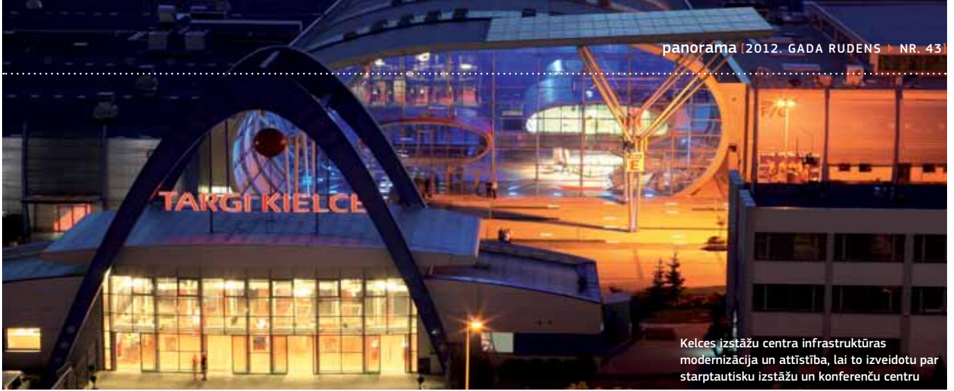
Kelces izstāžu centra infrastruktūras modernizācija un attīstība, lai to izveidotu par starptautisku izstāžu un konferenču centru

kapitālu, energodrošību un vidi. Pārrunu sākumpunktā par ES līdzekļiem 2014.-2020. gadam netiek pārrunātas tikai atšķirības; tiek runāts arī par uzdevumiem, kas jārisina, kā arī visefektīvāko intervences apmēru un veidu. Lai rastu pareizos risinājumus, Reģionālās attīstības ministrija rīko profesionāļu diskusijas par dažādiem turpmākās kohēzijas politikas tematiskajiem uzdevumiem, kā arī tiekas ar galvenajām iesaistītajām personām, piemēram, ministriju, pilsētu, reģionu, uzņēmumu pārstāvjiem, sociālajiem un ekonomiskajiem partneriem; tiek arī rīkotas speciālas Valsts teritoriālā foruma sesijas.