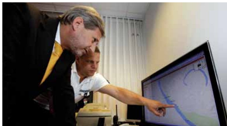
Kitas komisaro J. Hahn aplankytas projektas buvo integruotoji upės Šengeno siena, einanti tarp Vengrijos ir Kroatijos ties Mohács uostu, kur vienoje vietoje teikiamos visos paslaugos naudojant naujausią dalijimosi informacija technologiją, taip gerinamas judumas ir prekyba, kartu stiprinant saugą.