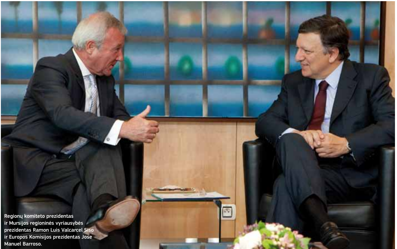
Regionų komiteto prezidentas ir Mursijos regioninės vyriausybės prezidentas Ramon Luis Valcarcel Siso ir Europos Komisijos prezidentas Jose Manuel Barroso.