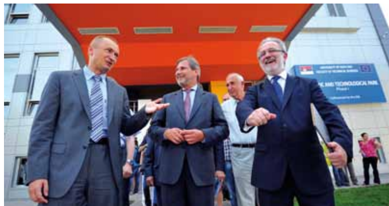
Komisaras J. Hahn aplankė verslo inkubatoriaus ir mokslo parko projektus Osijek (Kroatija) (atvaizduota) bei Novi Sad (Serbijoje), kuriuos įgyvendinant buvo susieti tyrimai, inovacijos ir įmonės.