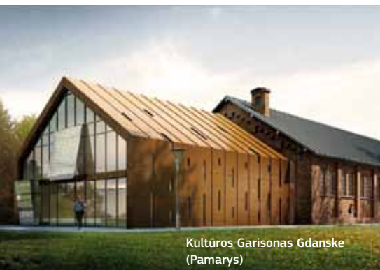
Kultūros Garisonas Gdanske (Pamarys)

Vaizdas pagrįstas architektūrine koncepcija; pastatas vis dar kuriamas.