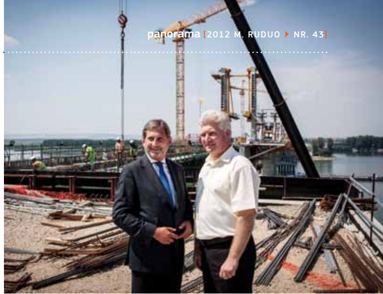
Iki 1212 m. pabaigos bus baigtas Vidin-Calafat tiltas tarp Bulgarijos ir Rumunijos ir dalis transeuropinio transporto tinklo, kuris pagerins susisiekimą tarp šiaurės vakarų Bulgarijos, pietvakarių Rumunijos ir rytų Vengrijos.

2012 m. lapkričio mėn. Komisija kartus su Bavarijos institucijomis organizuoja pirmąjį metinį strategijos forumą, kuriame bus pateiktos tolesnės galimybės tęsti pradėtą darbą, parodyti pridėtinę strategijos vertę, didinti visuomenės suvokimą ir geriau planuoti ateities veiksmus. Laukiame pasiūlymų ir idėjų iš visų suinteresuotųjų šalių.