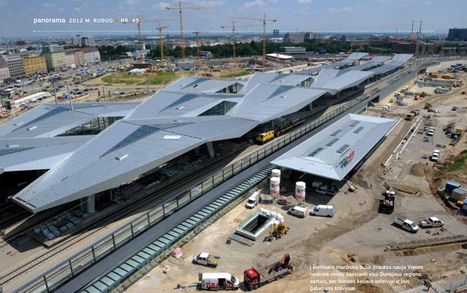
[ komisaro maršrutą buvo įtraukta nauja Vienos centrinė stotis, tapsianti viso Dunojaus regiono vartais, per kuriuos keliaus keleiviai ir bus gabenami kroviniai.