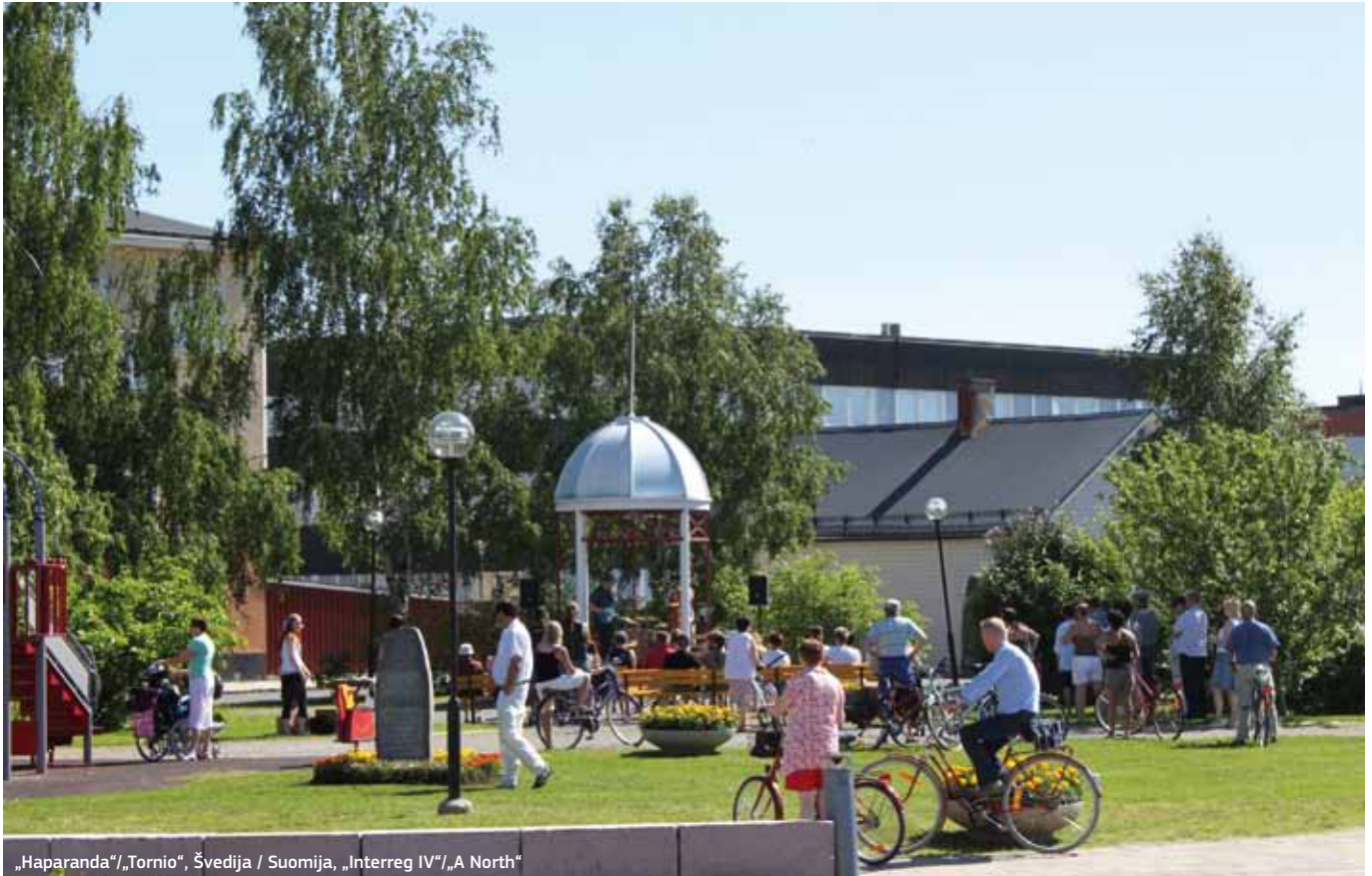
„Haparanda“/„Tornio“, Švedija / Suomija, „Interreg IV“/„A North“

20% gali būti naudojami bet kuriems kitiems sąraše esantiems tikslams. Konkrečios diskusijos su valstybėmis narėmis apie ETB reglamento nuostatas prasidėjo Kipro prezidentavimo ES laikotarpiu.