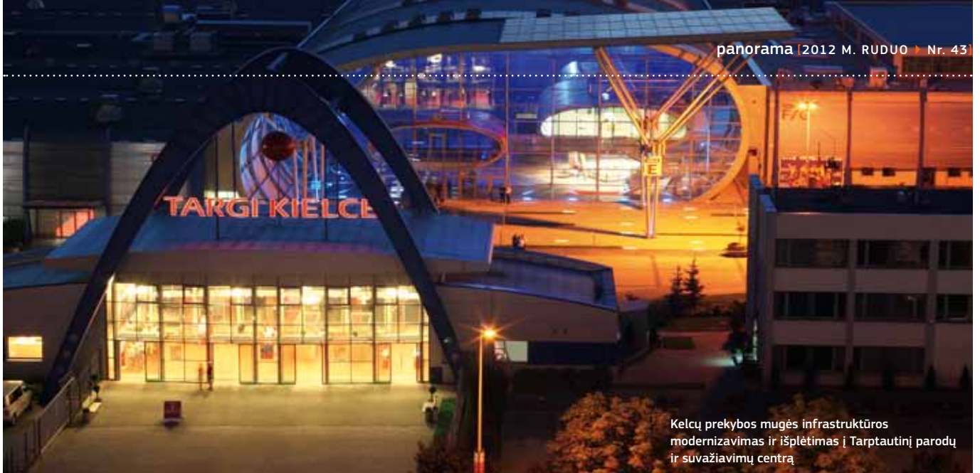
Kelcų prekybos mugės infrastruktūros modernizavimas ir išplėtimas | Tarptautinį parodų ir suvažiavimų centrą

ir potencialas, kurį reikia išnaudoti, bei efektyviausia paramos apimtis ir forma. Norėdama rasti teisingus atsakymus, Regioninės plėtros ministerija organizuoja ekspertų debatus įvairiomis būsimos sanglaudos politikos tikslų temomis ir susitikimus su pagrindiniais veikėjais, pvz., ministerijų, miestų, regionų ir įmonių atstovais, socialiniais ir ekonominiais partneriais, įskaitant skirtąsias Nacionalinio teritorinio forumo sesijas.