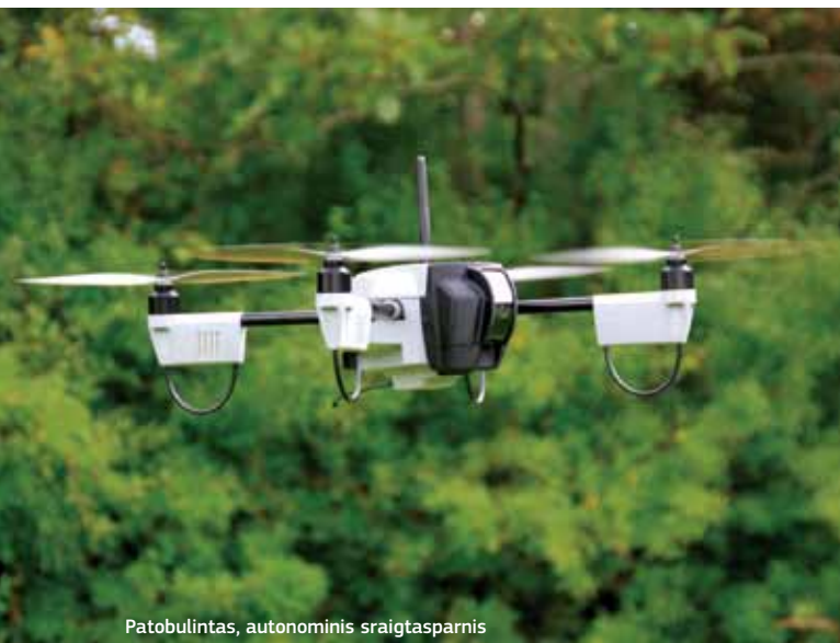
Patobulintas, autonominis sraigatasparnis

Regioninės politikos direktorius, Danijos verslo institucija