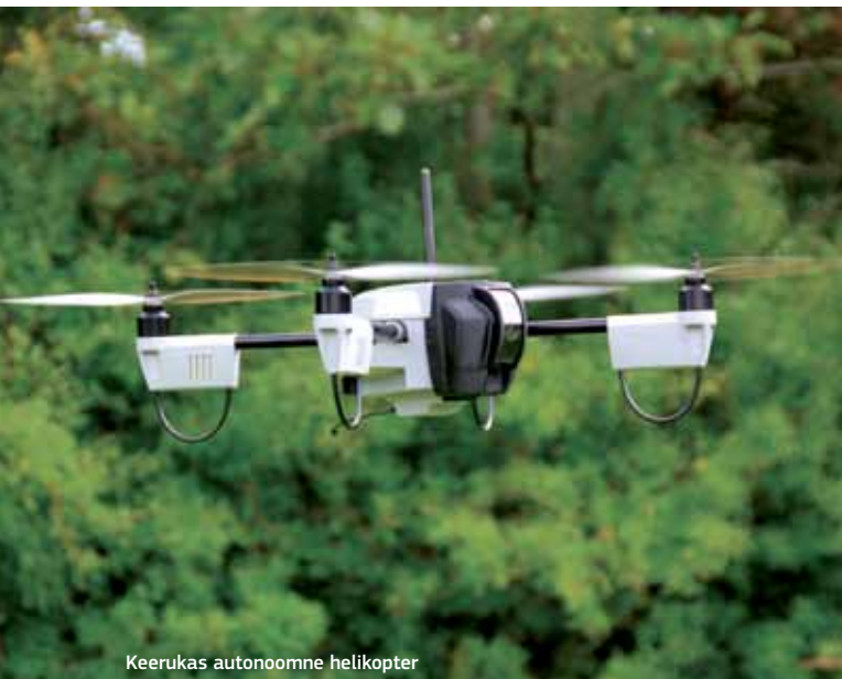
Keerukas autonoomne helikopter

Taani projektid toetavad arengut läbi partnerluse. Otsetoetused konkreetsetele äriinvesteeringutele on haruldased. Tüüpiline regionaalfondi projekti näide on Ålborgi Ülikooli rahvusvaheline keskus. Teadmisi kogutakse ettevõtelt läbi ettevõtete võrgustiku, et võimaldada firmadel paremini uusi, raskesti kopeeritavaid ärimudeleid luua. Üks ettevõtte on arendanud luure-eesmärkidel näiteks keeruka, autonoomse helikopteri ( drone ).