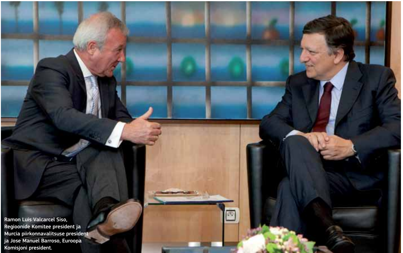
Ramon Luis Valcarcel Siso, Regioonide Komitee president ja Murcia piirkonnavalitsuse president ja Jose Manuel Barroso, Euroopa Komisjoni president.