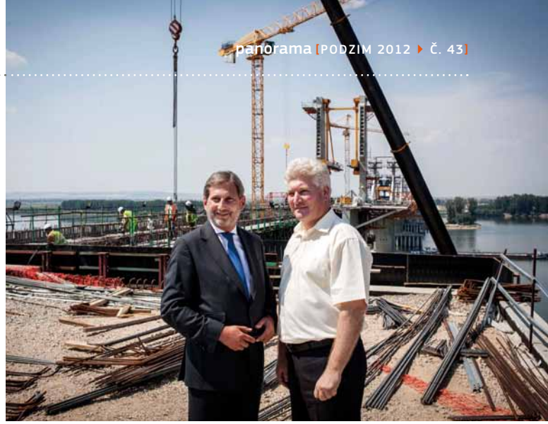
Most Vidin-Calafat mezi Bulharskem a Rumunskem, jehož dokončení je plánováno na konec roku 2012, a část transevropské dopravní sítě, která podpoří spojení mezi severozápadním Bulharskem, jihozápadním Rumunskem a východním Maďarskem.

V listopadu 2012 Komise ve spolupráci s bavorskými úřady uspořádá první výroční fórum o strategii, které poskytne další příležitost zrekapitulovat odvedenou práci, ukázat přínos strategie, zvýšit informovanost veřejnosti a vylepšit plány do budoucna. Těšíme se na návrhy a nápady všech zainteresovaných subjektů.