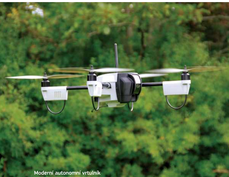
Moderní autonomní vrtulník

Strategické zaměření v dánských programech se ukázalo jako odolné, například ve vztahu k finanční krizi. Dánsko chce tuto tematickou koncentraci zachovat a je možné, že budou Dánové chtít pokročit ještě dál, než se aktuálně očekává. Rozdělování prostředků k předem stanoveným účelům může působit potíže přijímající zemi s méně programy nebo menšími programy, pokud se tyto iniciativy musejí také soustředit na ty oblasti, v nichž podle zjištění nejvíce chybějí.