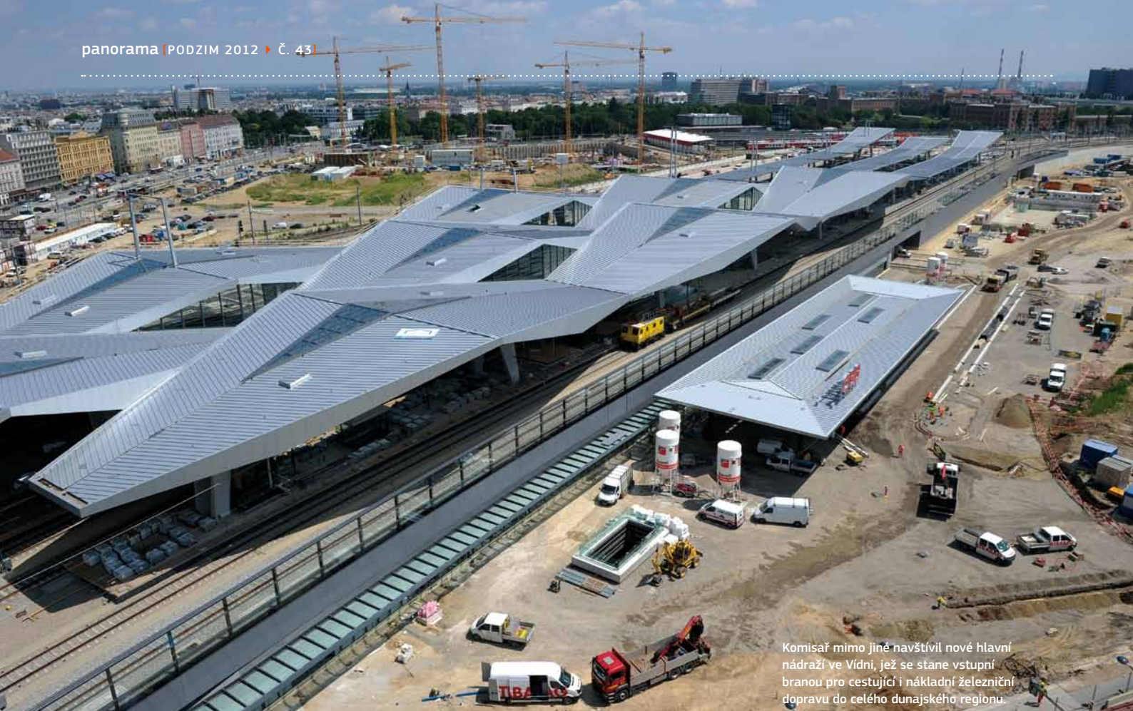
Komisař mimo jiné navštívil nové hlavní nádraží ve Vídni, jež se stane vstupní branou pro cestující i nákladní železniční dopravu do celého dunajského regionu.