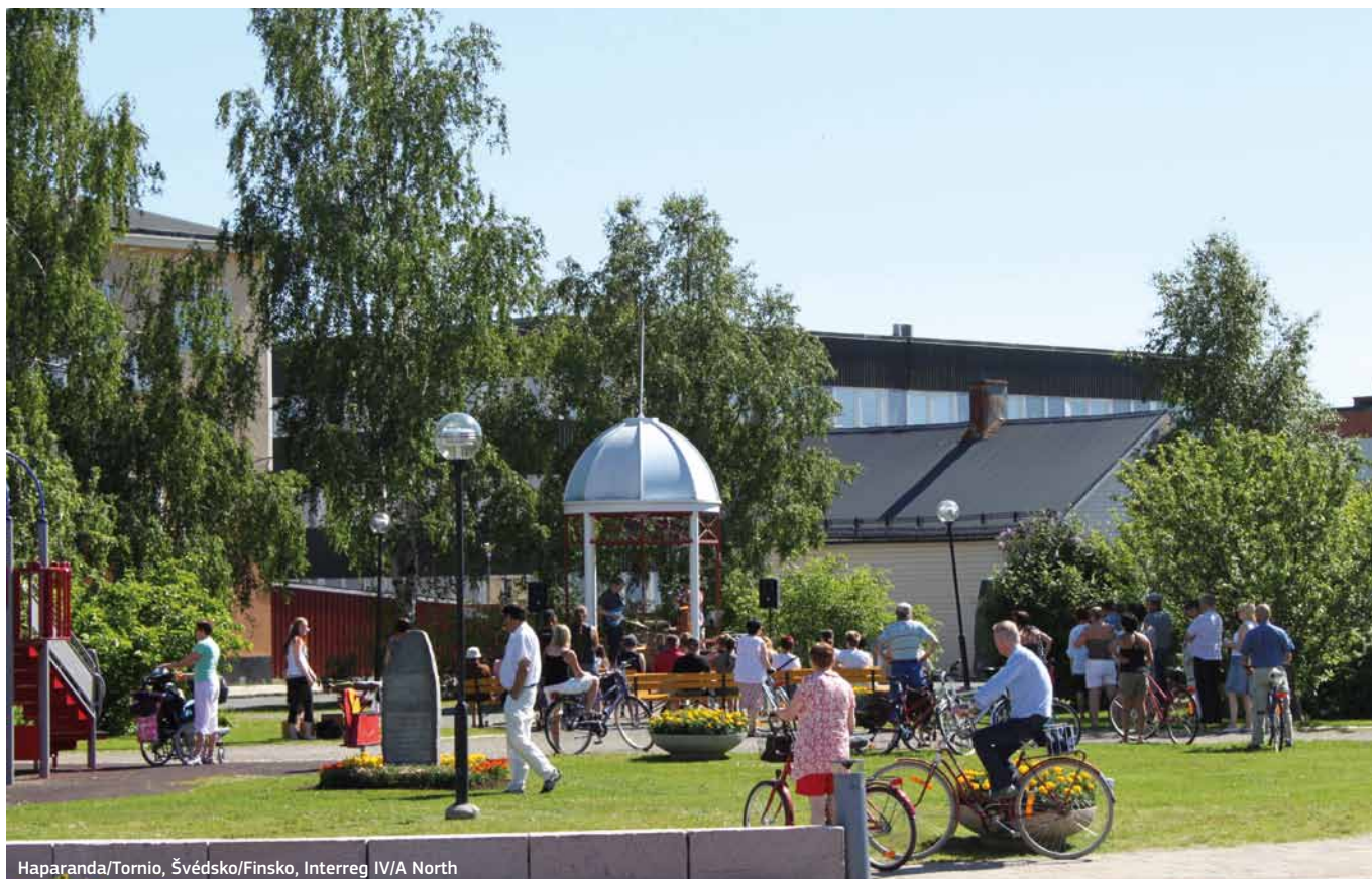
Haparanda/Tornio, Švédsko/Finsko, Interreg IV/A North

s volbou tematických cílů pro programy spolupráce uplatňovala poněkud méně striktní pravidla: 80% dotací na programy by podle ní mělo být v souladu s původním návrhem Komise využito na plnění čtyř stanovených tematických cílů, zbývajících 20% by ale mělo být k dispozici na aktivity týkající se kterýchkoli jiných tematických cílů ze seznamu. Konkrétní rozhovory s členskými státy ohledně ustanovení nařízení o EÚS byly zahájeny v období kyperského předsednictví EU.