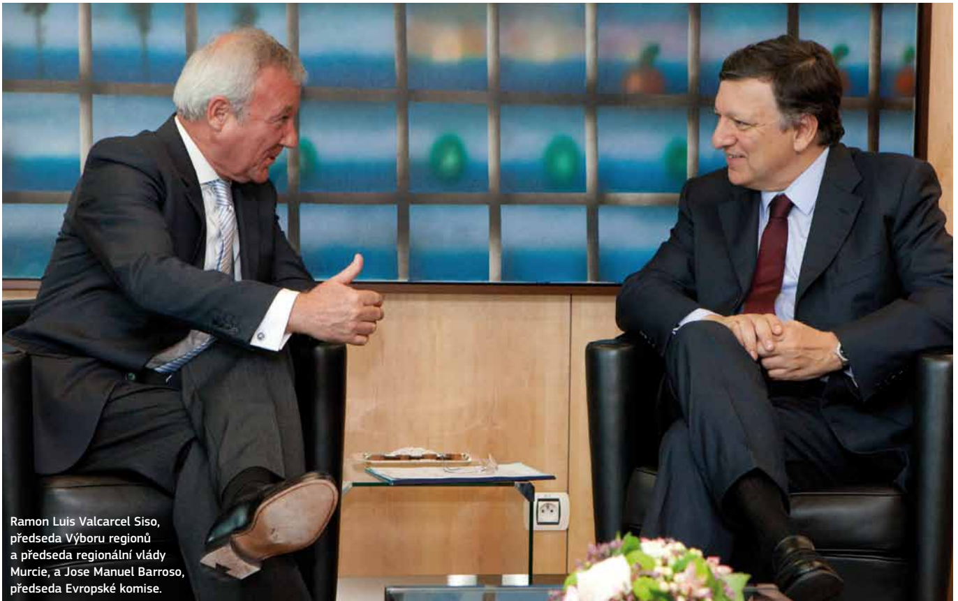
Ramon Luis Valcarcel Siso, předseda Výboru regionů a předseda regionální vlády Murcie, a Jose Manuel Barroso, předseda Evropské komise.