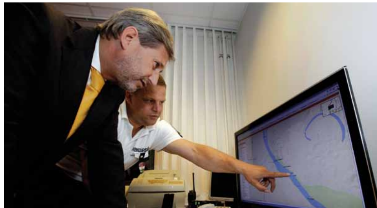
Další zastávkou komisaře Hahna byl integrovaný říční hraniční přechod schengenského prostoru u přístavu Moháč mezi Maďarskem a Chorvatskem, kde mají všechny služby k dispozici přístup k nejmodernějším technologiím ke sdílení informací pod jednou střešou, což usnadňuje mobilitu a obchodování a současně napomáhá posílit bezpečnost.