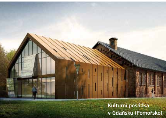
Kulturní posádka v Gdaňsku (Pomořsko)

Bank Gospodarstwa Krajowego, jediná 100% státní rozvojová banka v Polsku, působí jako Fond pro rozvoj měst ve dvou regionech – Velkopolsku a Pomořsku. Fond Wielkopolska UDF se zaměřuje na revitalizaci a podporu obchodního prostředí. Provozní smlouva byla podepsána v září 2010 a od té doby fond přijal 26 žádostí o půjčku v celkové výši 59 milionů euro a uzavřel 6 investičních smluv celkem na 23,2 milionů euro (právě byl schválen další projekt v hodnotě přibližně 1,5 milionu euro a brzy bude podepsána investiční smlouva). Mezi podporovanými projekty je například renovace starých nebo historických budov, které mají sloužit mimo jiné jako podnikové inkubátory a kulturní střediska.