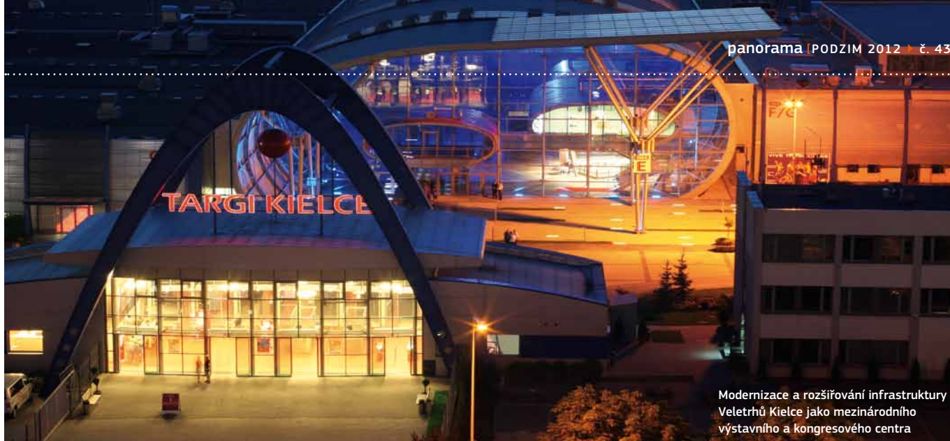
Modernizace a rozšiřování infrastruktury Veletrhů Kielce jako mezinárodního výstavního a kongresového centra

a životního prostředí. Výchozím tématem diskuzí o využití financí EU v období 2014–2020 nejsou jen slabá místa, ale také potenciál a neefektivnější rozsah a forma intervence. Ministerstvo pro regionální rozvoj ve snaze najít správné odpovědi organizuje jak diskuze odborníků zaměřené na různé tematické cíle budoucí politiky soudržnosti, tak setkání klíčových aktérů, jakými jsou představitelé ministerstev, měst, regionů a podniků, sociální a ekonomičtí partneři a rovněž i specializovaná zasedání Národního teritoriálního fóra.