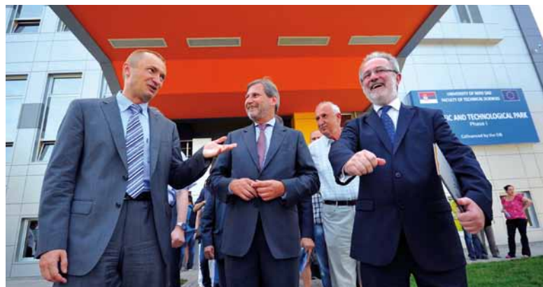
Komisař Hahn navštívil projekty podnikového inkubátoru a vědeckého parku ve městech Osijek (Chorvatsko) (na obrázku) a Novi Sad (Srbsko), v nichž dochází k propojení výzkumu, inovací a podniků.