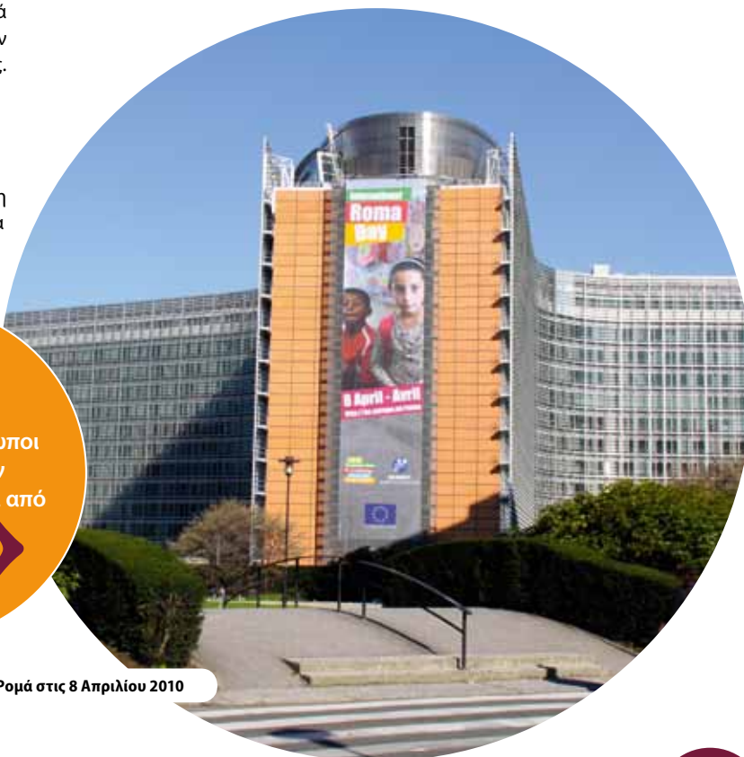
Η ΕΕ γιορτάζει την Παγκόσμια Ημέρα των Ρομά στις 8 Απριλίου 2010

http://ec.europa.eu/employment_social/esf/index_el.htm