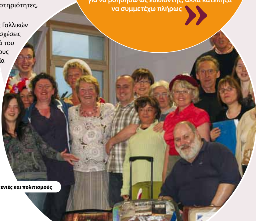
Η παραστασιακή τέχνη γεφυρώνει γενιές και πολιτισμούς

« Το πρόγραμμα μού πρόσφερε πολύτιμες δεξιότητες στην τέχνη και το σχέδιο, όπως η δημιουργία μιας μουσειοβαλίτσας! Συμμετέχω επίσης και σε πολλές άλλες δραστηριότητες – πληροφορική υποστήριξη, διπλωματία, τρέξιμο, ντραμς. Ήταν υπέροχα και μου δημιούργησε την επιθυμία να βρισκομαι στο προσκήνιο! Ξεκίνησα για να βοηθήσω ως εθελοντής, αλλά κατέληξα να συμμετέχω πλήρως »