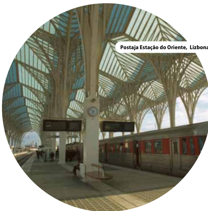
Postaja Estação do Oriente, Lizbona, Portugalska

” Celovit pristop predstavlja izziv tudi za izvajalce na terenu “