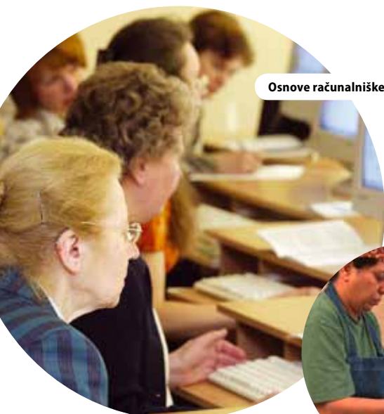
Osnove računalniškega opismenjevanja za e-državljana Litve, Litva