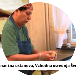
Mikro finančna ustanova, Vzhodna osrednja Švedska