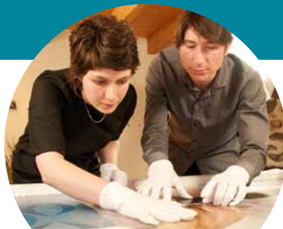
Visokohitrostna širokopasovna povezava v Auvergnu, Francija

Video posnetki so na voljo na http://ec.europa.eu/regional_policy/sources/video/regiostars2010/genk_fr.wmv