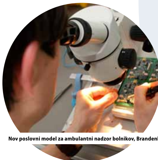
Nov poslovni model za ambulantni nadzor bolnikov, Brandenburg, Nemčija