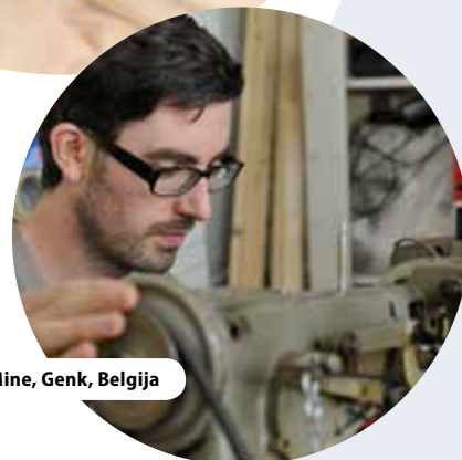
Center C-Mine, Genk, Belgija