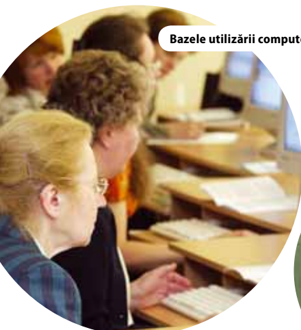
Bazele utilizării computerului pentru formarea e cetățenilor în Lituania