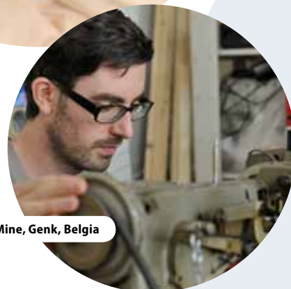
Centrul C-Mine, Genk, Belgia