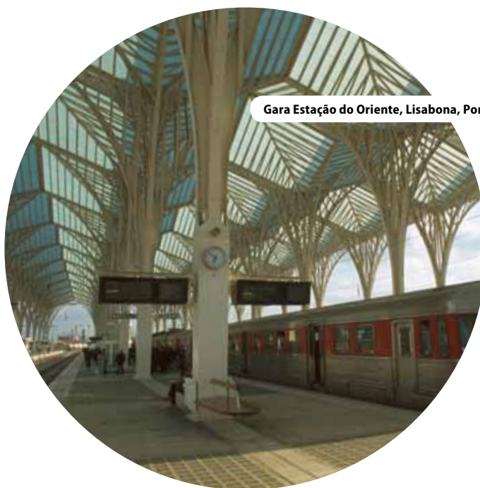
Gara Estação do Oriente, Lisabona, Portugalia