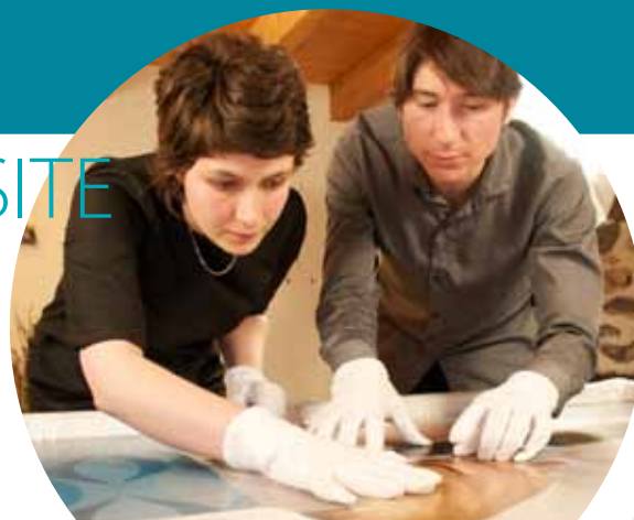
Internet de mare viteză în Auvergne, Franța

http://ec.europa.eu/regional_policy/sources/video/regiostars2010/genk_fr.wmv