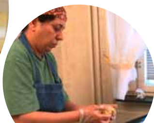
Institutul de Microfinanțare din regiunea central-estică a Suediei