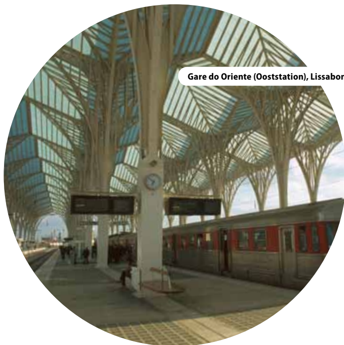
Gare do Oriente (Ooststation), Lissabon, Portugal

“ ... een geïntegreerde aanpak vormt ook een uitdaging voor wie op het terrein werkt. ”