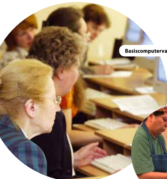
Basiscomputervaardigheden voor een Litouwse e-burger, Litouwen