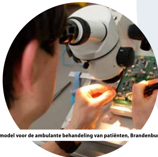
Nieuw bedrijfsmodel voor de ambulante behandeling van patiënten, Brandenburg, Duitsland