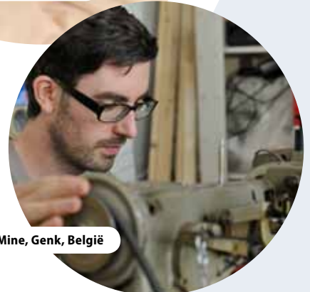
C-Mine, Genk, België