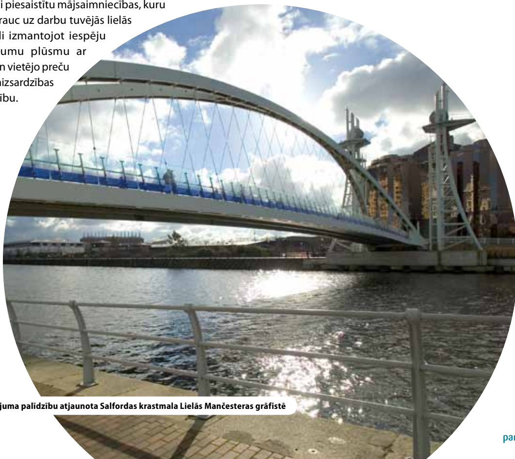
Ar reģionālā finansējuma palīdzību atjaunota Salfordas krastmala Lielās Mančesteras grāfistē

Lielisks piemērs ir Mančesteras austrumu rajons. Izzūdot pamatīgajam rūpnieciskajam pamatam, šis rajons panīka. Tomēr virkne valdības finansētu iniciatīvu, ko pilsēta daudzu gadu garumā mērķtiecīgi īstenoja šajā rajonā, ļāva tam apvienot resursus vienā veselumā, kaut arī naudas līdzekļus piešķīra no dažādām pārvaldības nodaļām. Rajons vēl joprojām cīnās ar grūtībām, taču tajā ir notikušas vēra ņemamas pārmaiņas. Tā panākumi slēpjas šādos aspektos: ilgtermiņa – neatlaidīga problēmu risināšana vairāku desmitu gadu garumā; mērogs – teritorijai vairāk nekā 1000 hektāru platībā ir lielāka politiska ietekme; sabiedrības iesaistīšanās – sākotnējā programma tika plaši apspriesta vietējā līmenī un piesaistīja sabiedrību; apņemšanās – nemainīgs kompetentu darbinieku loks; konkurētspēja – vienlaicīga darba tirgus, izglītības, mājokļu, veselības aizsardzības un noziedzības apkarošanas jautājumu risināšana.