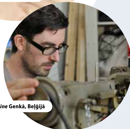
Centrs C-Mine Genkā, Beļģijā