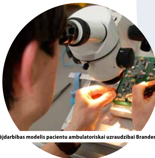
Jauns uzņēmējdarbības modelis pacientu ambulatoriskai uzraudzībai Brandenburgā, Vācijā