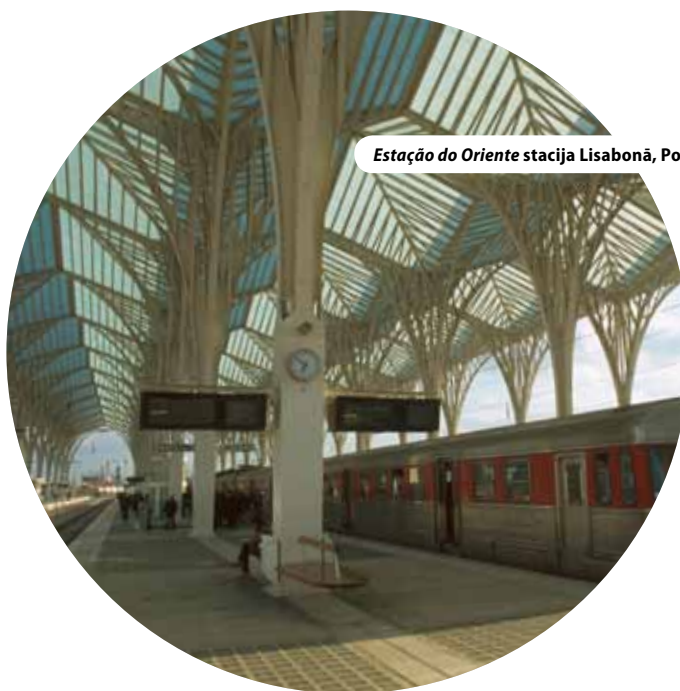
Estação do Oriente stacija Lisabonā, Portugālē

«...integrētas pieejas problēmjautājumi jārisina arī tiem, kuri to īsteno praksē.» »