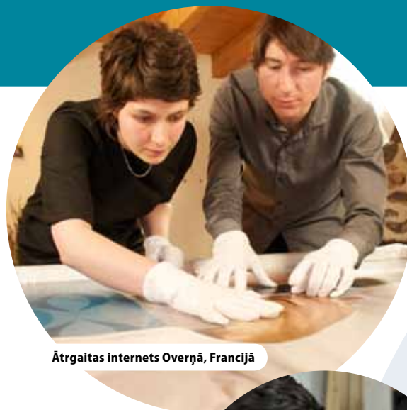
Ātrgaitas internets Overņā, Francijā

Videomateriāli pieejami tīmekļa vietnē http://ec.europa.eu/regional_policy/sources/video/regiostars2010/genk_fr.wmv