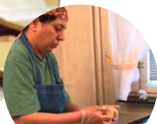
Mikrofinansēšanas institūts Zviedrijas vidienes austrumdaļā