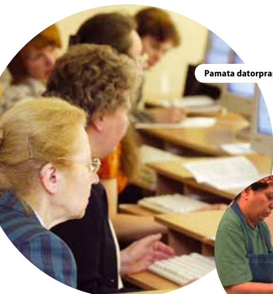
Pamata datorprasmju uzlabošanas pasākumi Lietuvas e-iedzīvotājiem, Lietuva