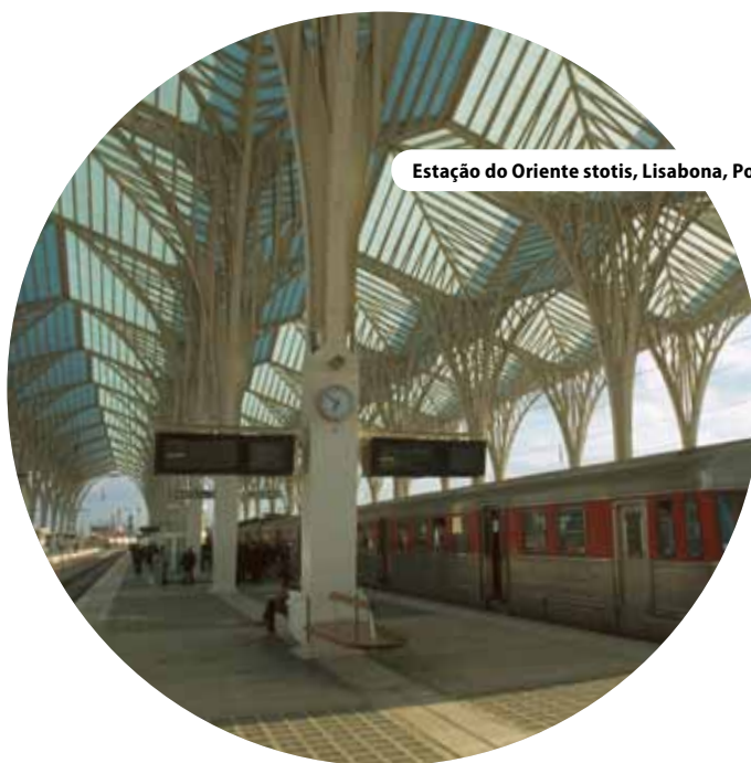
Estação do Oriente stotis, Lisabona, Portugalija

« ...Integruotas požiūris taip pat sukelia iššūkių tiems, kas dirba vietoje »