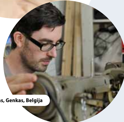
„C-Mine“ centras, Genkas, Belgija