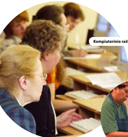
Kompiuterinio raštingumo pagrindai Lietuvos e-piliečiams, Lietuva