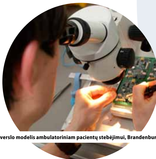
Naujas verslo modelis ambulatoriniam pacientų stebėjimui, Brandenburgas, Vokietija