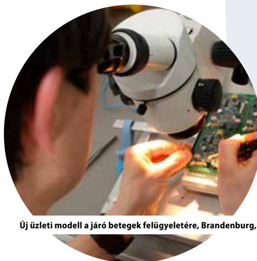
Új üzleti modell a járó betegek felügyeletére, Brandenburg, Németország