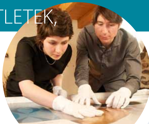
Nagysebességű szélessávú kapcsolat a franciaországi Auvergne-ben

http://ec.europa.eu/regional_policy/sources/video/regiostars2010/genk_fr.wmv