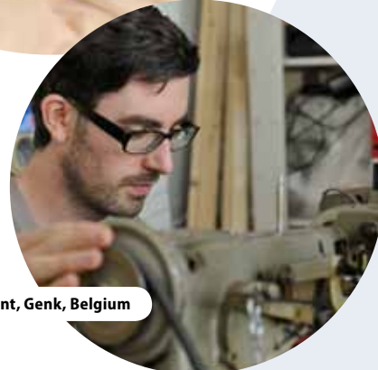
C-Mine Központ, Genk, Belgium