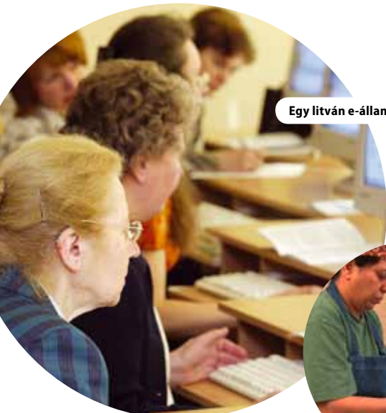
Egy litván e-állampolgár elsajátítja a számítógépes írástudás alapjait, Litvánia