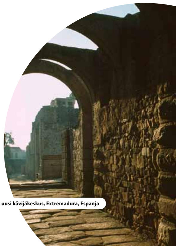
Méridan roomalaistatterin uusi kävijäkeskus, Extremadura, Espanja