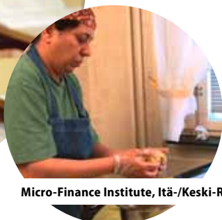
Micro-Finance Institute, Itä-/Keski-Ruotsi