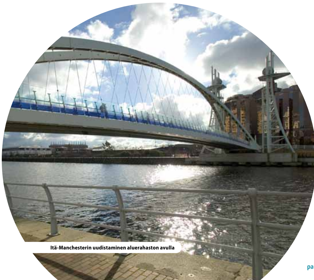
Itä-Manchesterin uudistaminen aluerahaston avulla

Yhdentyneellä talous- ja aluestrategialla varmistetaan painopisteiden toteutuminen.