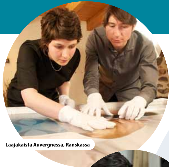
Laajakaista Auvergnessa, Ranskassa

http://ec.europa.eu/regional_policy/sources/video/regiostars2010/genk_fr.wmv