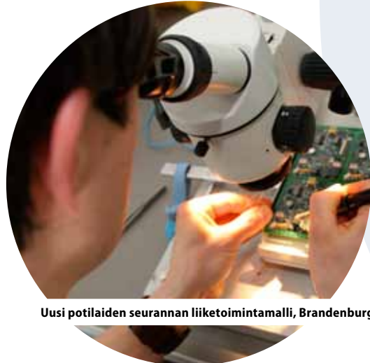
Uusi potilaiden seurannan liiketoimintamalli, Brandenburg, Saksa