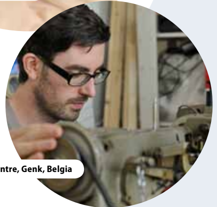
C-Mine Centre, Genk, Belgia