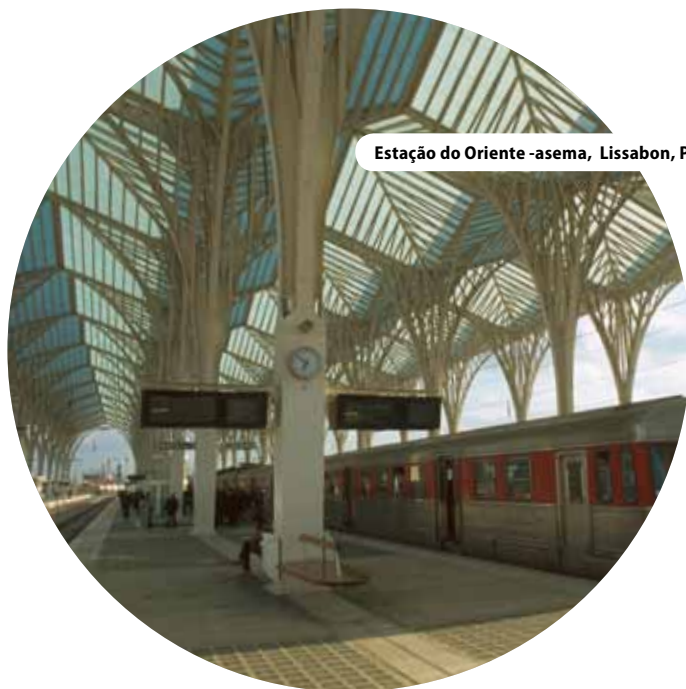
Estação do Oriente -asema, Lissabon, Portugali

« Yhdenmukainen lähestymistapa asettaa haasteita käytännön työlle. »