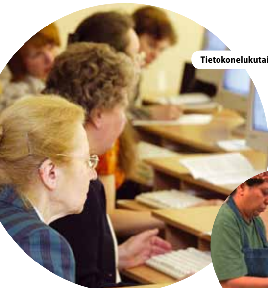
Tietokonekukutaito ja Liettuan e-kansalaisuus, Liettua