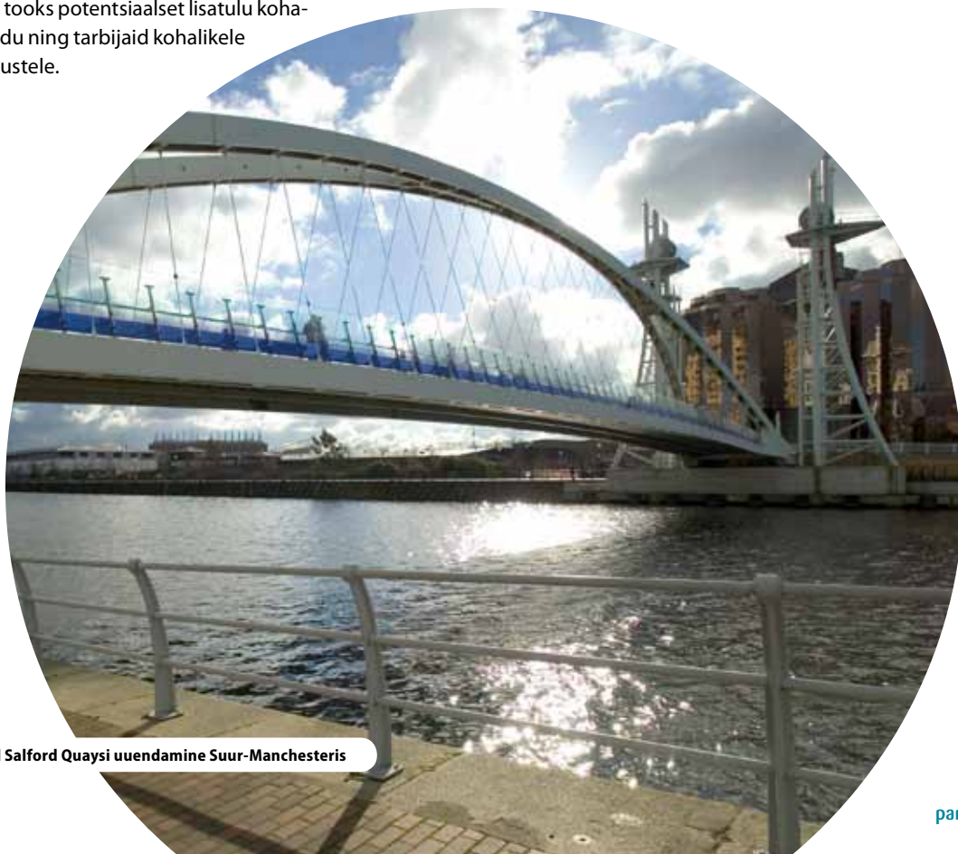
Regionaalfondide abil Salford Quaysi uuendamine Suur-Manchesteris

Ida-Manchester on selliseks suurepäraseks näiteks. Rasketööstuse kadumine põhjustas piirkonna vaesumise, aga rida valitsuse rahastatud algatusi, mille linn suunas mitmeid aastaid teadlikult sellesse piirkonda, võimaldasid seal luua praktiliselt ühtse ressursikogumi, kuigi rahavood pärinesid erinevatest valdkondadest. Piirkonnal on endiselt mitmeid probleeme, kuid on ka tehtud märkimisväärsed edusamme. Imeväega komponendid on: kestvus, kuna probleemidega tegeletakse järjekindlalt aastakümneid; mõõtkava, kuna piirkonna enam kui 100-hektariline pindala võimaldab selle poliitilist tähtsust; kogukonna osalus – algses programmis kohaliku arvamusega tõeliselt arvestamine; järjekindlus tänu võimekatele, püsivatele töötajatele; mitmekülgsus, tegeledes üheaegselt tööhõive, koolituse, elamumajanduse, tervishoiu ja kuritegevuse küsimustega.