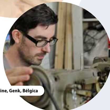
Centro C-Mine, Genk, Bélgica