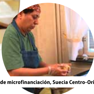
Instituto de microfinanciación, Suecia Centro-Oriental