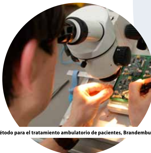
Nuevo método para el tratamiento ambulatorio de pacientes, Brandemburgo, Alemania