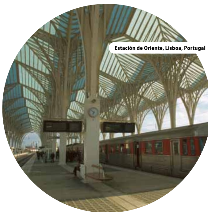
Estación de Oriente, Lisboa, Portugal

« El enfoque integrado supone también un desafío para quienes trabajan sobre el terreno »