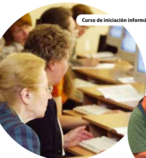
Curso de iniciación informática para ciudadanos lituanos, Lituania