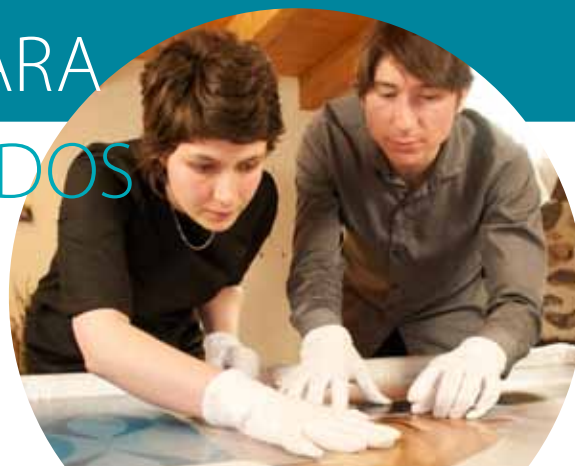
Banda ancha de alta velocidad en Auvernia, Francia

http://ec.europa.eu/regional_policy/sources/video/regiostars2010/genk_fr.wmv