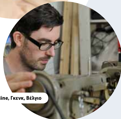
Κέντρο C-Mine, Γκενκ, Βέλγιο