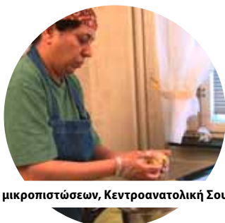
Ινστιτούτο χορήγησης μικροπιστώσεων, Κεντροανατολική Σουηδία