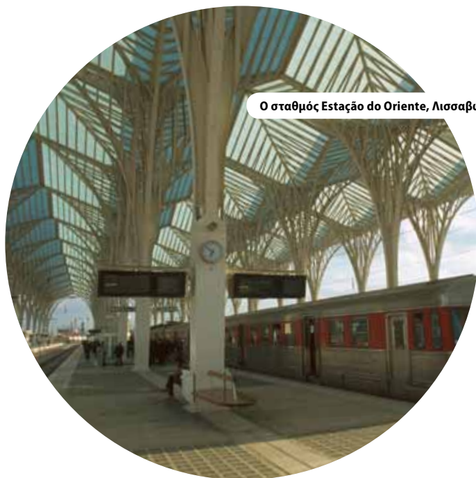
Ο σταθμός Estação do Oriente, Λισσαβόνα, Πορτογαλία

«... η ολοκληρωμένη προσέγγιση παρουσιάζει επίσης προκλήσεις για τους τοπικούς φορείς»