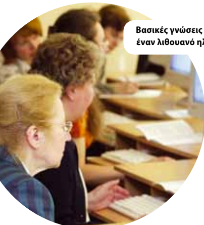
Βασικές γνώσεις χειρισμού ηλεκτρονικού υπολογιστή για έναν λιθουανό ηλεκτρονικό πολίτη, Λιθουανία