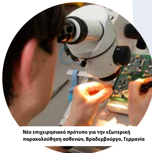
Νέο επιχειρησιακό πρότυπο για την εξωτερική παρακολούθηση ασθενών, Βραδεμβούργο, Γερμανία