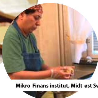
Mikro-Finans institut, Midt-øst Sverige