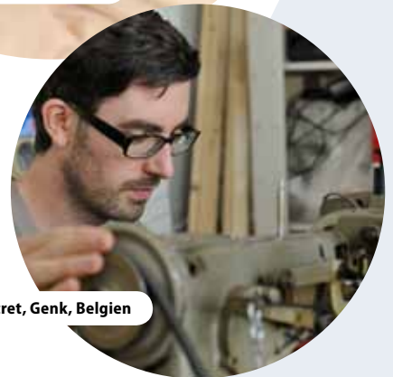
C-Mine Centret, Genk, Belgien