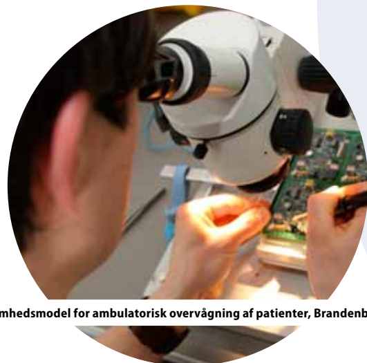
Ny virksomhedsmodel for ambulatorisk overvågning af patienter, Brandenburg, Tyskland