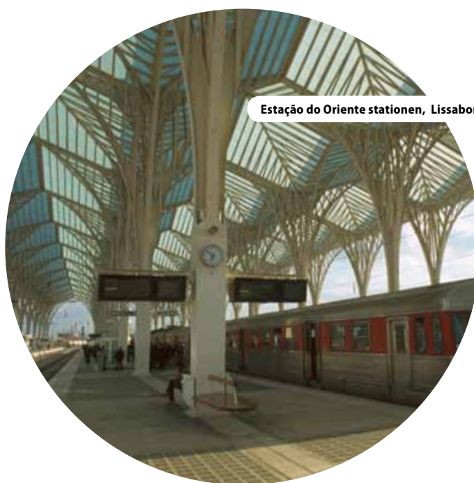
Estação do Oriente stationen, Lissabon, Portugal

integreret tilgang giver også udfordringer for dem der arbejder på stedet