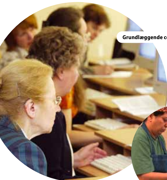
Grundlæggende computerkendskab for en litauisk e-borger, Litauen