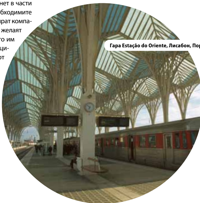
Гапа Estação do Oriente, Лисабон, Португалия

Местните стратегии не трябва да се формулират изолирано, а трябва да се обърне внимание на стратегии, които са приложени в други области, например в съседни региони. В това отношение европейската политика на сближаване има опит в подпомагане на развитието на схеми за трансрегионална координация, които са необходимо помощно средство за регионите на ЕС по отношение на взаимното влияние и използването на техните взаимодействия. Казано на обикновен език един интегриран подход с координиране на действия в политически области може да постигне по-добри резултати от индивидуалните инициативи.