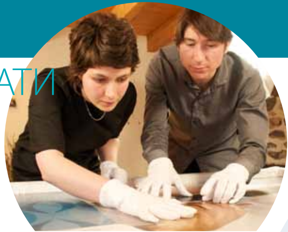
Високоскоростно широколентово покритие в Оверн, Франция

http://ec.europa.eu/regional_policy/sources/video/regiostars2010/genk_fr.wmv