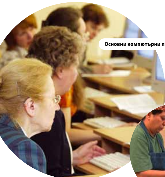
Основни компютърни познания за литовски електронен гражданин, Литва