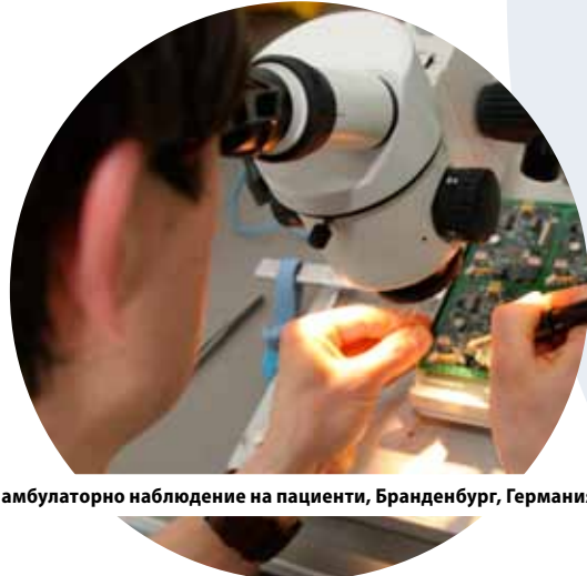
Нов бизнес модел за амбулаторно наблюдение на пациенти, Бранденбург, Германия