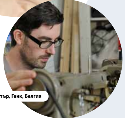
C-Mine център, Генк, Белгия