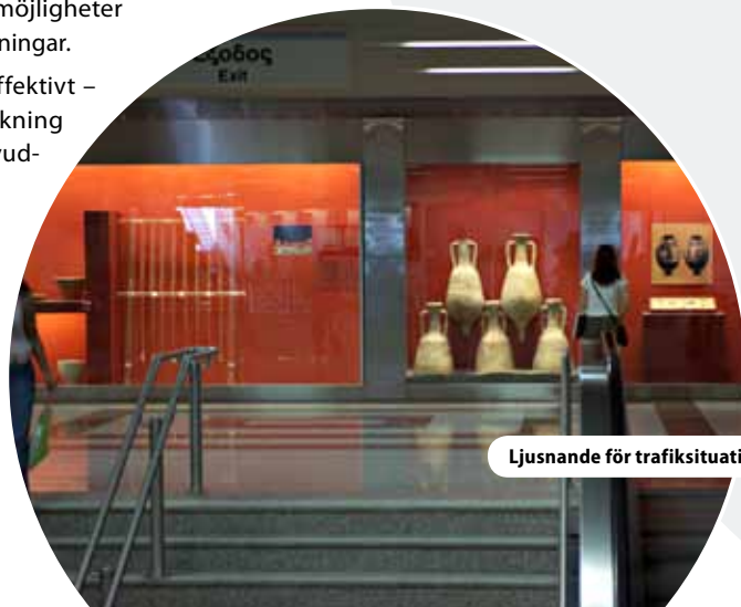
Ljusnande för trafiksituationen i Aten

http://www.ametro.gr/page/default.asp?id=4&la=2