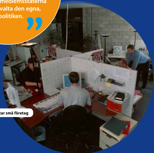
Stöttar små företag

Ja och nej. Det är uppenbart att bidragen måste vara tillräckligt stora för att göra skillnad, vilket innebär att de inte bör spridas ut för mycket över olika politikområden. Men eftersom regioner skiljer sig åt när det gäller de problem som de ställs inför, liksom specifika behov, vilka är svåra att se ur ett centralt perspektiv, kan det vara läge att låta dem välja ett begränsat antal områden att koncentrera medlen till. Detta skulle också göra det lättare att övervaka och utvärdera sammanhållningspolitiken.