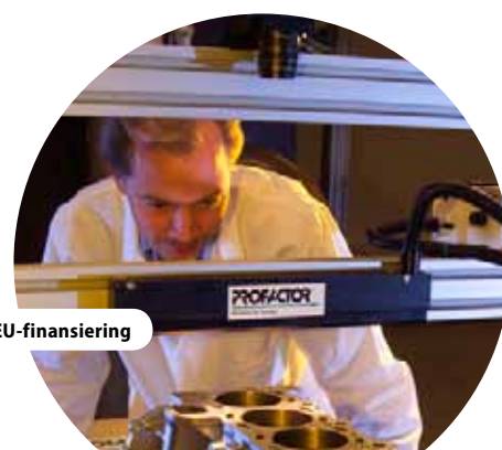
Profactor-projektet visade fördelarna med EU-finansiering

” Den långa erfarenheten av programövervakning i Tyskland utgör en stadig grund för de mer och mer omfattande indikatorerna som följs idag. ”