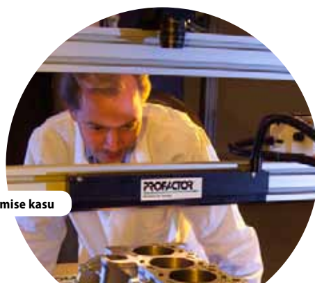
Profactori projekt näitas ELi-poolse rahastamise kasu

” Saksamaa pikaajaline programmide järelevalve kogemus annab kindla aluse praegu jälgitavatele järjest ulatuslikumatele näitajatele. ”