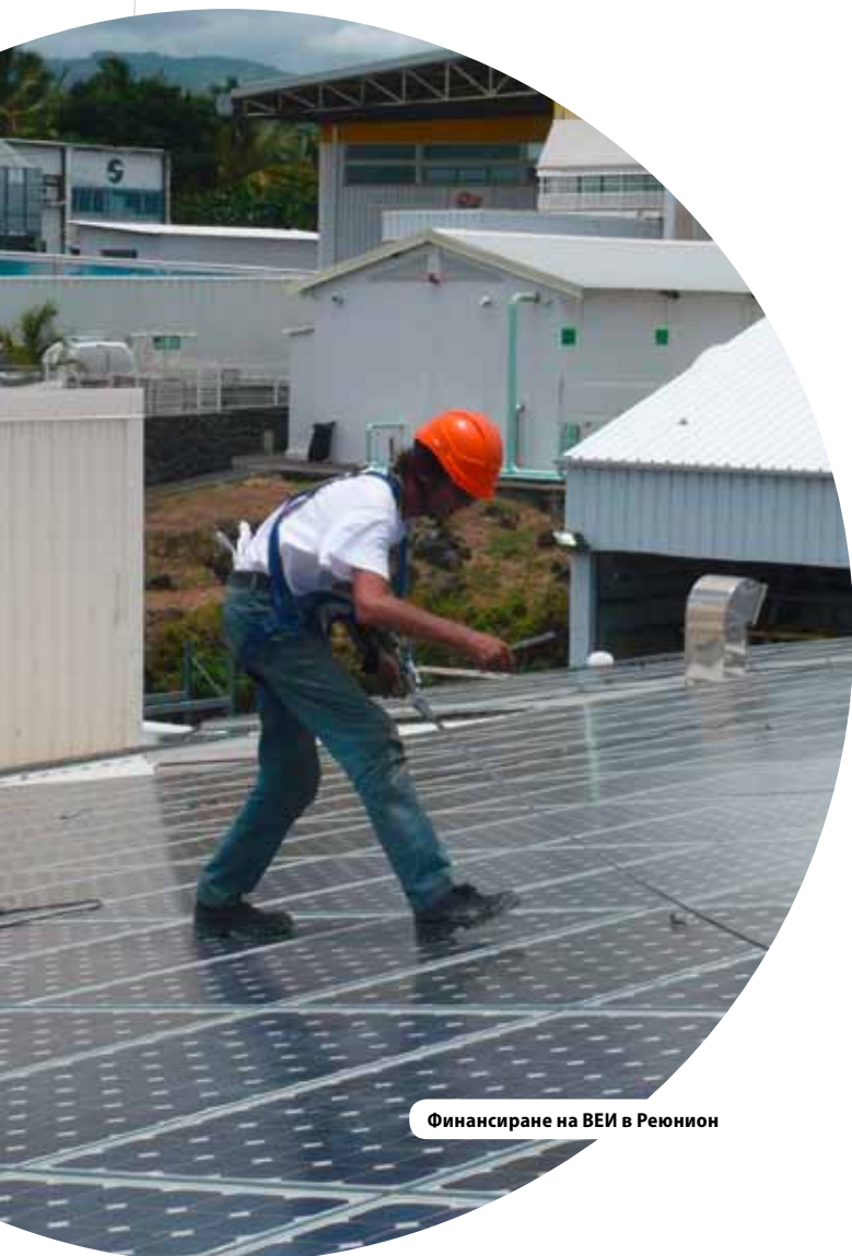
Финансиране на ВЕИ в Реюнион

” Това, което започна, като задължение за програмен контрол, сега е пример за модерно управление в обществената администрация “