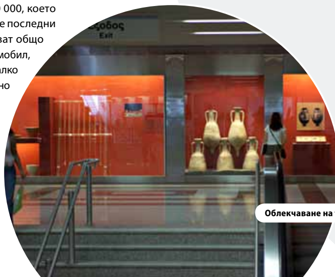
Облекчаване на трафика в Атина