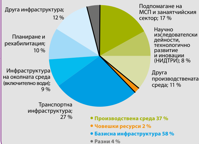
Области на интервенция (данни на ЕФРР от програмни допълнения 2000-2006 г.)

Политиката на сближаване подпомага борбата срещу промените в климата