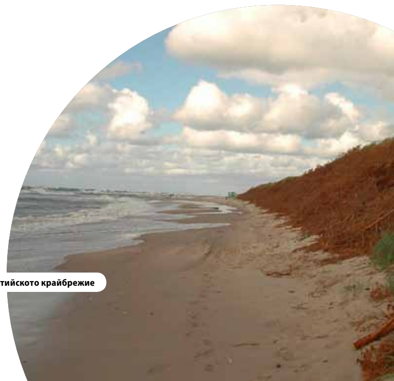
Защита на Балтийското крайбрежие