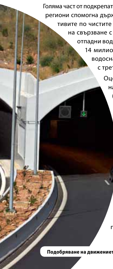
Подобряване на движението в Гърция

Преките инструменти (напр. финансови, най-вече субсидии, заеми и собствен капитал) са все още основни за подкрепата на ЕФРР за предприемачеството, иновациите и възлизат на около 69 % от разходите за периода. Оценката идентифицира тенденция от по-тясната стратегия за „преструктуриране и диверсификация“ към по-широки стратегии, с по-голям акцент върху иновациите и по-широк набор от инструменти. Използването на косвени инструменти (напр. Нефинансови, като бизнес услуги, намаляване на административните тежести, клъстери, мрежи и трансфер на знания) е нараснало значително за периода. Разнообразието от инструменти е най-очевидно при подкрепата на малките предприятия – обратно, подкрепата за големите предприятия е била почти изцяло под формата на безвъзмездни субсидии.