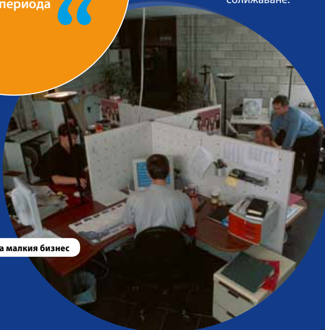
Подпомагане на малкия бизнес

Да и не. Ясно е, че финансирането трябва да бъде достатъчно голямо, за да осъществи разлика, която впечатлява, но не трябва да бъде твърде широко разпространено във всички политически области. Но тъй като регионите се различават по отношение на проблемите, пред които са изправени и техните специфични нужди, които са трудни за идентифициране централно, има ситуация, която им позволява да изберат ограничен брой области, в които да концентрират средствата. Това ще направи по-лесно мониторинга и оценката на политиката на сближаване.