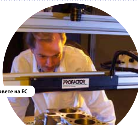
Проектът „Профактор“ показва ползата от фондовете на ЕС

„Дългият списък от успехи на програмния мониторинг в Германия предоставя стабилна основа за нарастващите широко-мащабни показатели, проследявани днес“